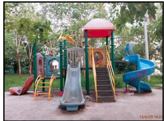
สนามเด็กเล่น