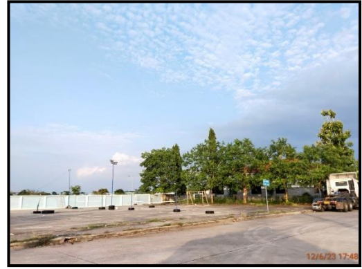
ลานค้าชุมชน