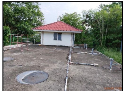
ระบบบำบัดน้ำเสียส่วนกลาง

ภาพที่ 1 พื้นที่โครงการปัจจุบัน (วันที่ 12 มิถุนายน พ.ศ. 2566)