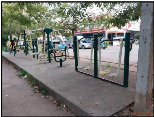
ลานออกกำลังกาย