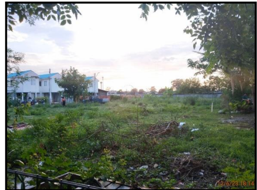
พื้นที่สำหรับสร้างโรงเรียนอนุบาล