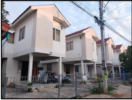
บ้านเดี่ยว 2 ชั้น