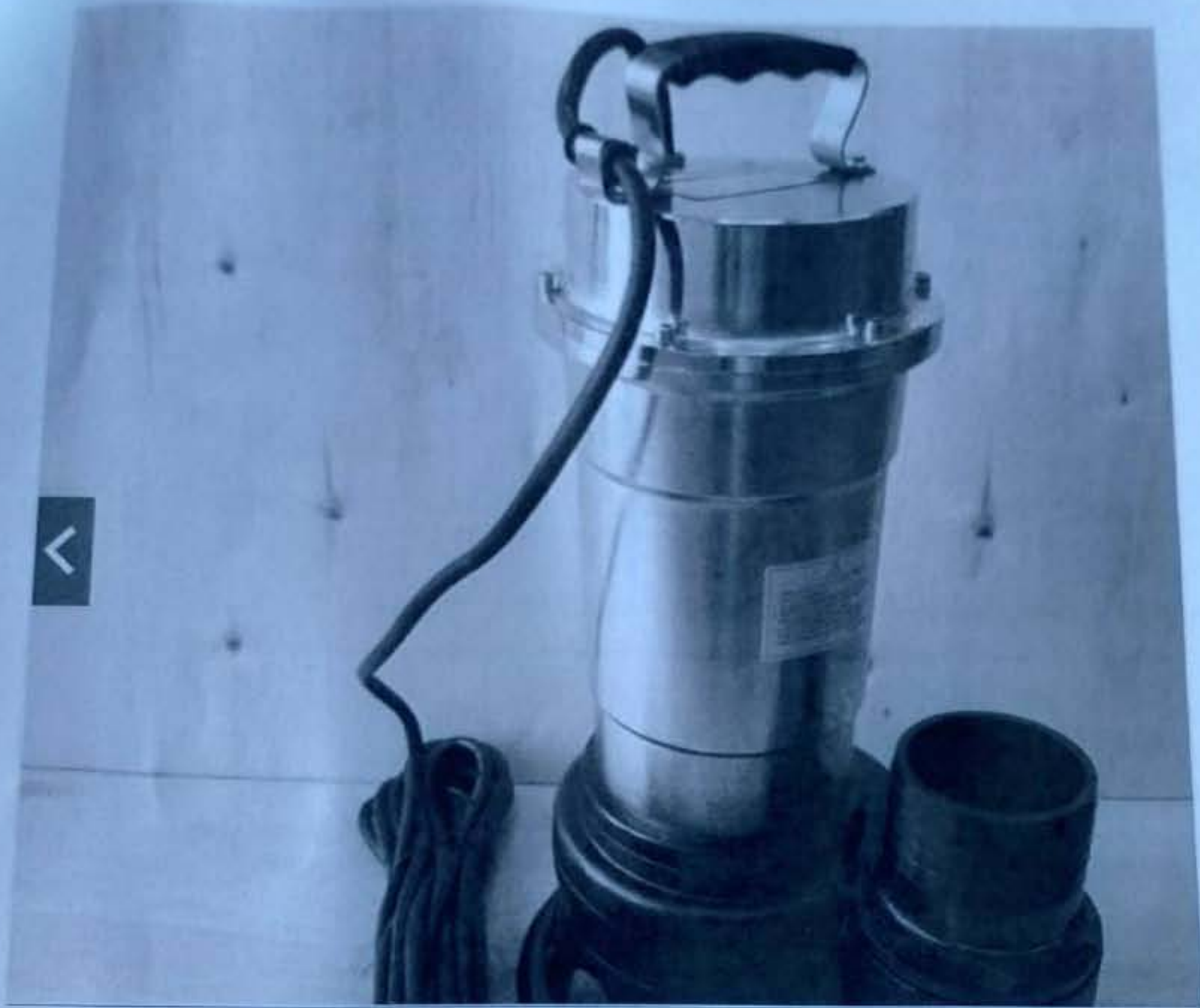
เครื่องสูบน้ำแบบจุ่ม แบบสอง 4 Submersible Highhead Pump 2 HP