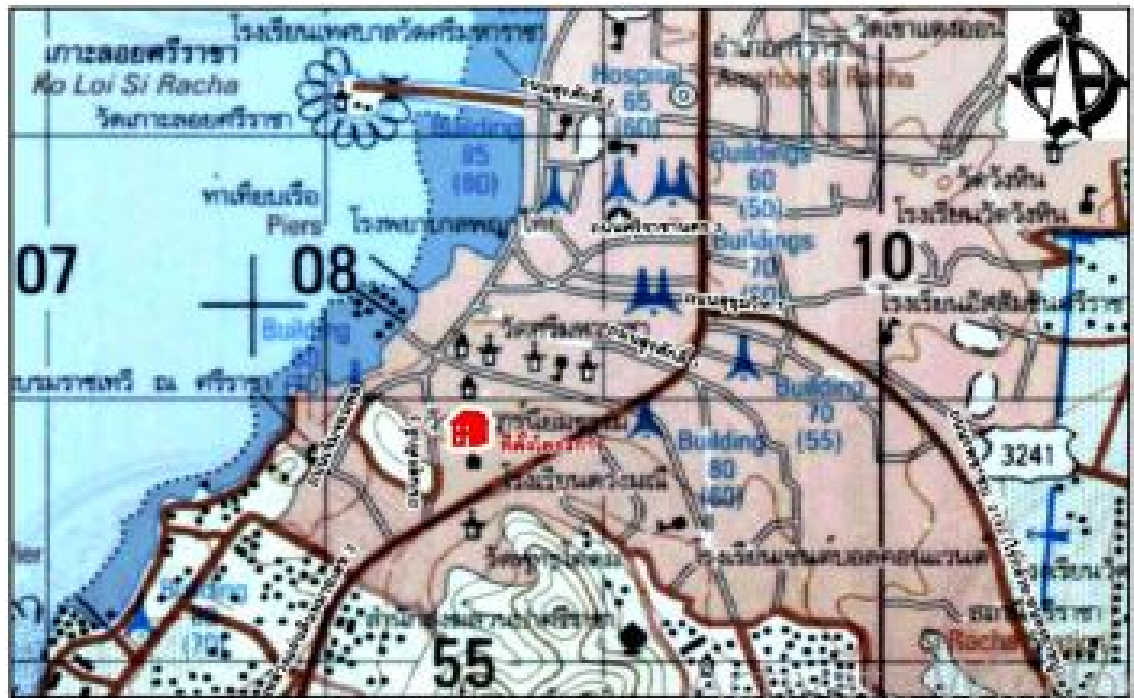
ภาพที่ 1.1 แผนที่แสดงที่ตั้งโครงการ