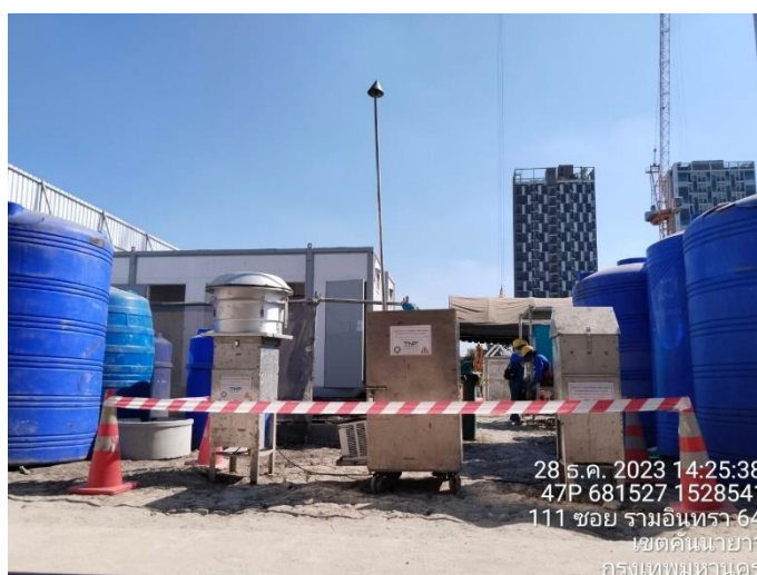
บริเวณพื้นที่โครงการด้านทิศเหนือ รูปที่ 4-1 การตรวจวัดคุณภาพสิ่งแวดล้อมของโครงการ ระหว่างวันที่ 13 พฤศจิกายน – 28 ธันวาคม พ.ศ. 2566