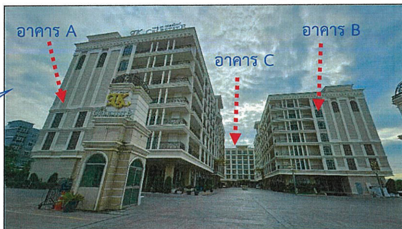
อาคารโรงแรม สูง 7 ชั้น มีชั้นใต้ดิน 1 ชั้น จำนวน 3 อาคาร

โครงการ “LK Celestite” ของบริษัท เซเลสไทท์ จำกัด ประกอบด้วย อาคารโรงแรมขนาดความสูง 7 ชั้น และชั้นใต้ดิน 1 ชั้น จำนวน 3 อาคาร โครงการมีห้องพักทั้งหมดจำนวน 410 ห้องและ สระว่ายน้ำจำนวน 1 แห่ง