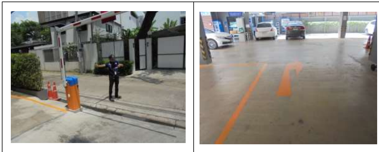
รูปที่ 1.7-1 สถานภาพปัจจุบันของโครงการ

สถานภาพของโครงการในปัจจุบัน ขณะทำการสำรวจเมื่อเดือนกรกฎาคม 2568 พบว่า โครงการอยู่ในช่วงระยะดำเนินการ แสดงสถานภาพโครงการในปัจจุบันได้ดังรูปที่ 1.7-1