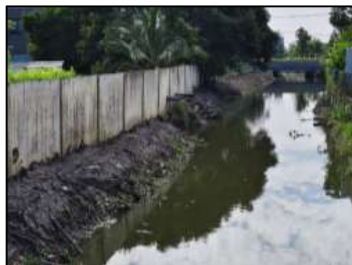
รูปที่ 13 คลองสาธารณะที่ได้รับการกำจัดวัชพืชและขุดลอกเรียบร้อยแล้ว