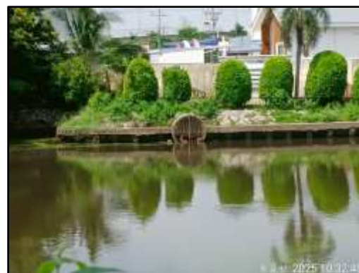
รูปที่ 38 ปลูกลงไม้บริเวณโดยรอบระบบบำบัด