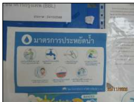
รูปที่ 21 บอร์ดประชาสัมพันธ์ประหยัดน้ำ