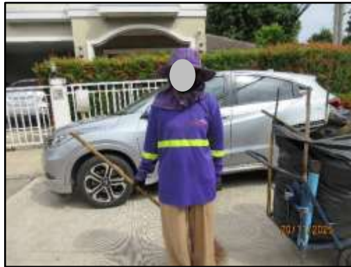
รูปที่ 30 พิจารณารับพนักงานภายในโครงการที่พักอาศัยในท้องถิ่นเป็นอันดับแรก