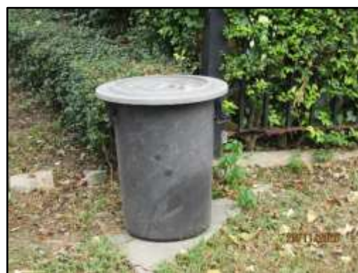
รูปที่ 23 ถังขยะภายในโครงการ