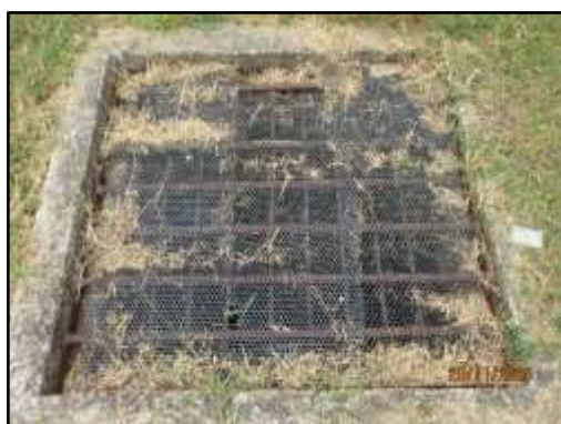
รูปที่ 14 ติดตั้งตะแกรงดักขยะในบริเวณรางระบายน้ำ