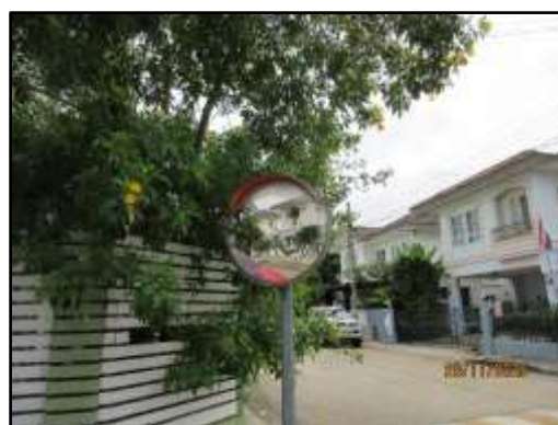
รูปที่ 18 กระงกนูน ป้ายสัญญาณจราจรและป้ายเตือนควบคุมความเร็ว