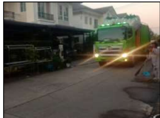
รูปที่ 24 รถเก็บขยะสำนักงานเขตสายไหม