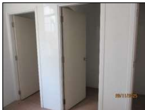
รูปที่ 8 ห้องน้ำภายในโครงการ