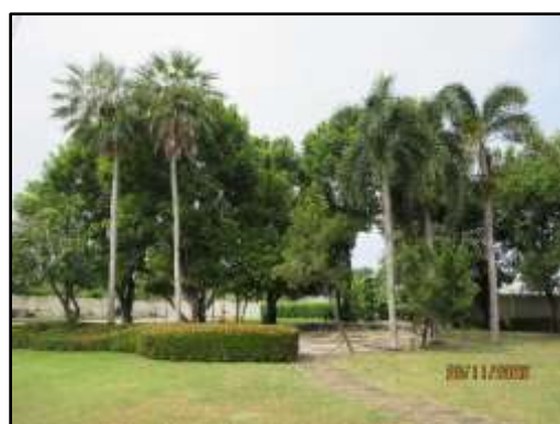
รูปที่ 2 พื้นที่สีเขียวภายในโครงการ