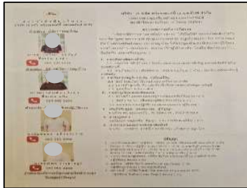
รูปที่ 29 คณะกรรมการประสานงานหมู่บ้าน