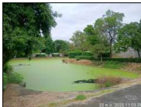
รูปที่ 11 บ่อหน่วงน้ำภายในโครงการ