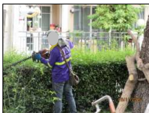
รูปที่ 3 พนักงานดูแลพื้นที่สีเขียวภายในโครงการ