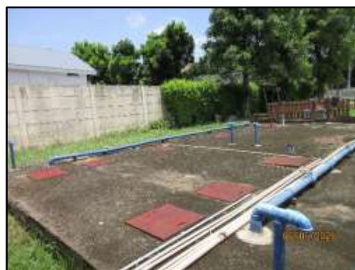
รูปที่ 4 ระบบบำบัดน้ำเสียภายในโครงการ และเจ้าหน้าที่ตรวจเช็คตะกอนในระบบบำบัดน้ำเสีย