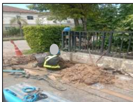
รูปที่ 22 เจ้าหน้าที่ซ่อมแซมระบบส่ง-จ่ายน้ำประปา