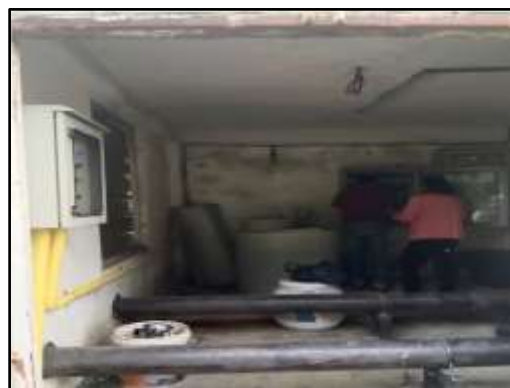
รูปที่ 6 เจ้าหน้าที่ผู้ดูแลระบบบำบัดน้ำเสีย