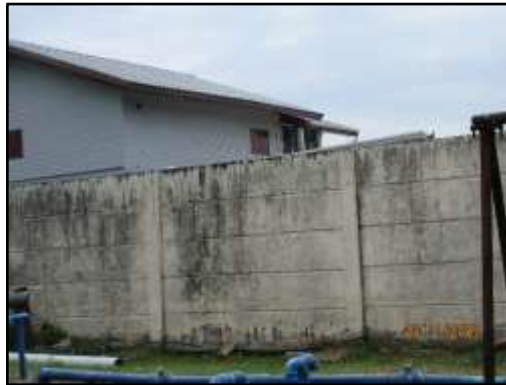
รูปที่ 39 แนวรั้วกันเขตที่ดินที่ติดกับคลองสาธารณะ