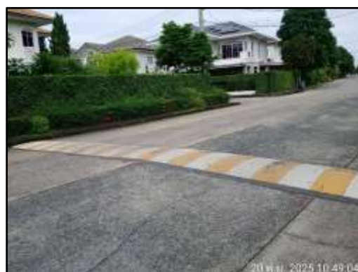
รูปที่ 20 สันนุนชะลอความเร็วภายในโครงการ