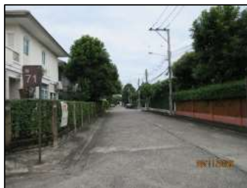
รูปที่ 19 ถนนภายในโครงการ