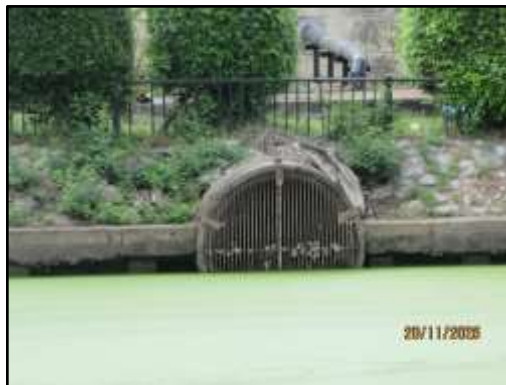
รูปที่ 40 ตะแกรงคัดมูลฝอยในบ่อเก็บน้ำ