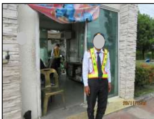
รูปที่ 17 เจ้าหน้าที่รักษาความปลอดภัย