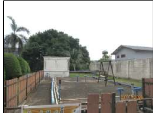
รูปที่ 38 (ต่อ) ปลุกต้นไม้บริเวณโดยรอบระบบบำบัด