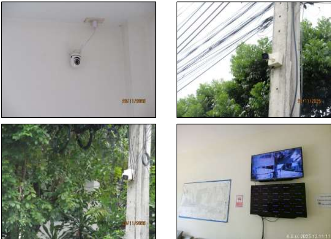
รูปที่ 34 กล้องวงจรปิดภายในโครงการ