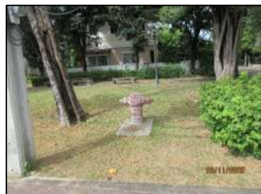
รูปที่ 32 หัวจ่ายน้ำดับเพลิง และถังดับเพลิงเคมีแบบมือถือ