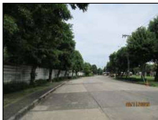
รูปที่ 2 (ต่อ) พื้นที่สีเขียวภายในโครงการ