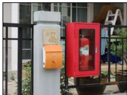
รูปที่ 32 (ต่อ) หัวจ่ายน้ำดับเพลิง และถังดับเพลิงเคมีแบบมือถือ