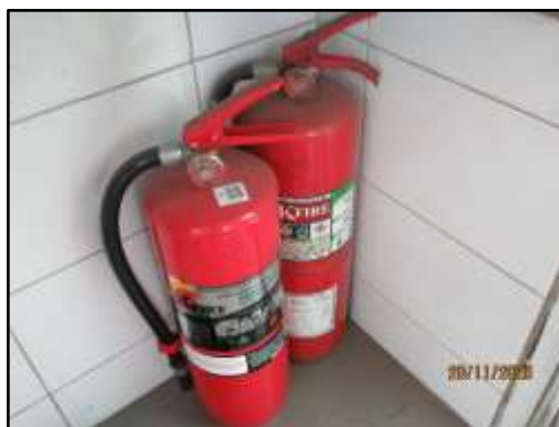
รูปที่ 37 ถังดับเพลิงเคมีประจำอยู่ภายในปัอมขาม