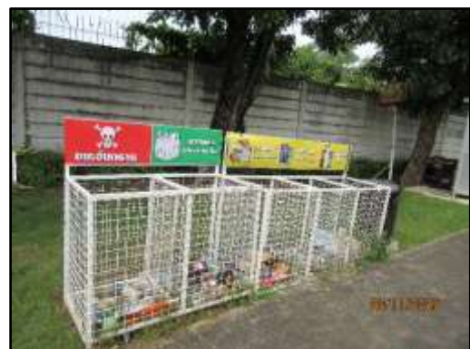
รูปที่ 25 ป้ายรณรงค์การคัดแยกขยะก่อนทิ้งถังขยะ