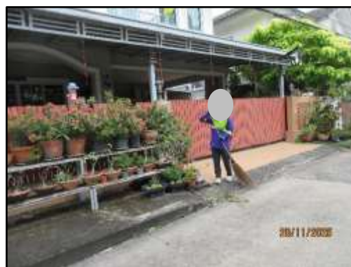
รูปที่ 15 เจ้าหน้าที่คอยทำความสะอาดบริเวณพื้นที่โครงการ