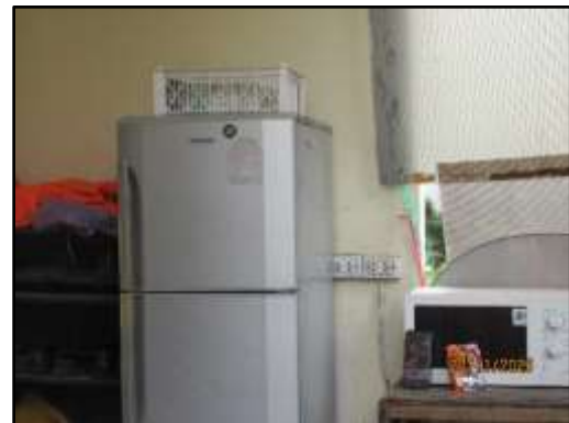
รูปที่ 31 เครื่องใช้สำหรับอุปโภคบริโภคสำหรับคนงาน