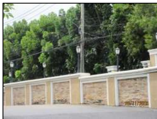
รูปที่ 16 ระบบไฟฟ้าส่องสว่างภายในโครงการ