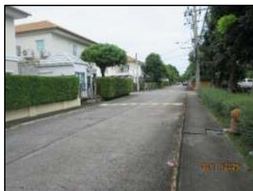
รูปที่ 1 สภาพแวดล้อมปัจจุบันของโครงการ