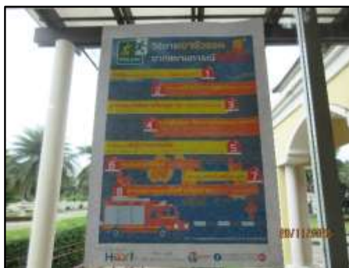
รูปที่ 35 วิธีการปฏิบัติตนกรณีเกิดอัคคีภัย และวิธีใช้งานถังดับเพลิง