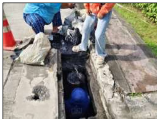
รูปที่ 10 ขุดลอกคูแ่ลทำความสะอาดท่อระบายน้ำภายในโครงการ