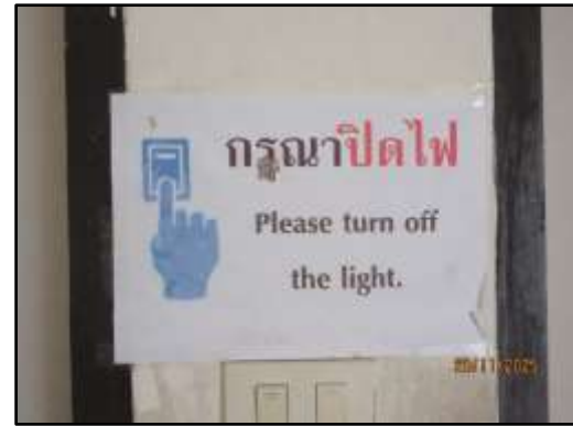
รูปที่ 26 ป้ายรณรงค์การใช้ไฟฟ้าอย่างประหยัด