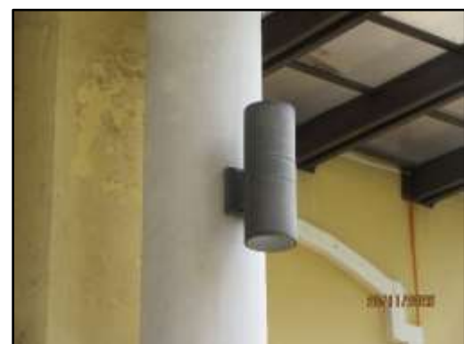
รูปที่ 28 เลือกใช้หลอดไฟแบบประหยัดพลังงาน