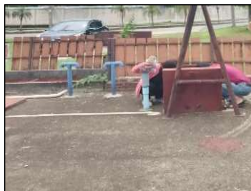
รูปที่ 4 (ต่อ) ระบบบำบัดน้ำเสียภายในโครงการ และเจ้าหน้าที่ตรวจเช็คตะกอนในระบบบำบัดน้ำเสีย