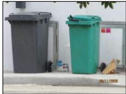
รูปที่ 23 (ต่อ) ถังขยะภายในโครงการ