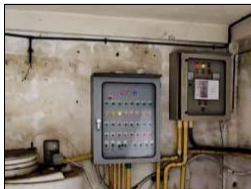
รูปที่ 9 มิเตอร์ไฟเฉพาะสำหรับระบบบำบัดน้ำเสีย และตู้ควบคุมระบบน้ำเสีย