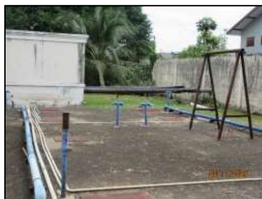
รูปที่ 5 ท่อระบายอากาศ ของระบบบำบัดน้ำเสีย