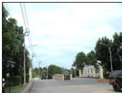
รูปที่ 16 (ต่อ) ระบบไฟฟ้าส่องสว่างภายในโครงการ