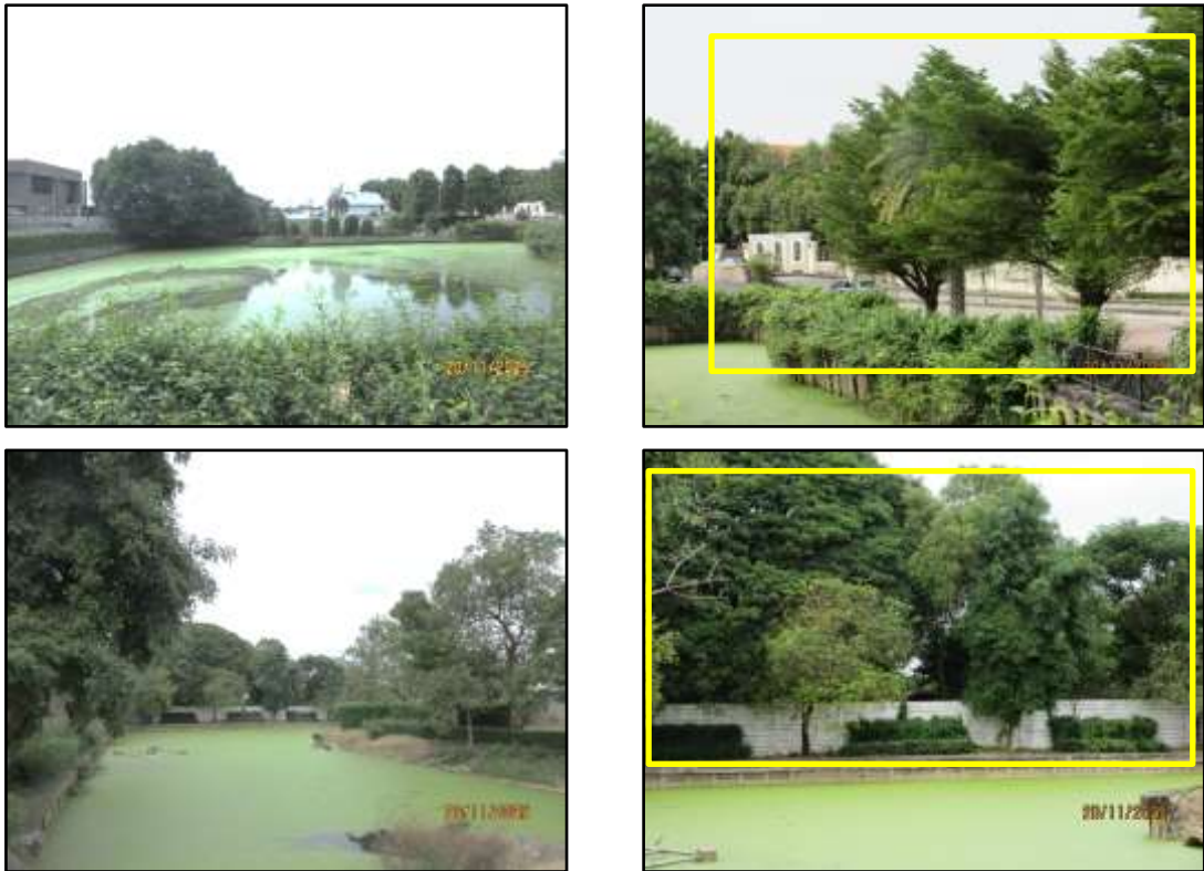
รูปที่ 33 ปลุกต้นไม้โดยรอบบ่อน้ำ