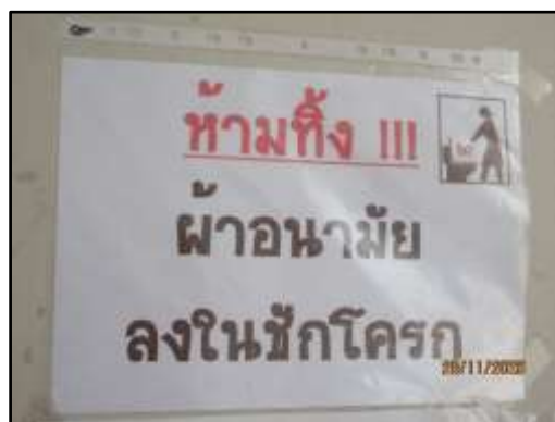
รูปที่ 7 ป้ายประชาสัมพันธ์ห้ามทิ้งสิ่งที่ย่อยสลายไม่ได้ลงในชักโครก