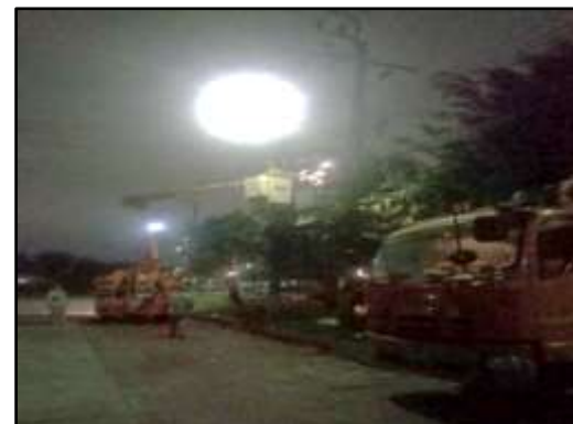
รูปที่ 27 การตรวจสอบดูแลและการติดตั้งระบบไฟฟ้าภายในโครงการ