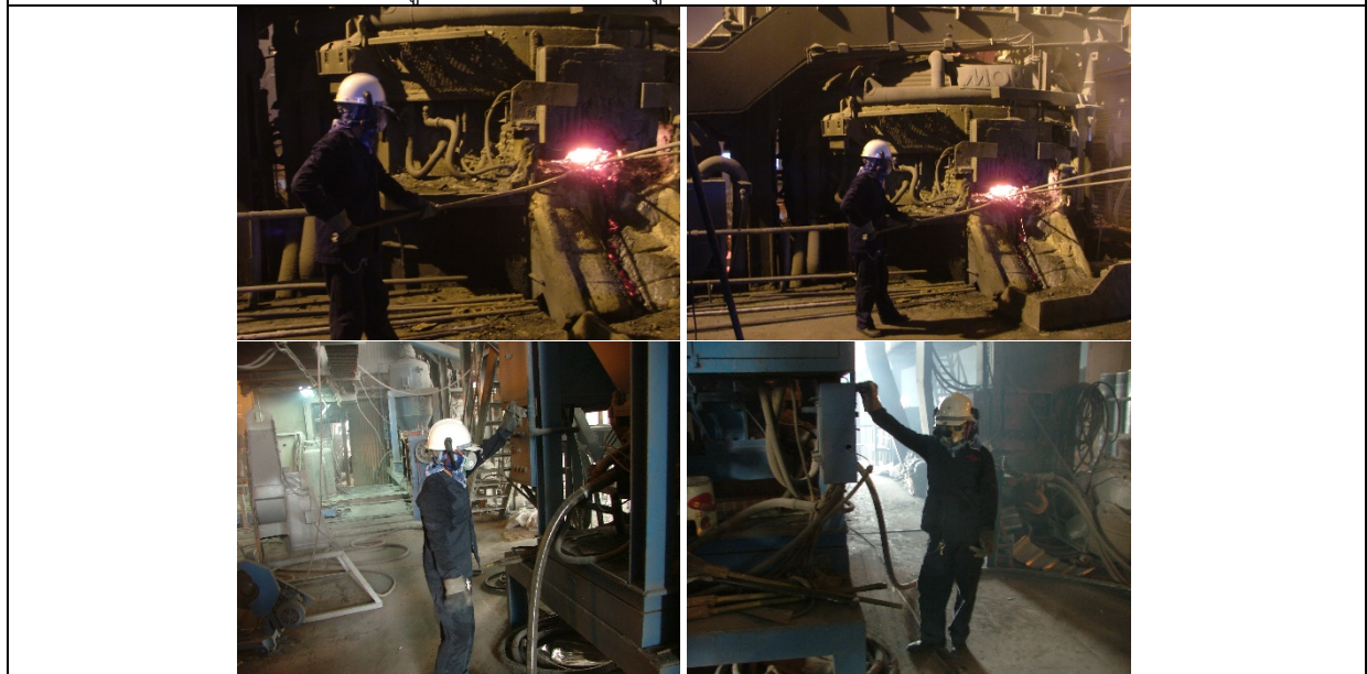
รูปที่ ๗7.10 พนักงานสวมใส่อุปกรณ์ป้องกันส่วนบุคคล