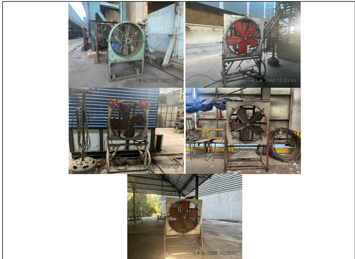
รูปที่ ๗.12 พัดลม

ภาพถ่ายผลการปฏิบัติตามมาตรการป้องกันและแก้ไขผลกระทบสิ่งแวดล้อมและติดตามตรวจสอบคุณภาพสิ่งแวดล้อม โครงการ โรงงานหลอมและรีดเหล็ก (ระยะดำเนินการ) ประจำเดือนกรกฎาคม-ธันวาคม 2568