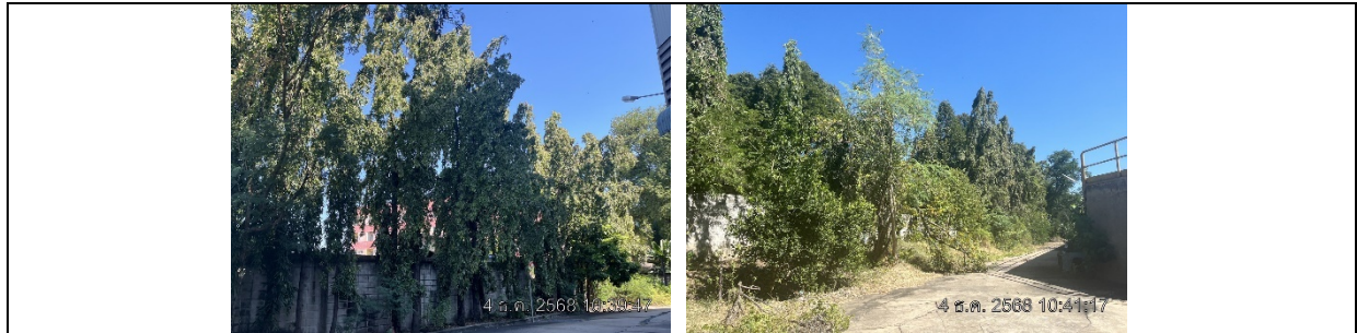
รูปที่ ๗7.9 ร้วคอนกรีตสูง 3 เมตร ล้อมรอบโครงการ

ภาพถ่ายผลการปฏิบัติตามมาตรการป้องกันและแก้ไขผลกระทบสิ่งแวดล้อมและติดตามตรวจสอบคุณภาพสิ่งแวดล้อม โครงการ โรงงานหลอมและรีดเหล็ก (ระยะดำเนินการ) ประจำเดือนกรกฎาคม-ธันวาคม 2568