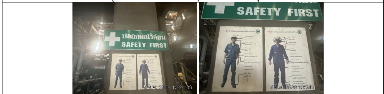
รูปที่ ๗7.11 ป้ายสัญลักษณ์การสวมใส่อุปกรณ์ป้องกันส่วนบุคคล