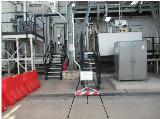
รูปที่ 2-8 การติดตามตรวจสอบระดับเสียง