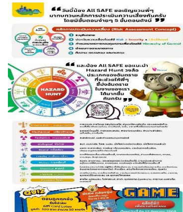
รูปที่ 2-13 กิจกรรมสัปดาห์ความปลอดภัย