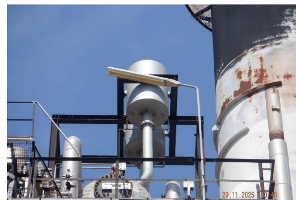
รูปที่ 2-7 โครงการติดตั้ง Silencers จำนวน 5 แห่ง