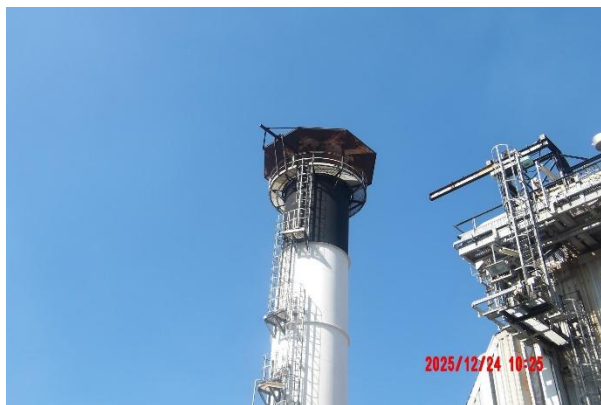
รูปที่ 2-1 ปล่องระบายอากาศเสียสูง 30 เมตร