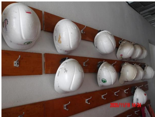
รูปที่ 2-12 อุปกรณ์ด้านความปลอดภัย