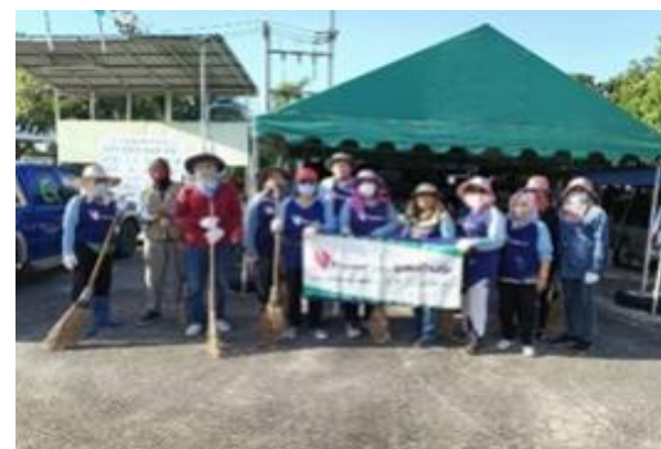
รูปที่ 2-4 ตัวอย่างโครงการที่ให้การสนับสนุนในการปรับปรุงด้านสิ่งแวดล้อม