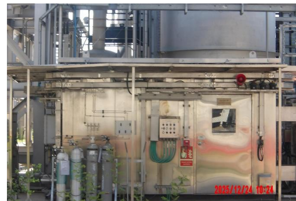
รูปที่ 2-2 ระบบตรวจสอบคุณภาพอากาศแบบต่อเนื่อง (CEMS)