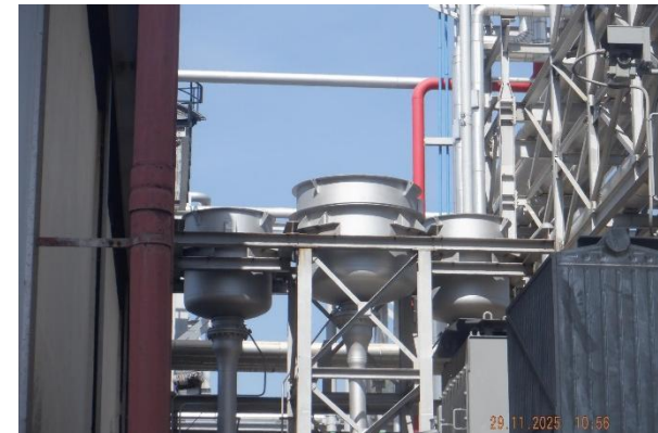
รูปที่ 2-7 (ต่อ) โครงการติดตั้ง Silencers จำนวน 5 แห่ง