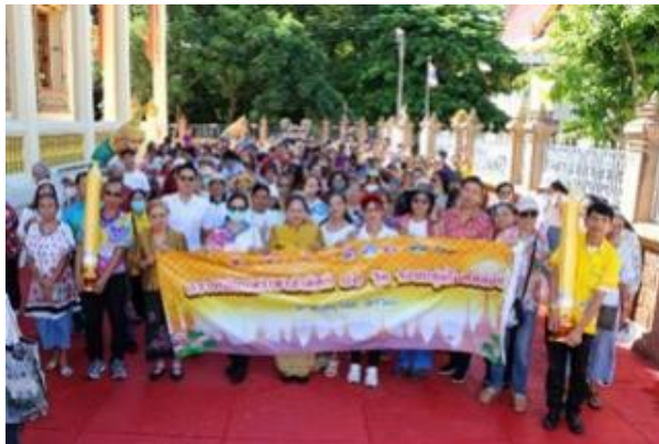
รูปที่ 2-5 (ต่อ) โครงการสนับสนุนและพัฒนาชุมชนด้านต่าง ๆ