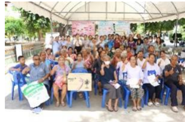
รูปที่ 2-5 โครงการสนับสนุนและพัฒนาชุมชนด้านต่าง ๆ