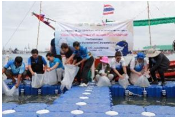
รูปที่ 2-4 (ต่อ) ตัวอย่างโครงการที่ให้การสนับสนุนในการปรับปรุงด้านสิ่งแวดล้อม