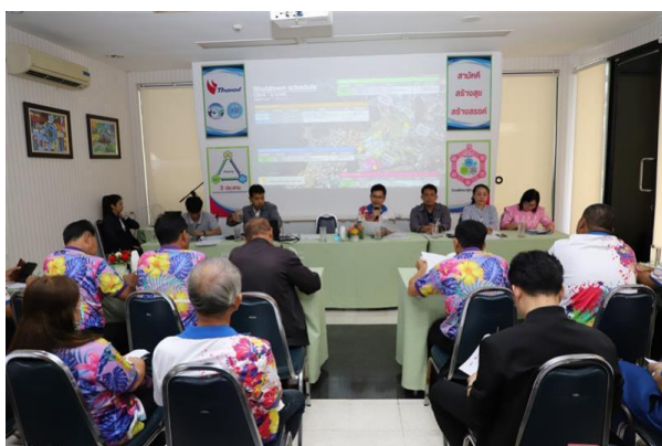
รูปที่ 2-6 (ต่อ) การประชาสัมพันธ์ข้อมูลโครงการ