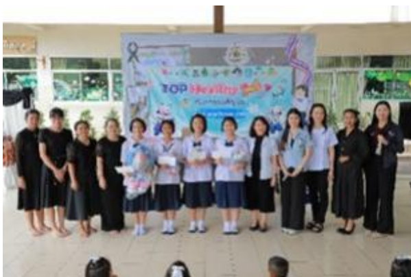
รูปที่ 2-5 (ต่อ) โครงการสนับสนุนและพัฒนาชุมชนด้านต่าง ๆ