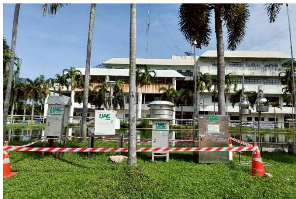
รูปที่ 2-3 การติดตามตรวจสอบคุณภาพอากาศในบรรยากาศ