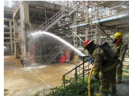
รูปที่ 2-11 การฝึกซ้อมแผนฉุกเฉิน