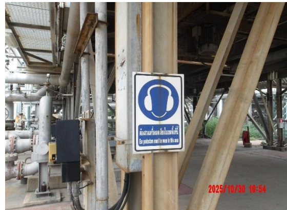
รูปที่ 2-10 ป้ายเตือนให้สวมปลั๊กอุดหู (Ear Plugs) หรือที่ครอบหู (Ear Muffs)