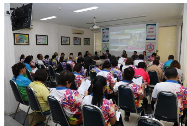
รูปที่ 2-6 การประชาสัมพันธ์ข้อมูลโครงการ