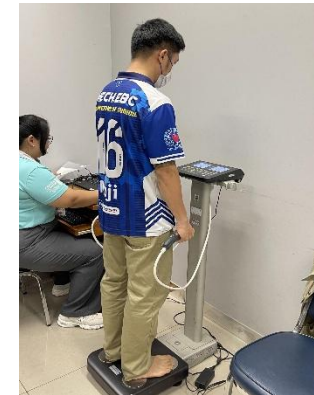
รูปที่ 2-9 การตรวจสอบสุขภาพพนักงาน