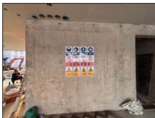
รูปที่ 31 ป้ายความปลอดภัยในการทำงาน