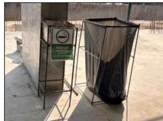
รูปที่ 45 พื้นที่สำหรับสูบบุหรี่ไว้แยกจากพื้นที่พักคนงานทั่วไป