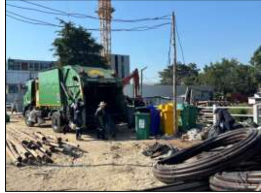
รูปที่ 42 รถเก็บขนมูลฝอยของสำนักงานเขตที่เกี่ยวข้องมาเก็บขนมูลฝอย ไปกำจัด