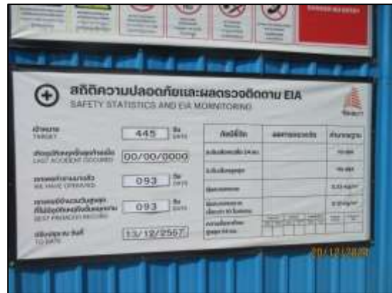
รูปที่ 33 ป้ายสถิติการเกิดอุบัติเหตุ และการบาดเจ็บ บริเวณด้านหน้าโครงการร่วม