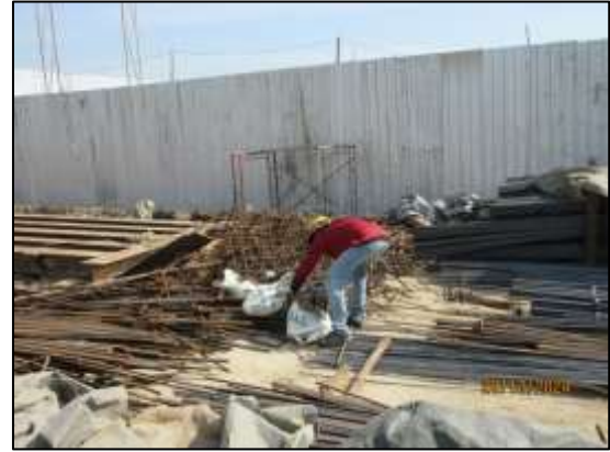
รูปที่ 25 พื้นที่สำหรับคัดแยกเศษวัสดุก่อสร้าง