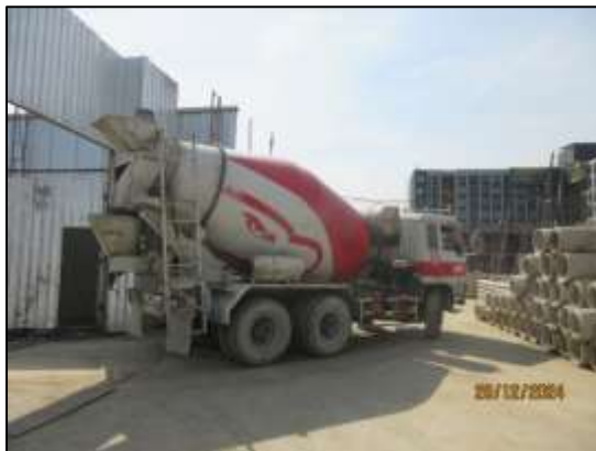
รูปที่ 13 พื้นที่สำหรับจัดเก็บปูนซีเมนต์ผง/เลือกใช้คอนกรีตผสมเสร็จในการก่อสร้าง