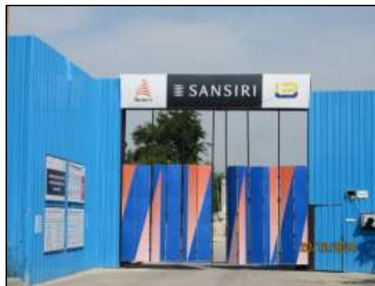
รูปที่ 4 จัดทำรั้ว Metal Sheet บริเวณ โดยรอบแนวเขตที่ดิน