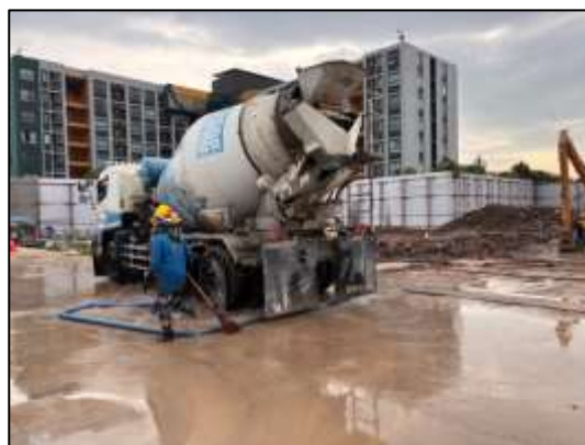
รูปที่ 39 พื้นที่สำหรับล้างล้อรถบรรทุก ทุกครั้งที่จะนำรถออกนอกพื้นที่ก่อสร้าง