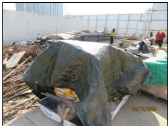
รูปที่ 10 พื้นที่สำหรับการกอง/เก็บวัสดุก่อสร้าง ภายในพื้นที่โครงการ