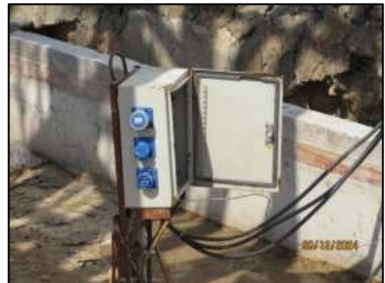
รูปที่ 24 ติดระบบมิเตอร์ไฟฟ้า เดินสายไฟฟ้าและระบบไฟฟ้าในพื้นที่ก่อสร้าง