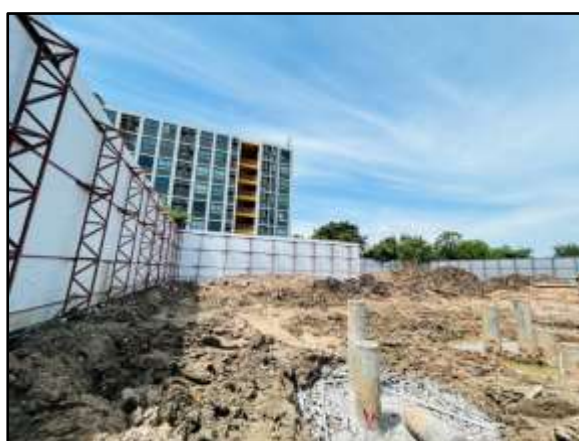
รูปที่ 5 ปรับสภาพพื้นที่ และดำเนินการก่อสร้างโครงการ เฉพาะภายในขอบเขตที่ดินของโครงการ