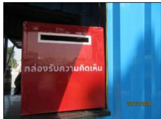
รูปที่ 3 ติดตั้งกล่องรับความคิดเห็นไว้บริเวณป้อมยามด้านหน้าโครงการ