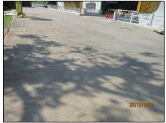
รูปที่ 14 คูแฉะรักษาปรับปรุงถนนบริเวณที่ใช้ในการเข้า-ออกช่วงก่อสร้าง ให้อยู่ในสภาพที่ใช้การได้ดี