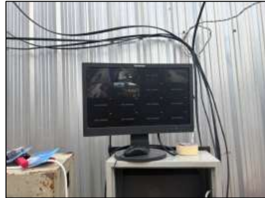
รูปที่ 44 ติดกล้องวงจรปิด CCTV ไว้บริเวณโดยรอบโครงการ พร้อมทั้งมีห้องควบคุมกล้องวงจรปิด