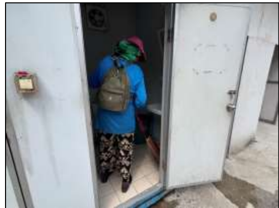
รูปที่ 20 ห้องส้วมให้เพียงพอความต้องการของคนงาน มีคนงานคอยดูแลรักษาความสะอาดอยู่เสมอ