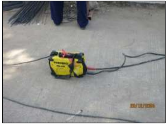
รูปที่ 7 เลือกใช้เครื่องจักรที่มีสภาพใหม่/เดินเครื่องด้วยไฟฟ้า อยู่ในสภาพพร้อมใช้งาน ในการก่อสร้าง