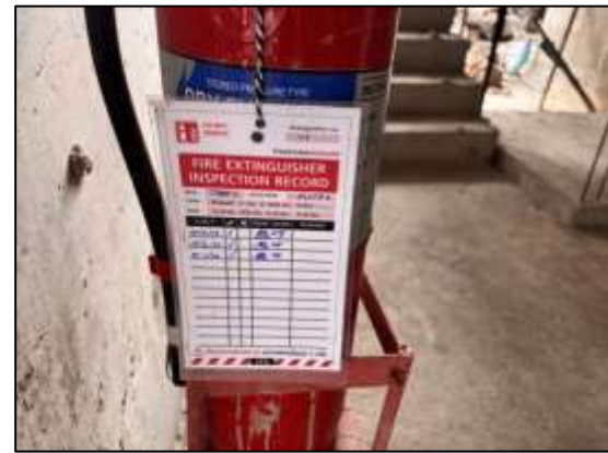
รูปที่ 26 ติดตั้งถังดับเพลิงชนิดมือถือไว้ภายในสำนักงานก่อสร้าง และพื้นที่เก็บวัสดุ