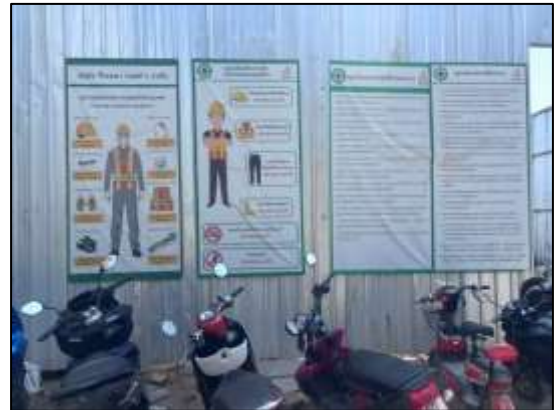
รูปที่ 19 (ต่อ) บริเวณพื้นที่บ้านพักคนงาน