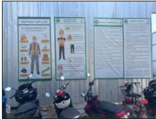
รูปที่ 38 ป้ายกฎระเบียบ/มาตรการควบคุมคนงานภายในที่โครงการ