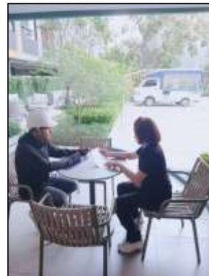
รูปที่ 40 เจ้าหน้าที่จากโครงการเข้าพบผู้พักอาศัยข้างเคียงโครงการ