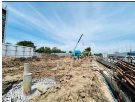
รูปที่ 16 เลือกใช้เสาเข็มกด ในการก่อสร้าง