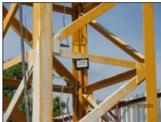
รูปที่ 30 ติดตั้งไฟฟ้าแสงสว่างภายในพื้นที่โครงการ ทั้งในเวลากลางวัน และกลางคืน