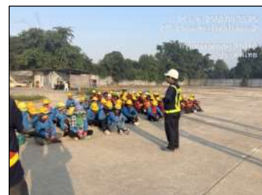
รูปที่ 41 การอบรมคนงานก่อสร้างเพื่อให้ความรู้ ความเข้าใจ ในการปฏิบัติงานที่ถูกต้องและปลอดภัย