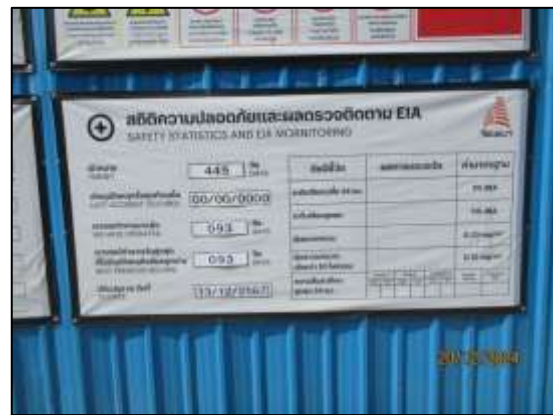
รูปที่ 2 ติดป้ายแจ้งการก่อสร้างโครงการ