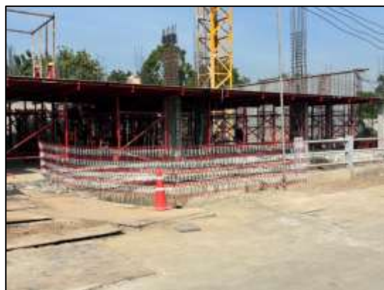
รูปที่ 18 ติดตั้งสิ่งกันตกหรือราวกัน