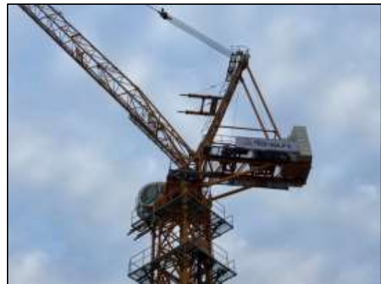
รูปที่ 29 ใช้เครนเป็นแบบพับแขนได้ และแขนของเครนจะต้องอยู่เฉพาะภายในพื้นที่โครงการเท่านั้น