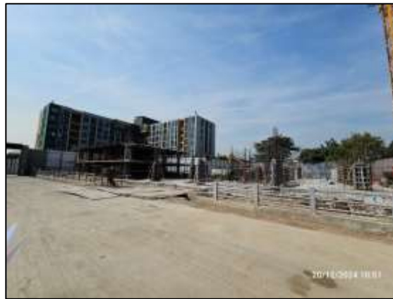
รูปที่ 1 สภาพพื้นที่ปัจจุบันของโครงการ