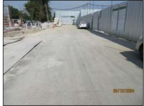
รูปที่ 22 พื้นที่จอดรถบรรทุก รถรับ-ส่งคนงานไว้ในโครงการ