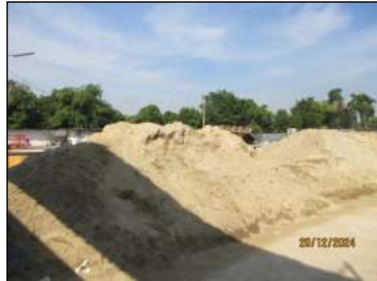
รูปที่ 12 พื้นที่สำหรับเก็บกองทรายในพื้นที่ก่อสร้าง