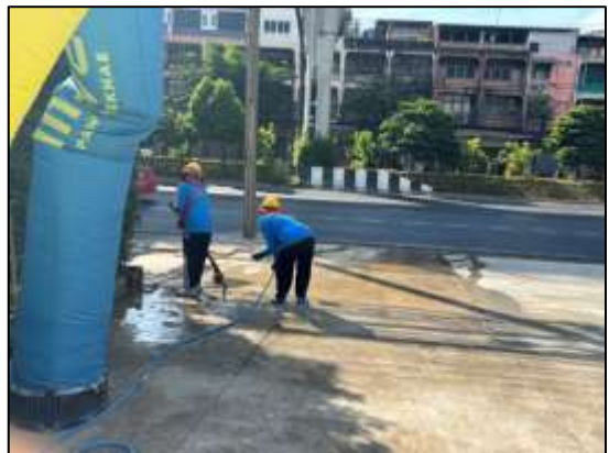
รูปที่ 8 เจ้าหน้าที่คอยกวาดเศษดิน/ทราย และฉีดพรมน้ำ บริเวณพื้นที่ก่อสร้างถนนบริเวณด้านหน้าโครงการ