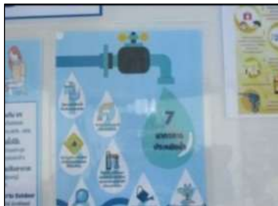
รูปที่ 34 ทำป้าย/บอร์ดประชาสัมพันธ์ให้ความรู้แก่คนงานก่อสร้าง