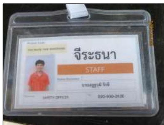
รูปที่ 35 เจ้าหน้าที่อาชีวอนามัยและความปลอดภัย (จป.)