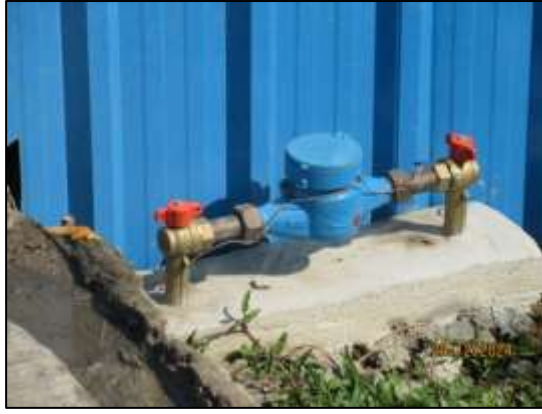
รูปที่ 11 แหล่งน้ำสำหรับใช้สปรอยละอองน้ำ