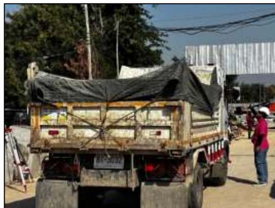
รูปที่ 36 ใช้ผ้าใบคลุมกระบะรถที่ขนส่งวัสดุก่อสร้าง