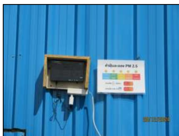
รูปที่ 6 ติดตั้งเครื่องตรวจวัดปริมาณฝุ่นละอองขนาด โดยแสดงผลแบบ Real time