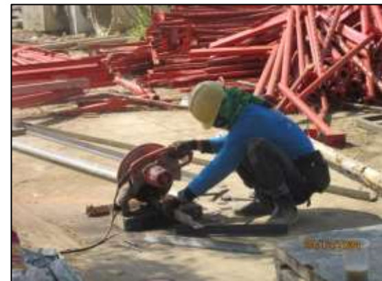
รูปที่ 27 การแต่งกายด้วยเสื้อผ้าที่รัดกุม เป็นชุดของบริษัทผู้รับเหมา และอุปกรณ์คุ้มครองความปลอดภัย