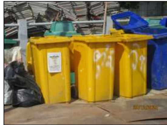
รูปที่ 28 ถังมูลฝอยภายในพื้นที่โครงการ