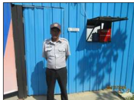
รูปที่ 21 เจ้าหน้าที่รักษาความปลอดภัยคอยอำนวยความสะดวก