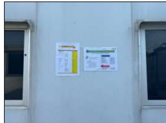
รูปที่ 43 คัดหมายเลขโทรศัพท์ของสถานดับเพลิง โรงพยาบาล และสถานีตำรวจภายในพื้นที่ก่อสร้าง