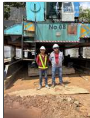
รูปที่ 37 เจ้าหน้าที่ดูแลบริเวณพื้นที่ก่อสร้าง เพื่อให้มีความเป็นระเบียบเรียบร้อย