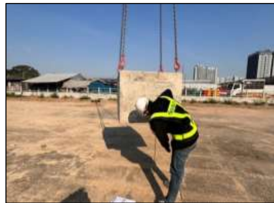
รูปที่17 การขนย้ายวัสดุขนาดใหญ่อย่างระมัดระวังเพื่อความปลอดภัยจากการตกหล่นและไม่ก่อให้เกิดเสียง