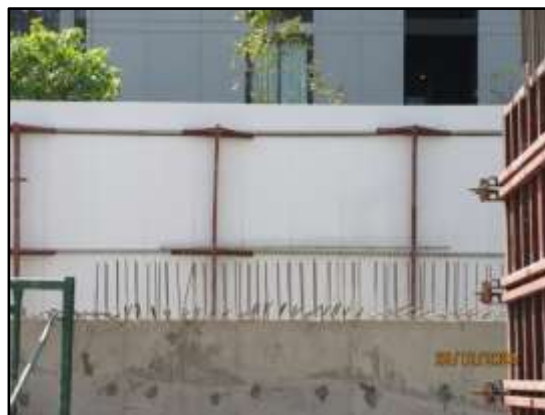
รูปที่ 15 ติดตั้งกำแพงกันเสียงบริเวณพื้นที่โครงการ