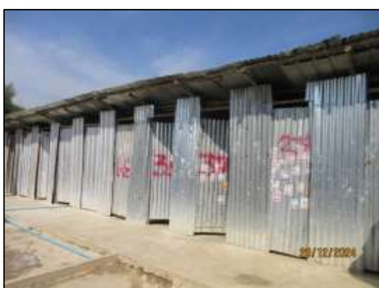
รูปที่ 19 บริเวณพื้นที่บ้านพักคนงาน