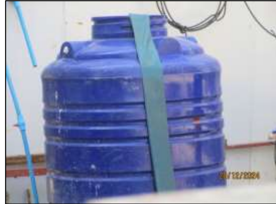
รูปที่ 32 ถังสำรองน้ำใช้ภายในพื้นที่โครงการ