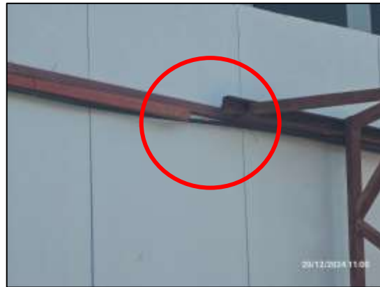
รูปที่ 9 ติดตั้งระบบพ่นละอองสเปรย์น้ำ รอบโครงการ