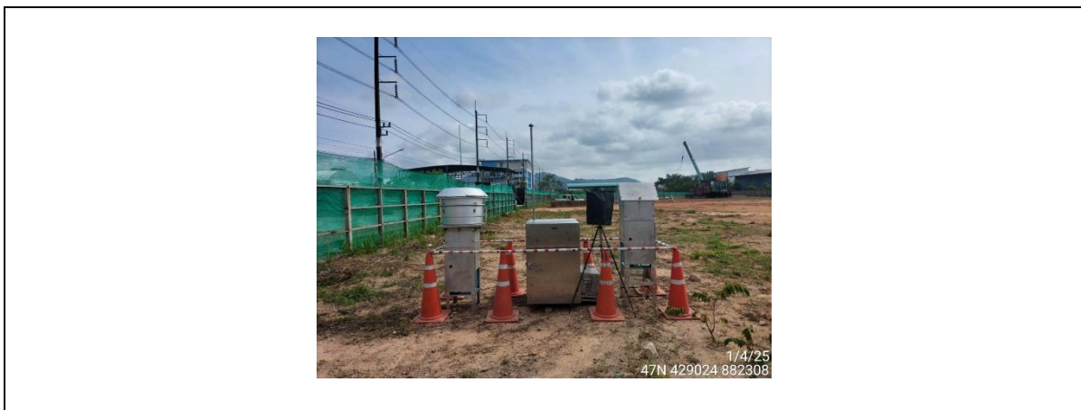
ภาคผนวกที่ ค - 2 ตรวจวัดคุณภาพอากาศ