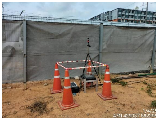
ภาคผนวกที่ ค - 4 ตรวจวัดค่าความสั่นสะเทือน