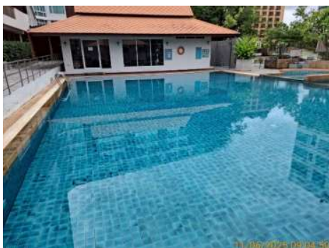
สระว่ายน้ำ