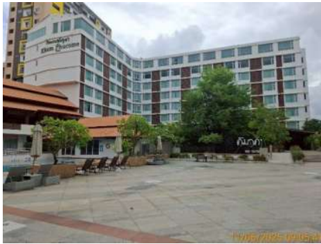
อาคารโครงการ