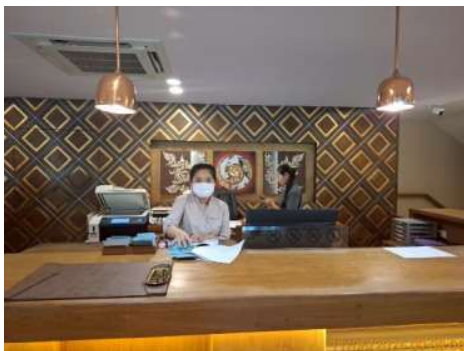
จุดต้อนรับผู้เข้าพักอาศัย (Reception)