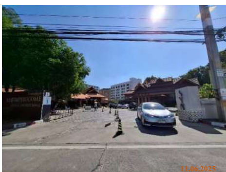
ทางเข้า-ออกโครงการ