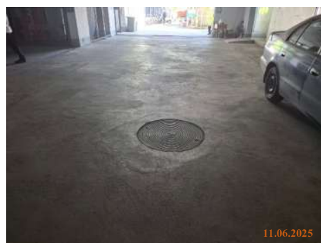
ระบบบำบัดน้ำเสีย

ภาพที่ 1 พื้นที่โครงการปัจจุบัน (วันที่ 11 มิถุนายน พ.ศ. 2568)