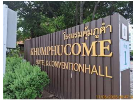
ป้ายชื่อโครงการ