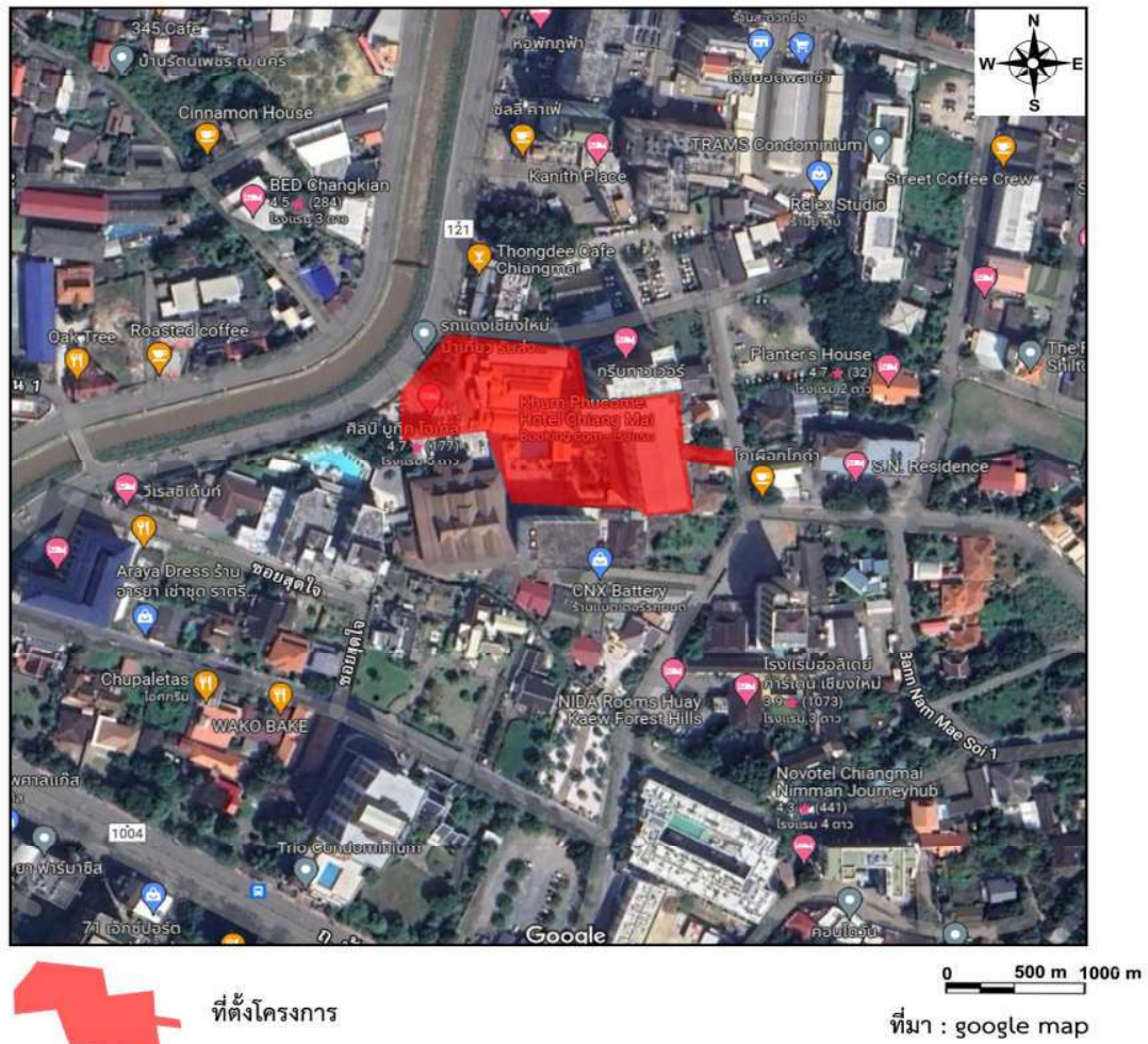
รูปที่ 1 ที่ตั้งโครงการ