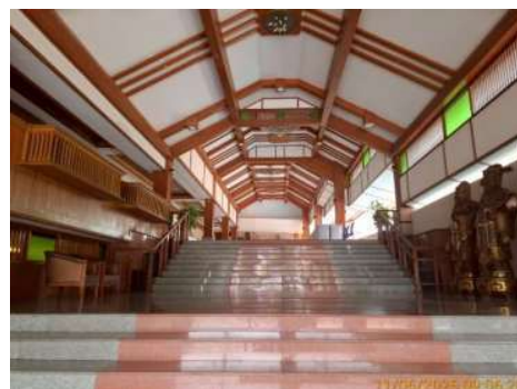
ทางขึ้น-ลงอาคาร