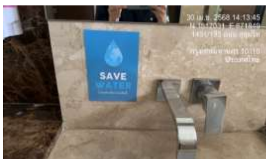
รูปที่ 9 ป้ายรณรงค์ประหยัดน้ำ