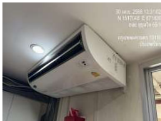
รูปที่ 19 เครื่องใช้ไฟฟ้าภายในโครงการ