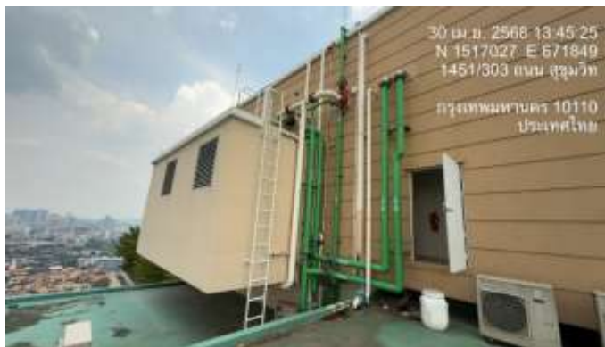
รูปที่ 17 ถังสำรองน้ำชั้นดาดฟ้า