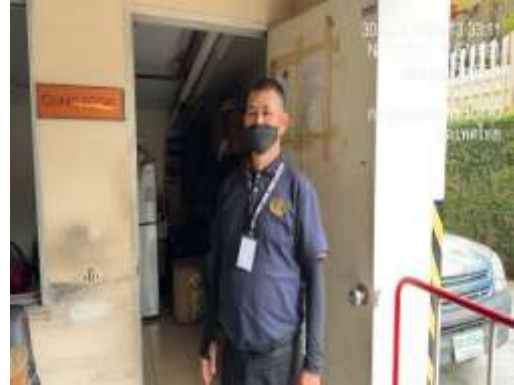
รูปที่ 2 เจ้าหน้าที่รักษาความปลอดภัย