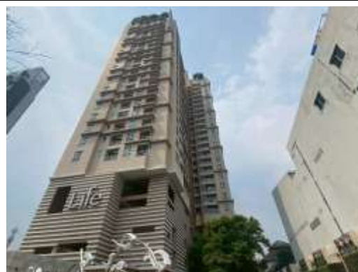
รูปที่ 18 สภาพปัจจุบันของโครงการ