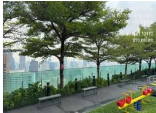
รูปที่ 7 พื้นที่สีเขียว