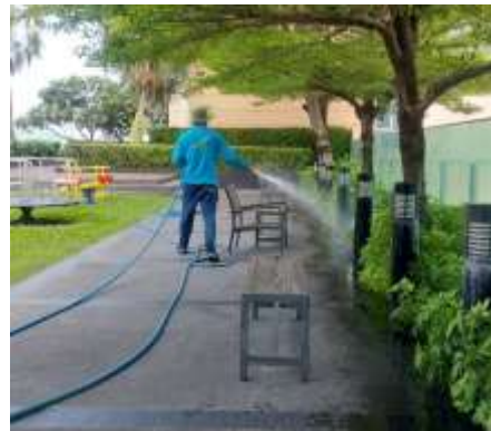
รูปที่ 30 เจ้าหน้าที่ดูแลพื้นที่สีเขียว