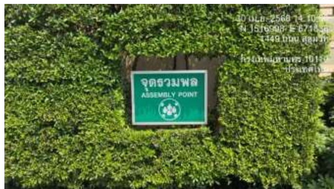
รูปที่ 31 จุดรวมพล