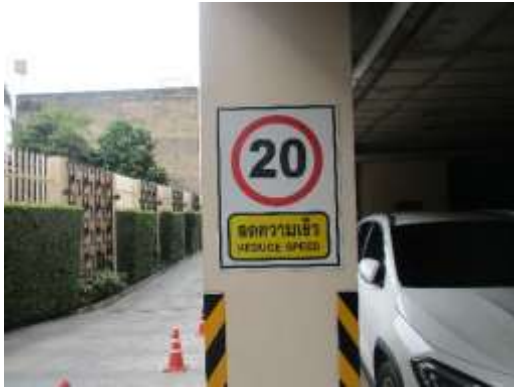
รูปที่ 5 ป้ายจำกัดความเร็ว 20 km./hr