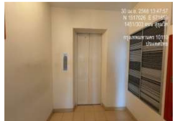
รูปที่ 35 ลิฟต์หนีไฟ