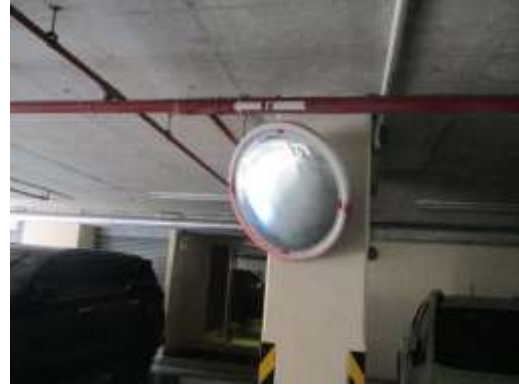
รูปที่ 6 กระจกนูน