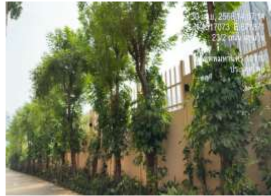
รูปที่ 41 ปลุกไม้ยืนต้น Noise Barrier