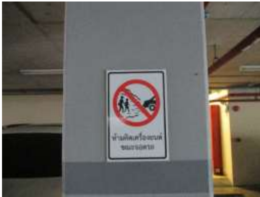
รูปที่ 1 “ห้ามติดเครื่องขณะจอดรถ”