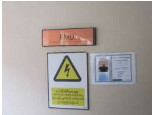
รูปที่ 27 ป้าย “ระวังไฟฟ้าแรงสูง”