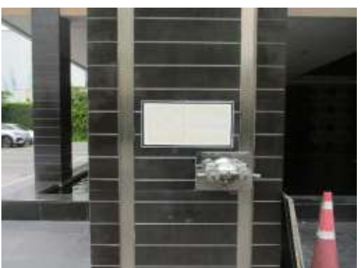
รูปที่ 26 อุปกรณ์ป้องกันและระบบเตือนอัคคีภัย