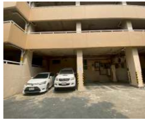
รูปที่ 3 พื้นที่จอดรถ