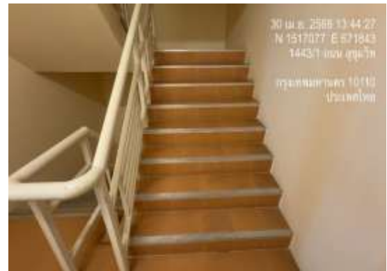
รูปที่ 32 บันไดหนีไฟ