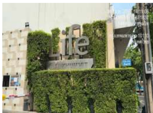
รูปที่ 12 ป้ายชื่อโครงการ