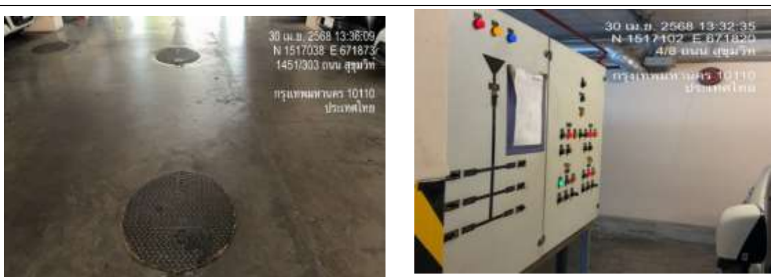
รูปที่ 8 ระบบบำบัดน้ำเสียของโครงการ