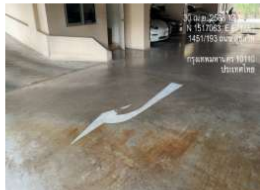
รูปที่ 4 สัญลักษณ์จราจรบนพื้นทาง