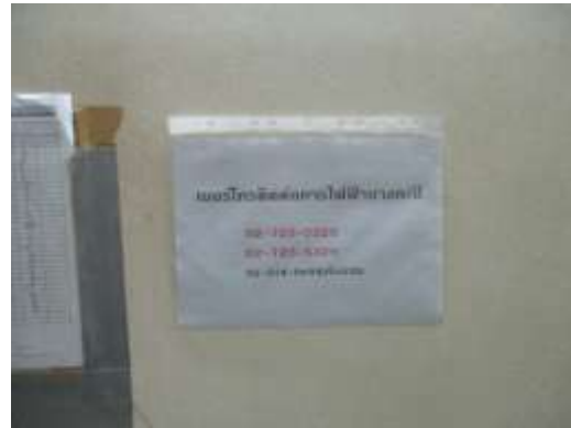
รูปที่ 28 เบอร์ดิตต่อเมื่อเกิดเหตุฉุกเฉิน บริเวณห้องควบคุมไฟ