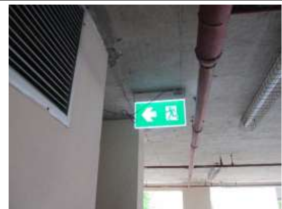
รูปที่ 34 เส้นทางหนีไฟ