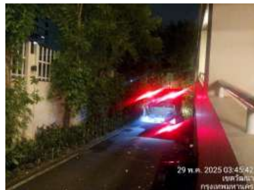
รูปที่ 42 สำนักงานเขตเข้าเก็บข้อมูลฝอย