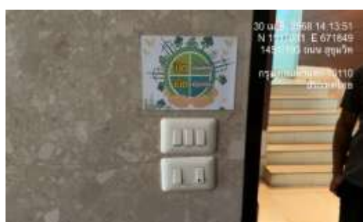
รูปที่ 10 ป้ายรณรงค์ประหยัดพลังงาน