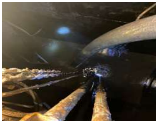
รูปที่ 44 การสูบน้ำก่อน พ.ศ 2567