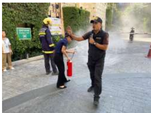
รูปที่ 43 การซ้อมอพยพหนีไฟ พ.ศ 2567