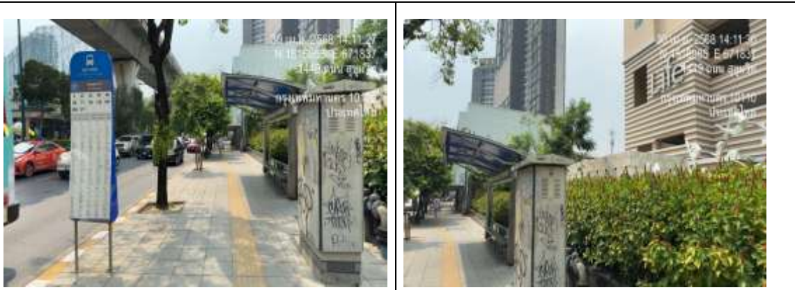
รูปที่ 40 การใช้ประโยชน์พื้นที่ของโครงการ