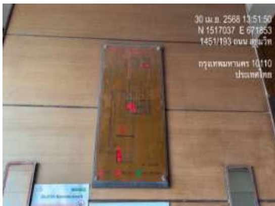
รูปที่ 33 แผนผังเส้นทางหนีไฟ