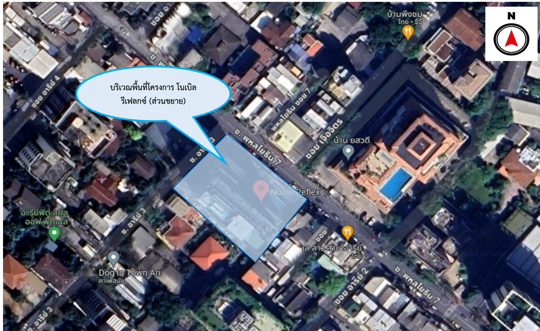
รูปที่ 1.1 พื้นที่ตั้งของโครงการ