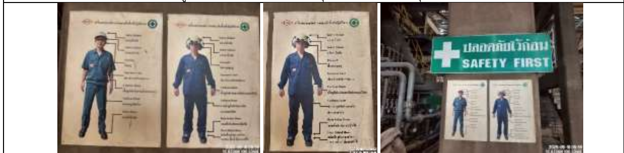
รูปที่ ผ7.11 ป้ายสัญลักษณ์การสวมใส่อุปกรณ์ป้องกันส่วนบุคคล