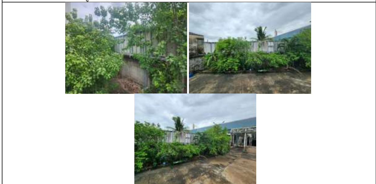
รูปที่ ๗7.9 รั้วคอนกรีตสูง 3 เมตร ล้อมรอบโครงการ