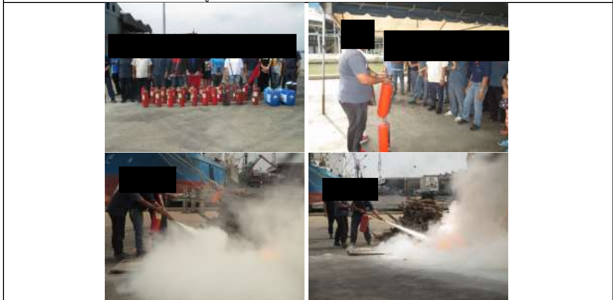
รูปที่ ๗7.14 การฝึกซ้อมดับเพลิง และฝึกซ้อมอพยพหนีไฟ ปี 2566