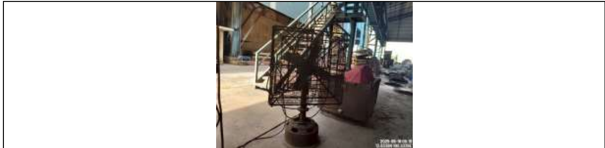
รูปที่ ๗7.12 พัดลม

ภาพถ่ายผลการปฏิบัติตามมาตรการป้องกันและแก้ไขผลกระทบสิ่งแวดล้อมและติดตามตรวจสอบคุณภาพสิ่งแวดล้อม โครงการ โรงงานหลอมและรีดเหล็ก (ระยะดำเนินการ) ประจำปีเดือนมกราคม-มิถุนายน 2568