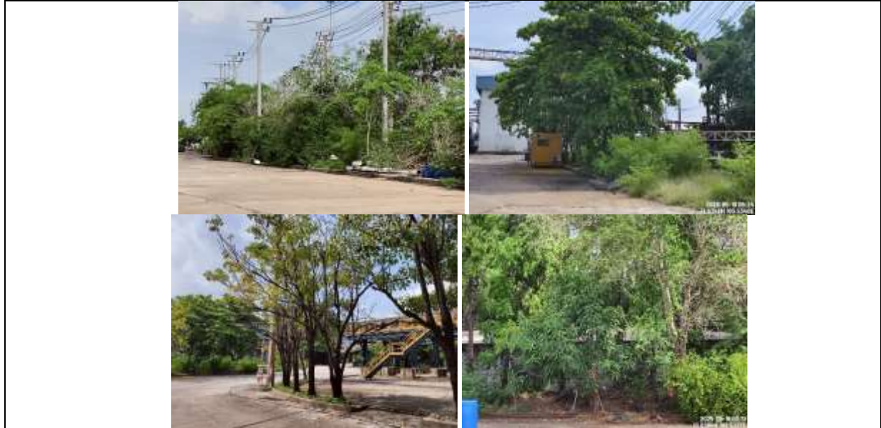
รูปที่ ๗7.13 พื้นที่สีเขียวภายในพื้นที่โรงงาน