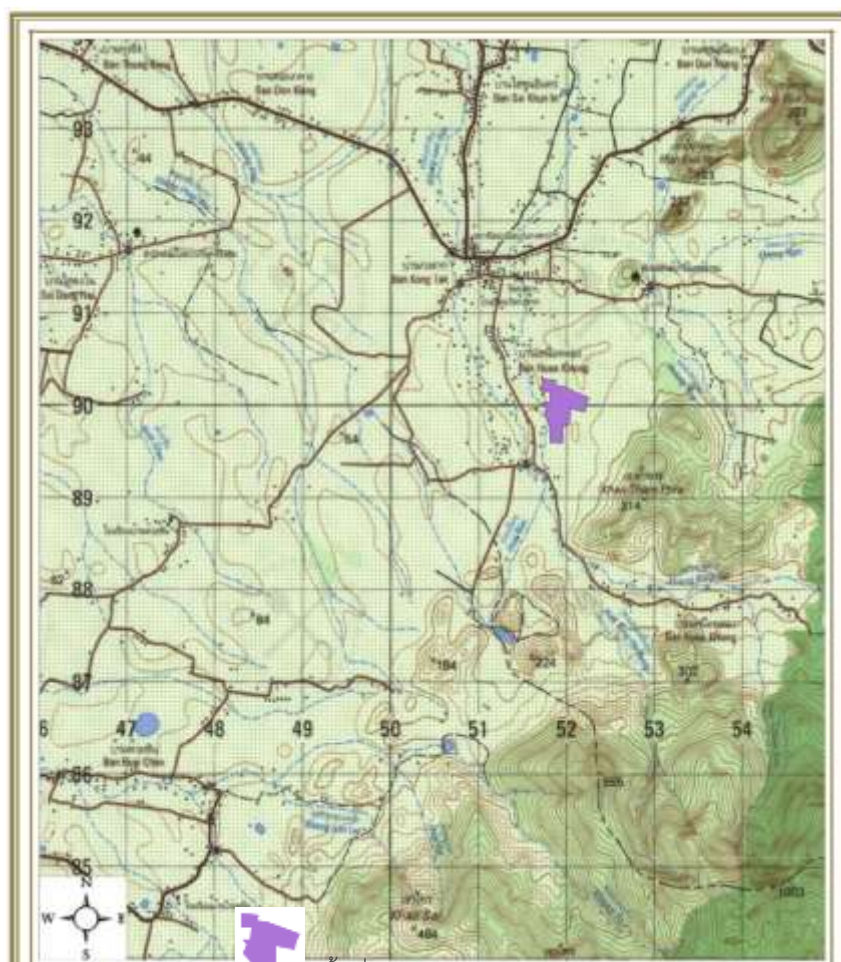
สัญลักษณ์: พื้นที่ประทานบัตร