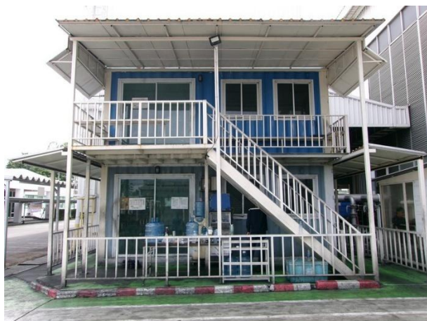
รูปที่ 2-32 ห้องพักผ่อนของพนักงานในแผนกทุบขึ้นรูป