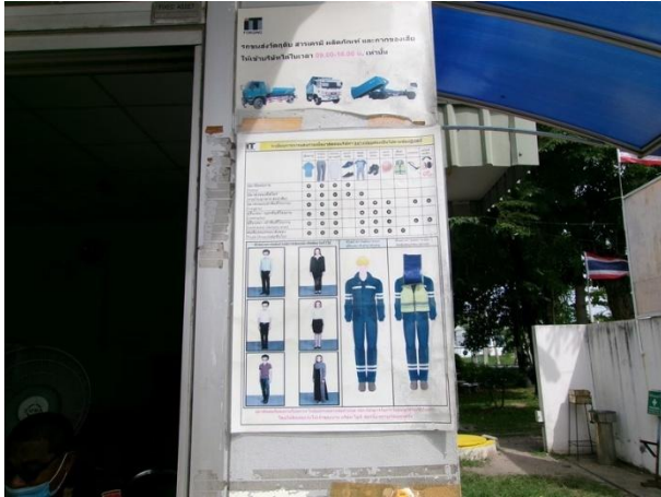
รูปที่ 2-27 ป้ายจำกัดเวลาขนส่งขนส่งวัสดุดิบ สารเคมี ผลิตภัณฑ์ และกากของเสีย