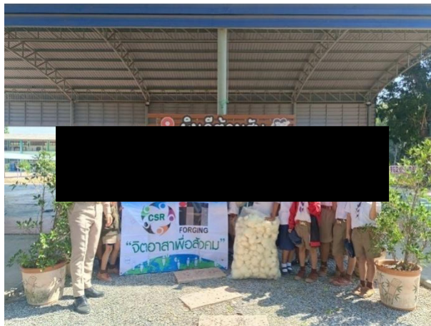
มอบของขวัญวันเด็ก