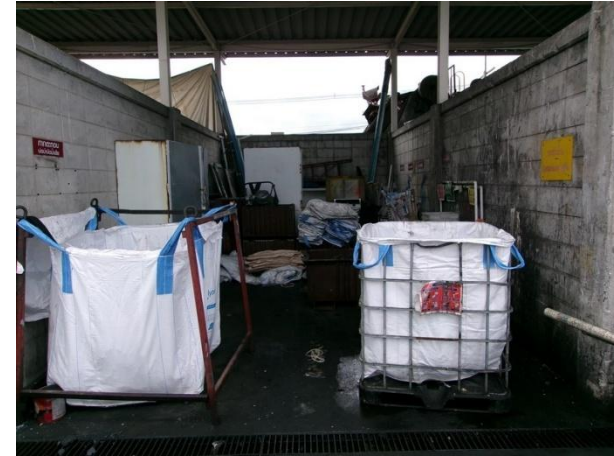
รูปที่ 2-14 โรงเก็บขยะอันตราย