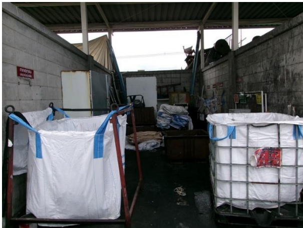
รูปที่ 2-17 ตะกรันจากระบบบำบัดน้ำเสีย ในโรงเก็บขยะ