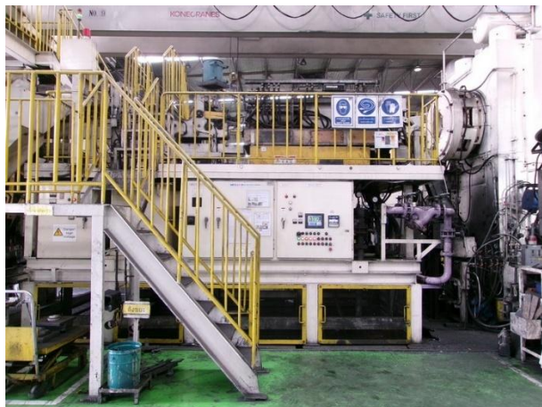
รูปที่ 2-30 แยกพื้นที่ระหว่างพนักงานและเครื่องให้ความร้อนเหล็กท่อน โดยติดตั้งเครื่องจักรบนชั้นลอย