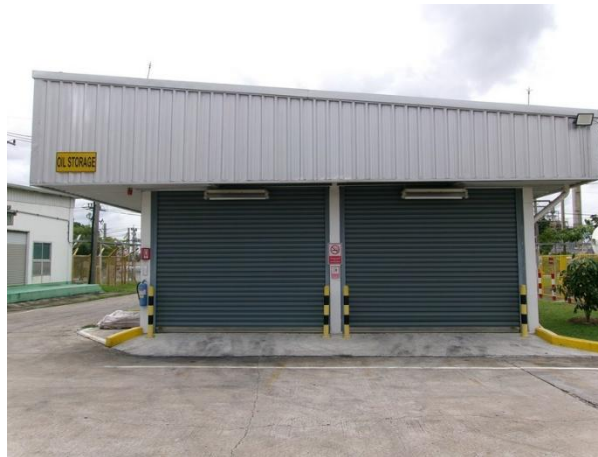
รูปที่ 2-49 การจัดเก็บสารเคมีไว้ในอาคารที่มีหลังคาปกคลุม เพื่อป้องกันการรั่วไหลลงสู่รางระบายน้ำฝน