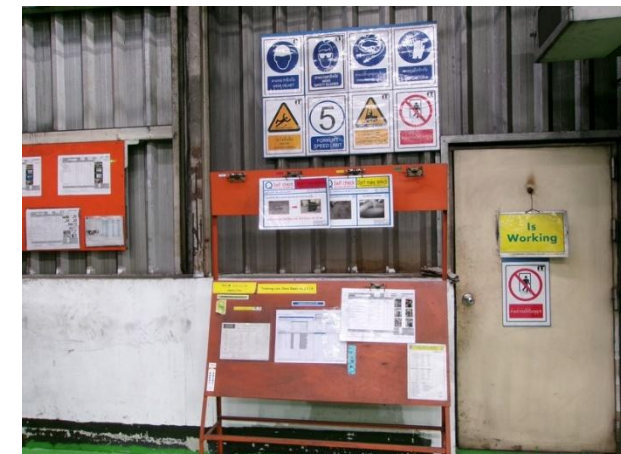
รูปที่ 2-45 ติดตั้งป้ายเตือนหรือสัญลักษณ์ประเภทอุปกรณ์ป้องกันอันตรายส่วนบุคคลที่ต้องสวมใส่บริเวณหน้าประตูทางเข้าบริเวณปฏิบัติงาน