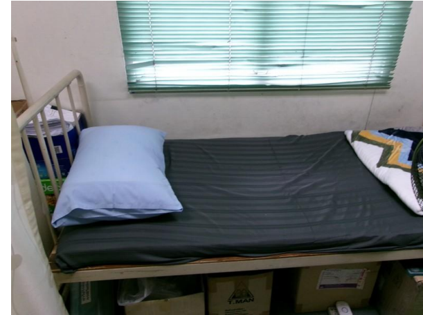
เตียงคนไข้