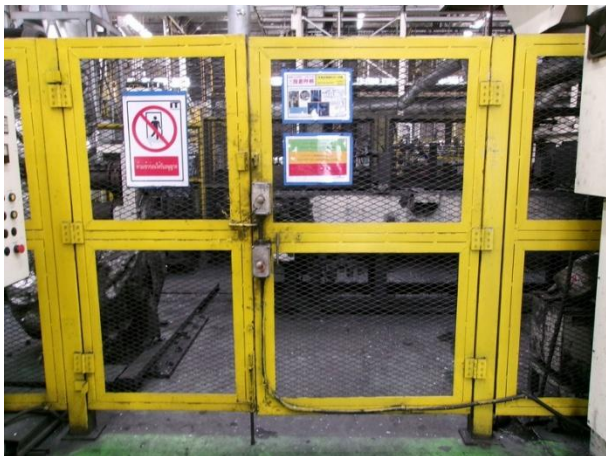
รูปที่ 2-47 การติดตั้งรั้วล้อมรอบบริเวณหุ่นยนต์แขนกลสำหรับหยิบชิ้นงาน และมีระบบ Safety plugs