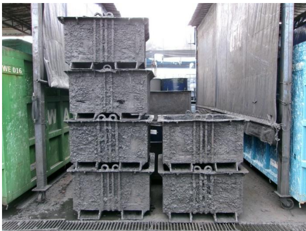
รูปที่ 2-25 รางดักน้ำมันบริเวณด้านหน้าของโรงเก็บขยะ (ภายใต้หลังคา)