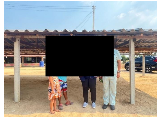
โครงการช่วยเหลือผู้พิการ 31/1/25