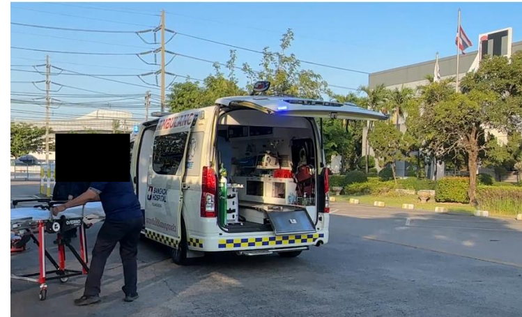
รูปที่ 2-58 รถพยาบาล