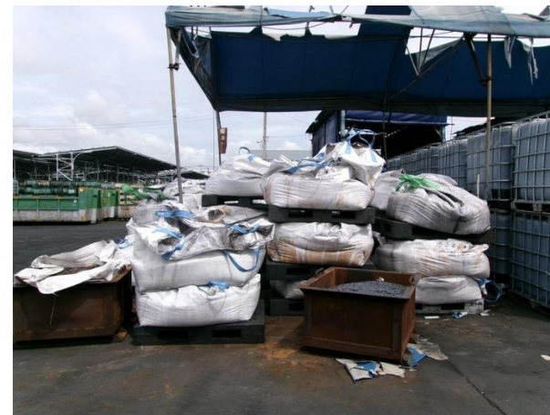
รูปที่ 2-22 ฝุ่นละอองและเม็ดเหล็กเสื่อมสภาพจัดเก็บใน Big Bag รวบรวมภายในโรงเก็บขยะ