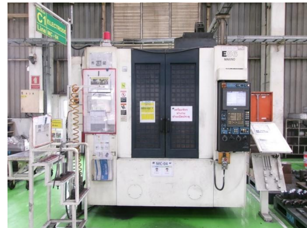
รูปที่ 2-48 เครื่องจักร CNC มีระบบ Interlock กรณีเครื่องจักรทำงานจะทำการปิดประตูอัตโนมัติ