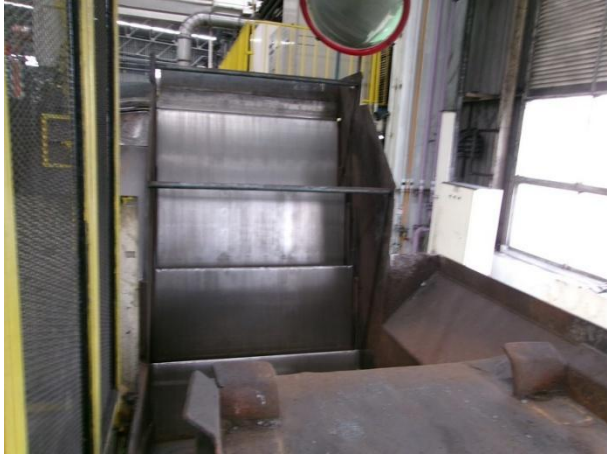
รูปที่ 2-34 ชั้นพักชิ้นงานในการลำเลียงเหล็กที่ร้อนของสายพานลำเลียงที่ไหลเข้าสู่ห้องอบให้ความร้อน