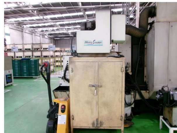
รูปที่ 2-40 ชุดกรองอากาศภายในเครื่อง CNC