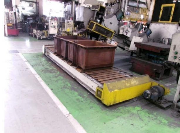
รูปที่ 2-35 ฐานรองเพื่อลดความสูงของรางลำเลียงชิ้นงานที่ออกจากขั้นตอนการผลิตลงสู่กระบะเหล็กรองรับชิ้นงาน