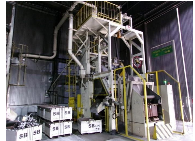
รูปที่ 2-36 ย้ายเครื่องขัดผิวชิ้นงาน (แบบถึง) ออกจากอาคารผลิต 1