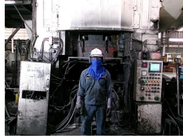
รูปที่ 2-2 พนักงานสวมใส่อุปกรณ์ป้องกันอันตรายส่วนบุคคลที่สามารถป้องกันอันตรายจากเสียงดัง