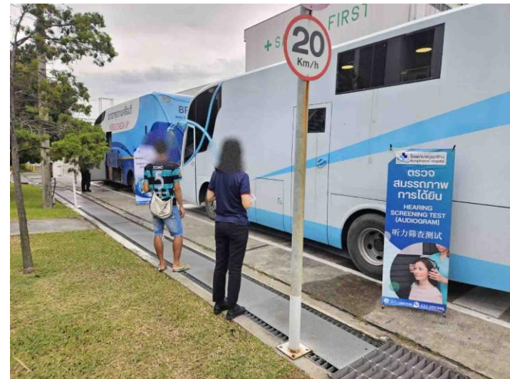
รูปที่ 2-54 ภาพการตรวจสุขภาพ ประจำปี 2567