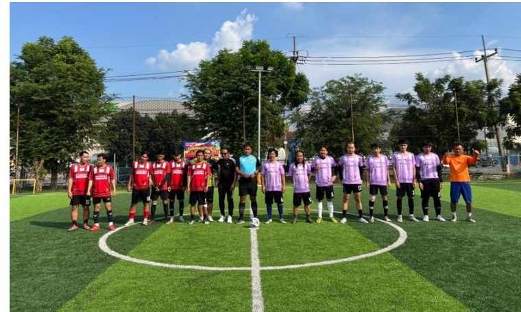
สนามหญ้าเทียมในบริษัท