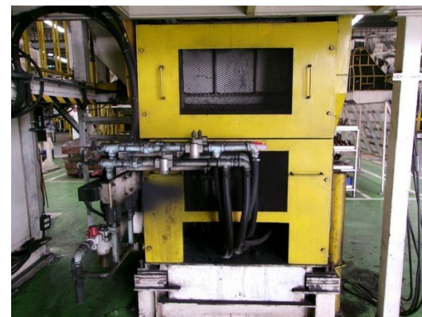
รูปที่ 2-33 Silencer ที่วาล์วควบคุมกระบอกลมเครื่องทุบ