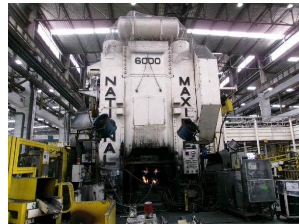
รูปที่ 2-31 ติดตั้งพัดลมระบายอากาศให้กับพนักงานที่ต้องปฏิบัติงานบริเวณเครื่องทุบขึ้นรูป