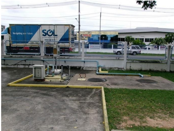
บ่อพักน้ำทิ้ง (ก่อนระบายไปยัง Sump pit 1)