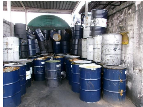
รูปที่ 2-24 ภาชนะปนเปื้อน รวบรวมภายในโรงเก็บขยะ