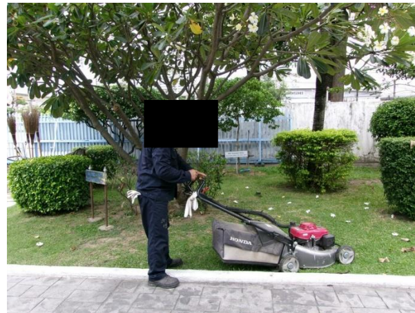
รูปที่ 2-59 การดูแลรักษา ใส่ปุ๋ยบำรุงดิน และต้นไม้