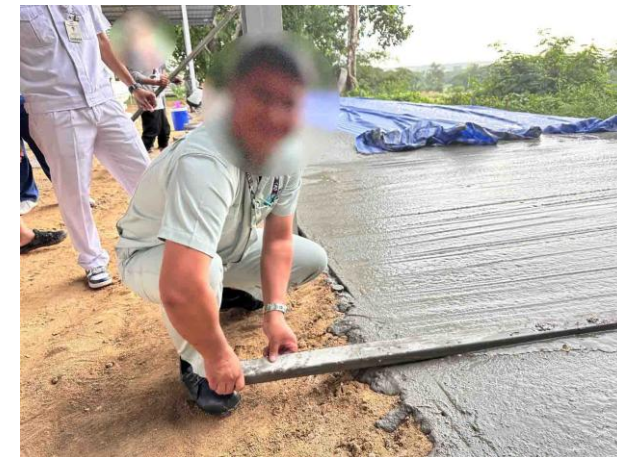
จิตอาสาเพื่อสังคม