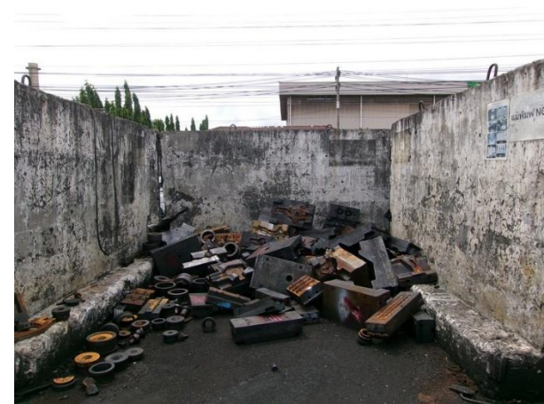
รูปที่ 2-15 เศษเหล็ก ในพื้นที่เก็บเศษเหล็ก