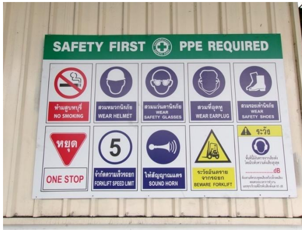
รูปที่ 2-3 ติดป้ายห้าม ป้ายบังคับ และป้ายเตือน การสวมใส่ PPE บริเวณก่อนเข้าอาคารผลิต