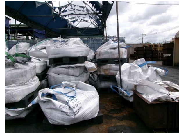
ฝุ่นจากระบบบำบัดมลพิษทางอากาศแบบ Cyclone