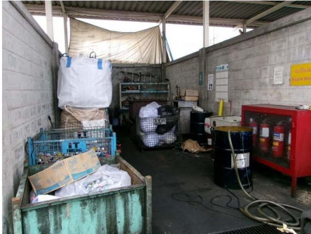
รูปที่ 2-13 โรงเก็บขยะรีไซเคิล