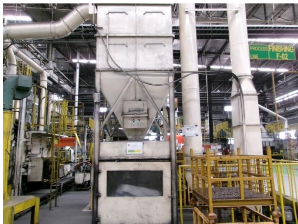
รูปที่ 2-39 Big bag เพื่อรองรับฝุ่นละอองจากการเคาะฝุ่นออกเป็นจังหวะของระบบถุงกรองของเครื่องขัดผิวชิ้นงาน และมีตัวปิดมิดชิด