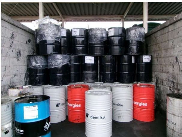
รูปที่ 2-21 น้ำมันเสื่อมสภาพ ในโรงเก็บขยะ