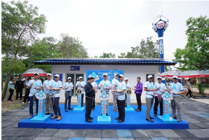
-โครงการน้ำดื่มสะอาดในโรงเรียน