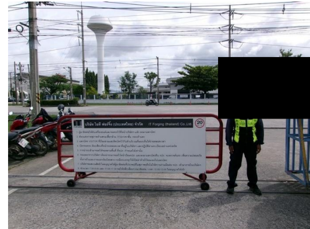
รูปที่ 2-29 เจ้าหน้าที่อำนวยความสะดวกและจัดระเบียบรถเข้า-ออกในพื้นที่โครงการ