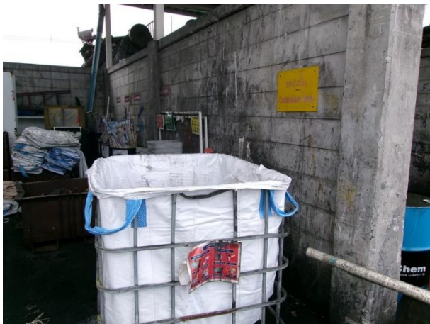
รูปที่ 2-23 เศษผ้า/ถุงมือปนเปื้อนน้ำมัน รวบรวมภายในโรงเก็บขยะ