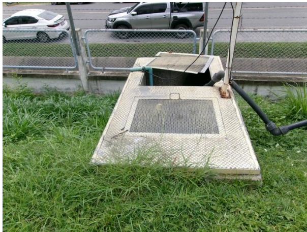
Sump pit 3