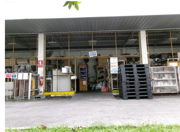
รูปที่ 2-44 สต็อกอุปกรณ์ป้องกันอันตรายส่วนบุคคล