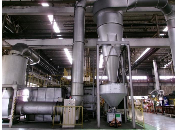
รูปที่ 2-1 ระบบบำบัดมลพิษทางอากาศแบบไซโคลนเพื่อบำบัดมลพิษทางอากาศ ที่เกิดจากเครื่องทุบขึ้นรูปขนาด 6300 ตัน