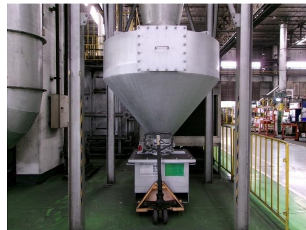
รูปที่ 2-38 Big bag เพื่อรองรับฝุ่นละอองจาก Cyclone และมีตัวปิดมิดชิด เพื่อป้องกันการฟุ้งกระจาย