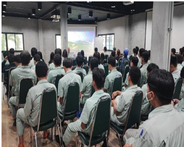
รูปที่ 2-52 การจัดฝึกอบรมให้ความรู้พนักงานเกี่ยวกับอันตรายจากเสียงดังและการสวมใส่อุปกรณ์ป้องกันอันตรายต่อการได้ยินที่มีประสิทธิภาพ