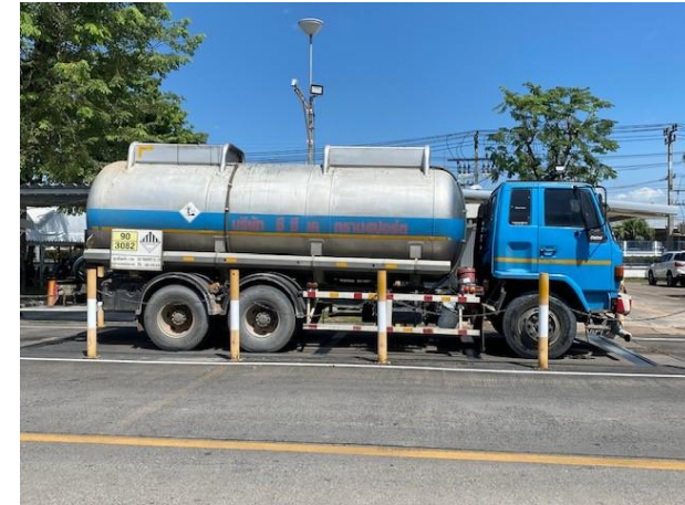
รูปที่ 2-12 รถขนส่งกากของเสียอุตสาหกรรม