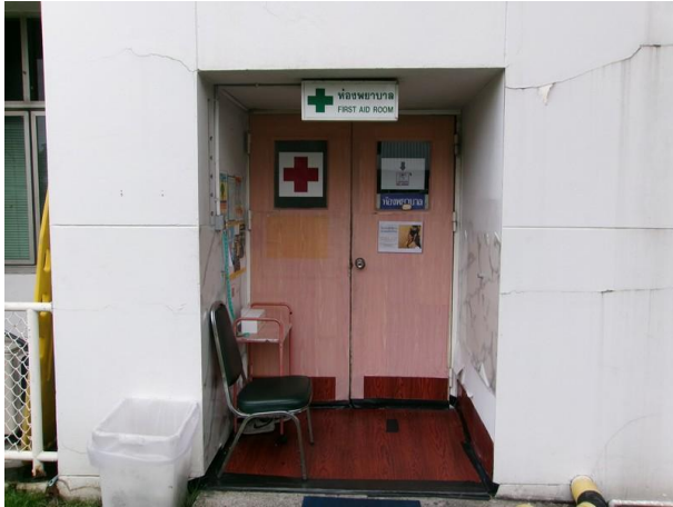
ห้องพยาบาล