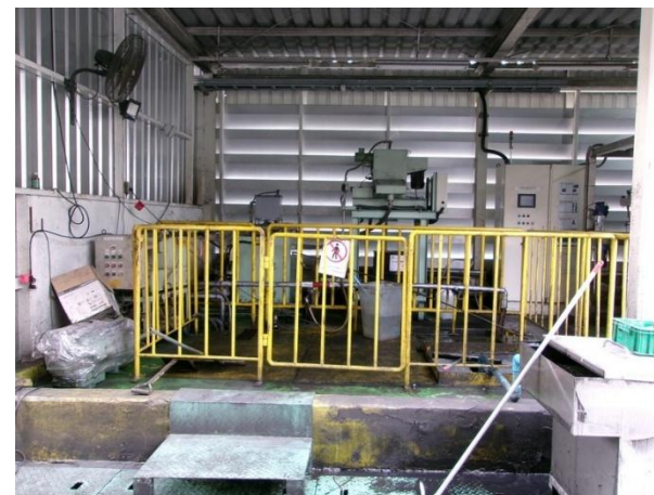
รูปที่ 2-20 บ่อคอนกรีตเก็บน้ำมันปนเปื้อนน้ำหล่อเย็น