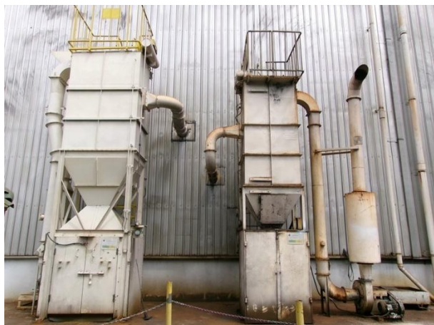
รูปที่ 2-37 ระบบบำบัดมลพิษทางอากาศแบบถุงกรอง ของเครื่องขัดผิวชิ้นงาน