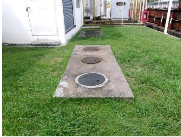
รับน้ำเสียจากห้องน้ำ-ห้องส้วมส่วนทุบขึ้นรูป 1