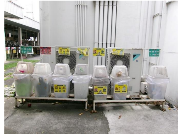
รูปที่ 2-9 ถังรองรับขยะมูลฝอย 3 ประเภท ได้แก่ ขยะทั่วไป ขยะอันตราย และขยะรีไซเคิล โดยถังขยะรีไซเคิลแยกออกเป็น 6 ประเภท