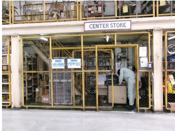
รูปที่ 2-8 อะไหล่หรืออุปกรณ์/เครื่องมือที่ใช้ในระบบบำบัดน้ำเสียสำรอง