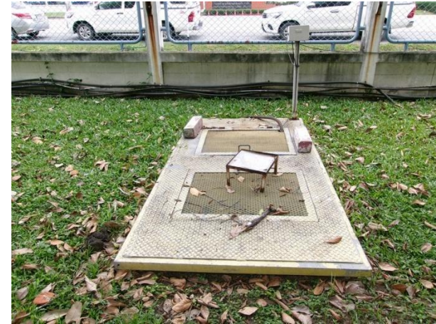
Sump pit 2