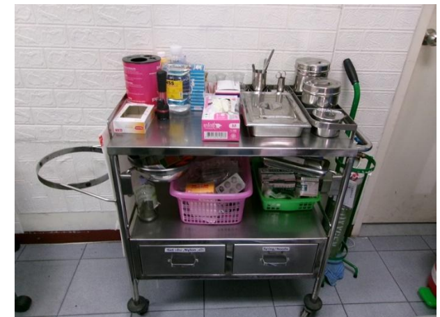
รถเข็นเครื่องมือแพทย์