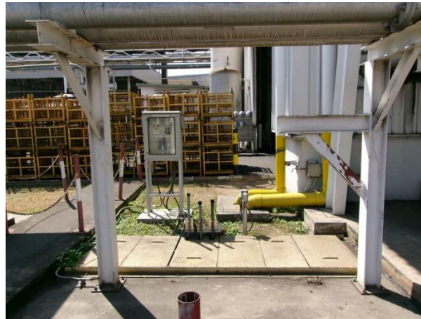
Cooling water return pit 5