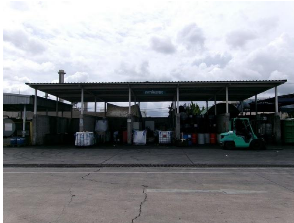
รูปที่ 2-10 โรงพักขยะเพื่อจัดเก็บของเสีย