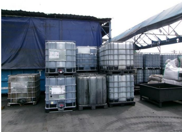
รูปที่ 2-19 ถังเก็บสำรองความจุ 1,000 ลิตร จำนวน 24 ถัง