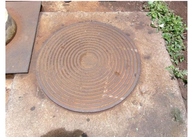
รับน้ำเสียจากห้องน้ำ-ห้องส้วมส่วนตรวจสอบผลิตภัณฑ์