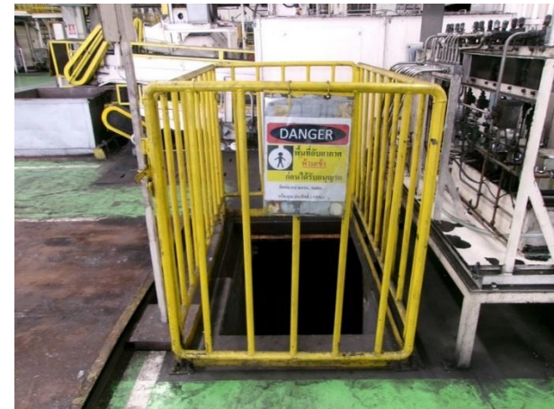
รูปที่ 2-18 บ่อคอนกรีตเก็บน้ำปนเปื้อนน้ำมันใต้เครื่องทุบขึ้นรูป