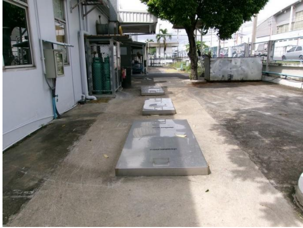
รับน้ำเสียจากโรงอาหารและห้องอาบน้ำ