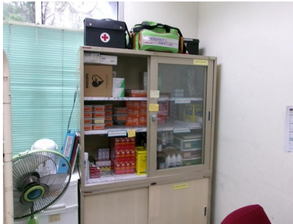
ตู้จัดเก็บเวชภัณฑ์