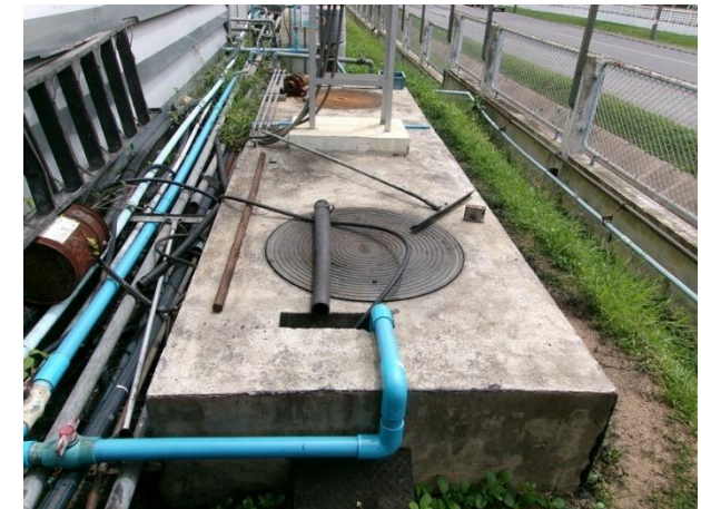
บ่อพักน้ำทิ้ง (ก่อนระบายไปยัง Sump pit 4)