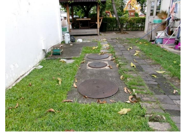
รับน้ำเสียจากห้องน้ำ-ห้องส้วมสำนักงาน