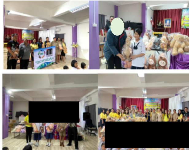
กิจกรรมมอบตอบโต้สถานการณ้ฉุกเฉินโรงเรียนบ้านคลองกรำ