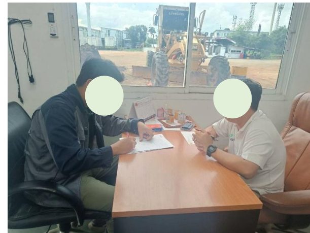
รูปที่ 2-56 การสำรวจสภาพสังคม - เศรษฐกิจ และความคิดเห็นของประชาชน