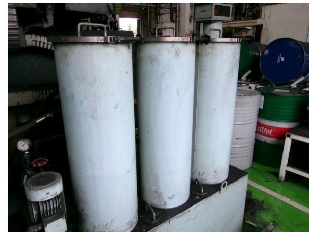
รูปที่ 2-42 ระบบกรองน้ำมัน (Oil filter) ในขณะสูบน้ำมันกันสนิม