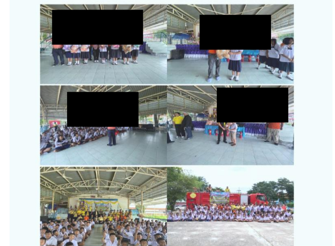
โครงการมอบตอบโต้สถานการณ้ฉุกเฉินโรงเรียนบ้านหนองบอน