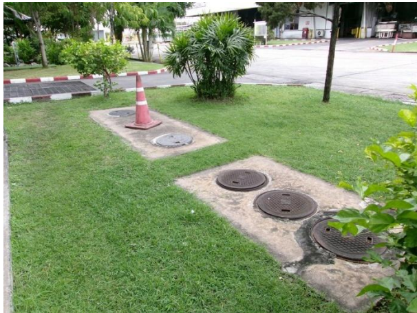
รับน้ำเสียจากห้องน้ำ-ห้องส้วมโรงแม่พิมพ์