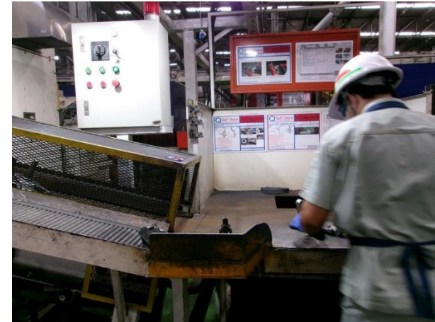
รูปที่ 2-46 การติดตั้ง Photo sensor เพื่อป้องกันเครื่องจักรหนีบ/กระแทก เกิดอันตรายกับพนักงานทำงานกับเครื่องตรวจสอบรอยร้าว