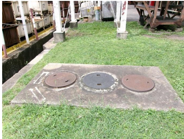
รับน้ำเสียจากห้องน้ำ-ห้องส้วมส่วนอบชุบชิ้นงาน