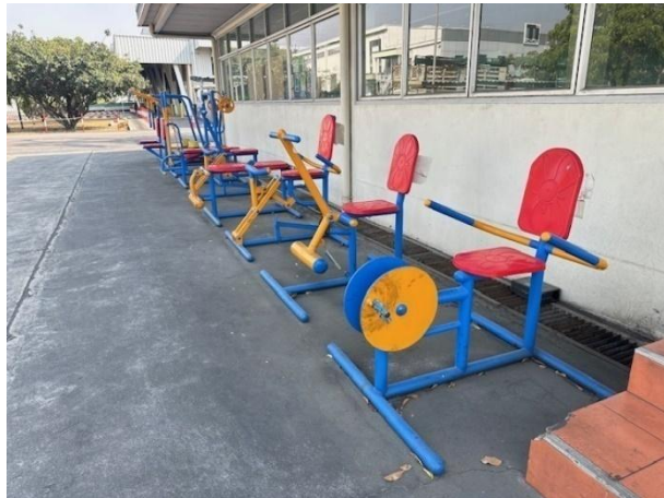
เครื่องออกกำลังกายในบริษัท