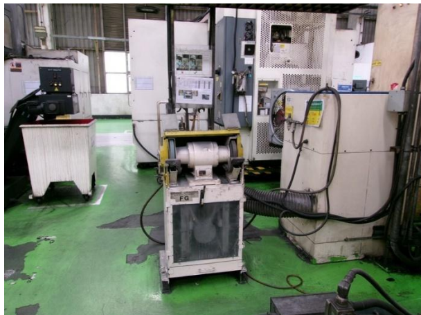
รูปที่ 2-41 พัดลมดูดอากาศเฉพาะที่ในจุดเชื่อม/ตัด