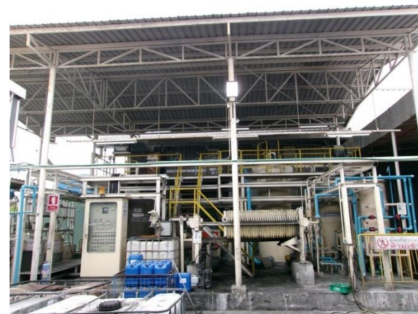
รูปที่ 2-5 ระบบบำบัดน้ำเสียทางเคมี