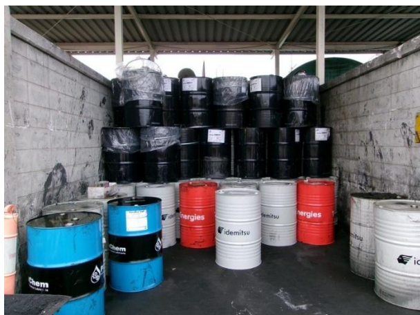
รูปที่ 2-43 ภาชนะรองรับการถ่ายน้ำมัน ที่มีฝาปิดมิดชิด และเคลื่อนย้ายไปเก็บที่โรงเก็บของเสียอันตรายพร้อมติดป้ายชี้บ่ง