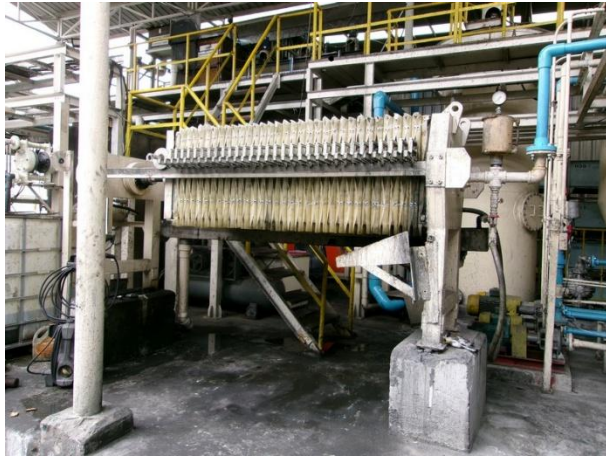
รูปที่ 2-50 พาเลทรองรับการรีดตะกอนจากระบบบำบัดน้ำเสียทางเคมี