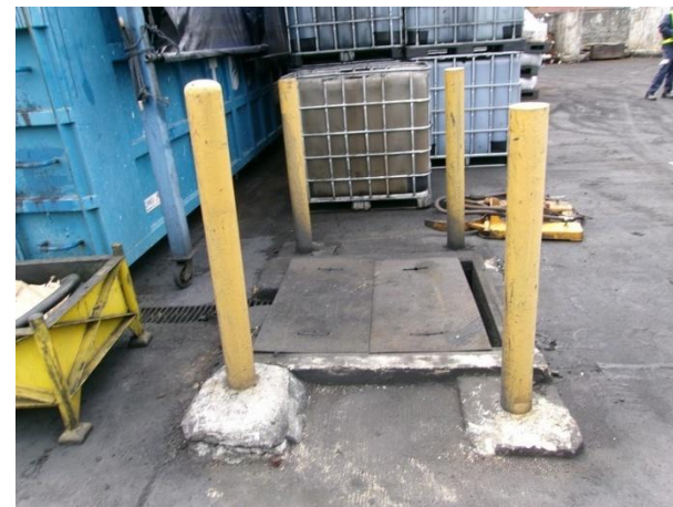
รูปที่ 2-26 บ่อดักน้ำมันขนาด 1.5 ลูกบาศก์เมตร