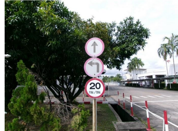
รูปที่ 2-28 ป้ายควบคุมความเร็ว