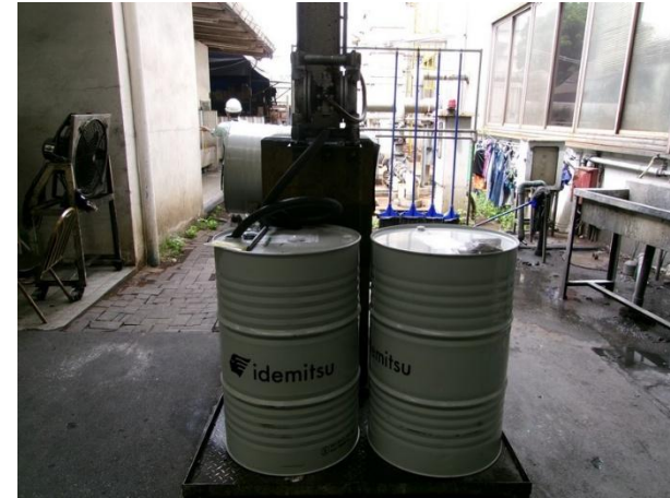
รูปที่ 2-51 การเปลี่ยนถ่ายน้ำมัน มีภาชนะรองรับที่มีฝาปิดมิดชิด