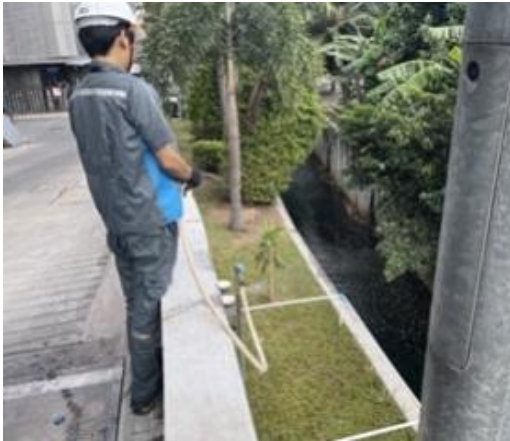
รูปที่ 2-17 การดูแลรักษาพืชคลุมดินบริเวณระบบกำจัดมีเทน