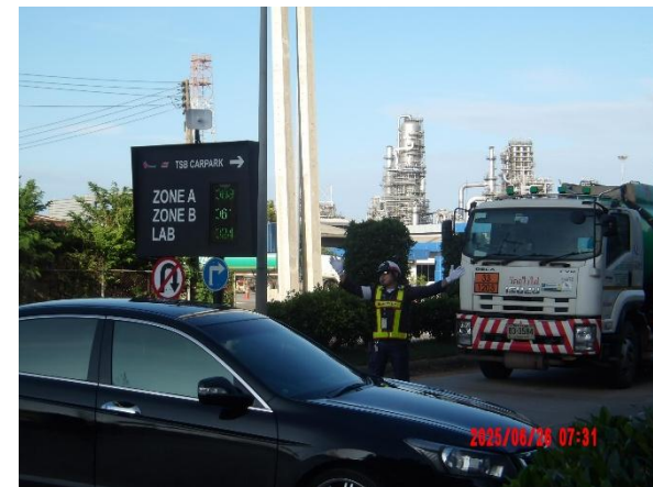
รูปที่ 2-37 จัดให้มีเจ้าหน้าที่อำนวยความสะดวกการจราจร ประจำจุดเสี่ยงอันตราย