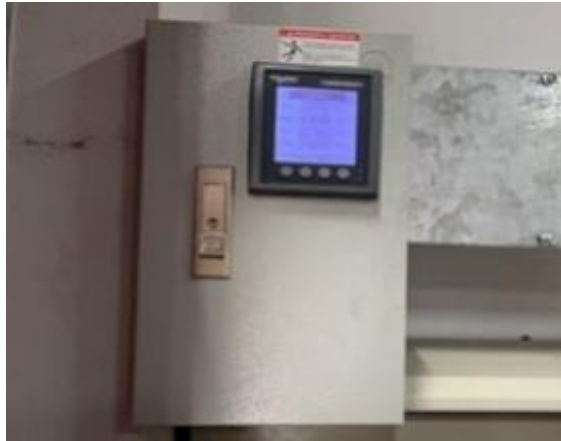
รูปที่ 2-13 ติดตั้งมาตรวัดไฟฟ้าในส่วนของระบบบำบัดน้ำเสีย แยกออกจากส่วนอื่นๆ