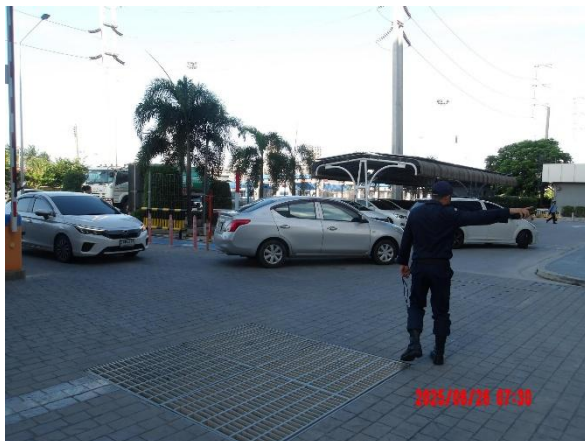
รูปที่ 2-8 เจ้าหน้าที่อำนวยความสะดวกบริเวณทางเข้า-ออกโครงการ โดยเฉพาะในช่วงโมงเร่งด่วนเข้าเย็น