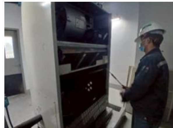
รูปที่ 2-50 ทำความสะอาดแผงกรองอากาศเครื่องส่งลมเย็น