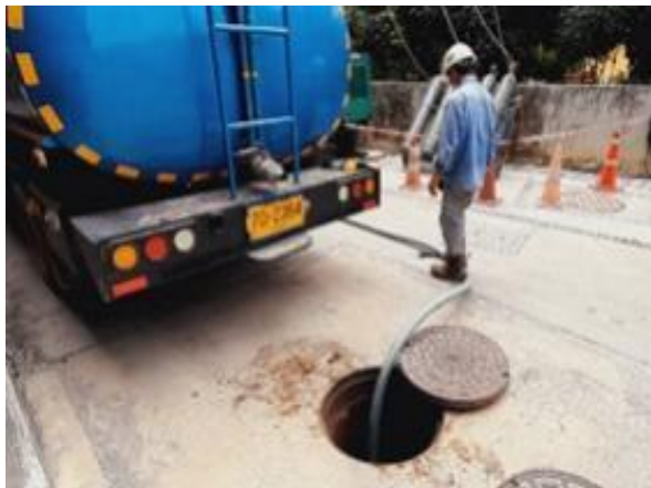
รูปที่ 2-15 ประสานงานกับรถสูบล้างปฏิทินของเอกชน เพื่อสูบน้ำมันของระบบบำบัดน้ำเสียไปกำจัดต่อไป