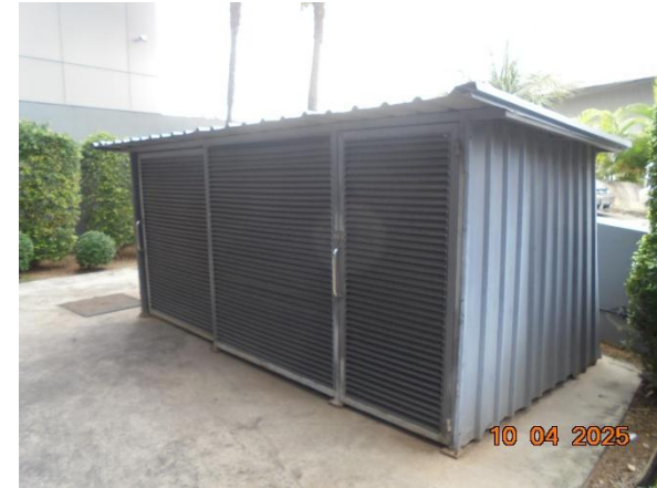
รูปที่ 2-26 ห้องพัสดุฝอย