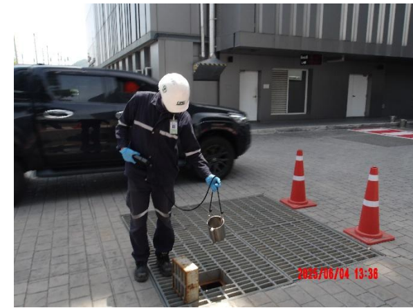
รูปที่ 2-12 เจ้าหน้าที่ดูแลการเดินระบบบำบัดน้ำเสีย