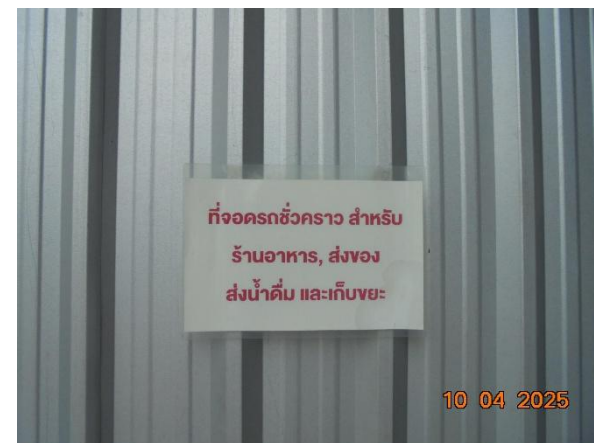
รูปที่ 2-24 ติดตั้งป้ายที่จ่อครกเก็บขนมูลฝอย