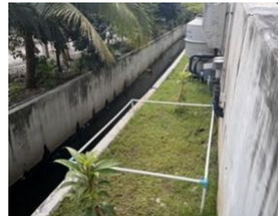
รูปที่ 2-16 จัดให้มีการกันดินในบริเวณพื้นที่ป้อมมีเทนให้มีขอบเขตที่ชัดเจน