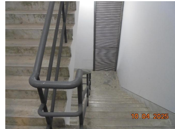
รูปที่ 2-44 (ต่อ) จัดให้มีระบบป้องกันอัคคีภัย