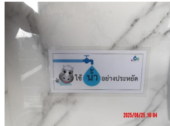
รูปที่ 2-9 ติดป้ายรณรงค์และประชาสัมพันธ์การการใช้น้ำ อย่างประหยัด