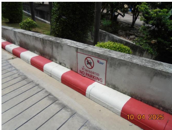
รูปที่ 2-40 ติดตั้งป้ายเตือนห้ามจอดบริเวณทางเข้า-ออกโครงการ