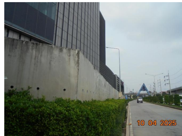
รูปที่ 2-2 จัดทำรั้วทึบบริเวณแนวเขตที่ดิน และรั้วโปร่งบริเวณแนวเขตที่ดินด้านทิศเหนือของโครงการ เพื่อป้องกันการพังทลายของดินและสร้างความเป็นส่วนตัวแก่พื้นที่ข้างเคียง