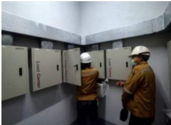
รูปที่ 2-53 ตรวจสอบสภาพอุปกรณ์ไฟฟ้า