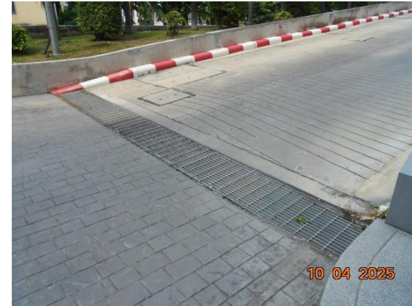
รูปที่ 2-18 ติดตั้งตะแกรงดักมูลฝอยบริเวณจุดระบายน้ำเข้าสู่ท่อระบายน้ำ