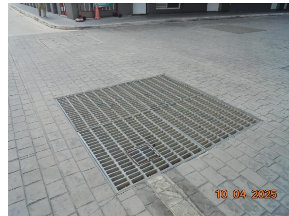
รูปที่ 2-20 บ่อพักน้ำสุดท้ายของโครงการ