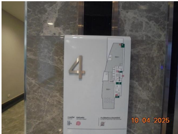
รูปที่ 2-47 ประชาสัมพันธ์การใช้อุปกรณ์ป้องกันอัคคีภัย แผนการป้องกันอัคคีภัยและแผนการอพยพรวมแก่ผู้เข้าพื้นที่และพนักงาน