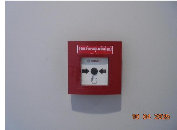
รูปที่ 2-44 จัดให้มีระบบป้องกันอัคคีภัย