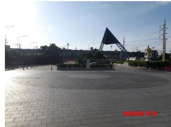
รูปที่ 2-48 จัดให้มีทางเดินรถดับเพลิงขนาดใหญ่