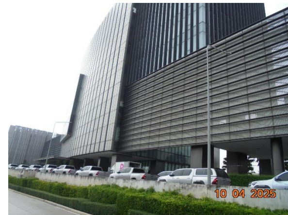
รูปที่ 2-33 เลือกใช้สายไฟฟ้าและสายสื่อสารโทรคมนาคมแบบระบบสายใต้ดิน