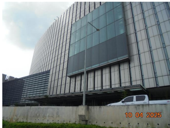
รูปที่ 2-27 ติดตั้งไฟส่องสว่างบริเวณแนวรั้ว