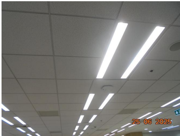
รูปที่ 2-29 เลือกใช้หลอดไฟฟ้าแบบ LED ติดตั้งภายในโครงการ