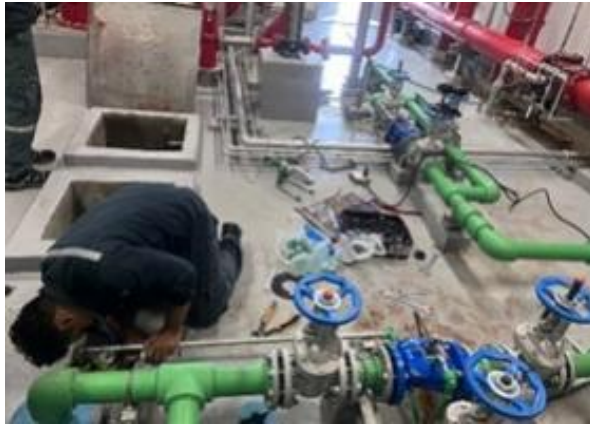
รูปที่ 2-10 เจ้าหน้าที่ดูแลรักษาระบบเส้นท่อประปา การรั่วไหลของน้ำ