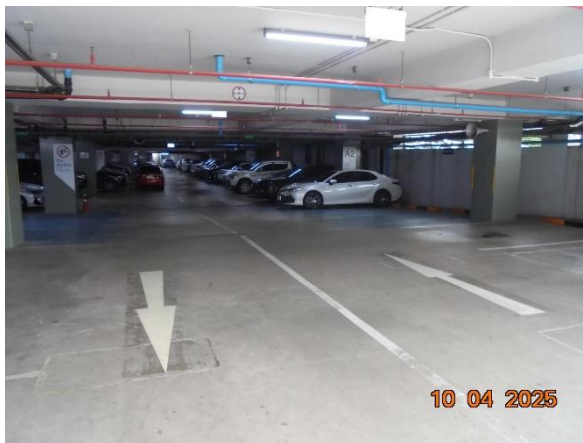
รูปที่ 2-36 เครื่องหมายบนพื้นทางแสดงทิศทางการจราจร