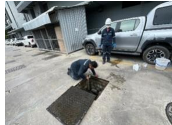
รูปที่ 2-54 ตรวจสอบปริมาณตะกอนที่สะสมบริเวณท่อระบายน้ำในพื้นที่โครงการ