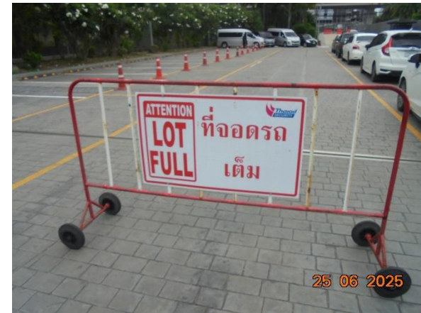
รูปที่ 2-35 ป้ายแนะนำ บริเวณทางเดินรถ