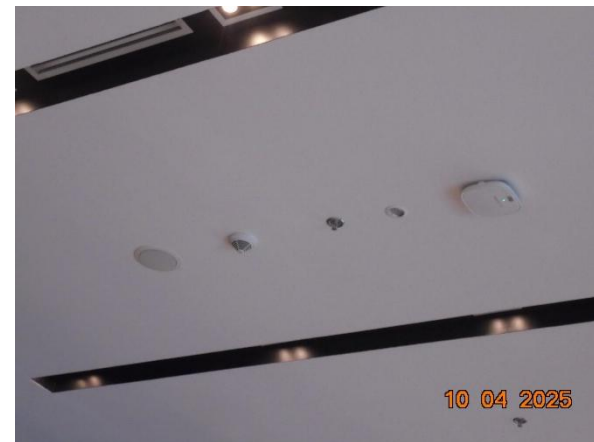
รูปที่ 2-44 (ต่อ) จัดให้มีระบบป้องกันอัคคีภัย