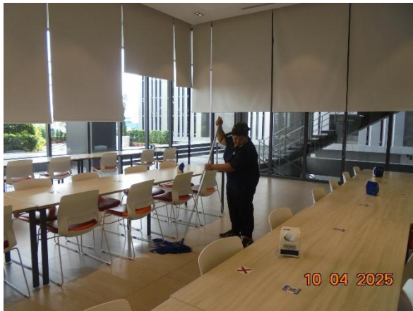
รูปที่ 2-21 จัดให้มีพนักงานทำความสะอาดเก็บรวบรวมมูลฝอยที่เกิดขึ้นแต่ละชั้น ไปยังห้องพักมูลฝอยรวม