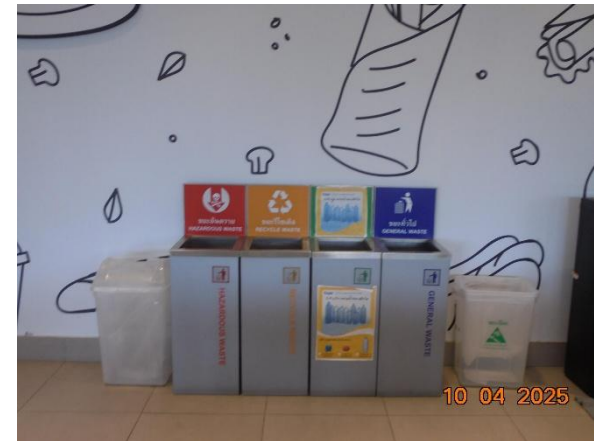
รูปที่ 2-22 ถังรองรับขยะมูลฝอยประจำชั้น