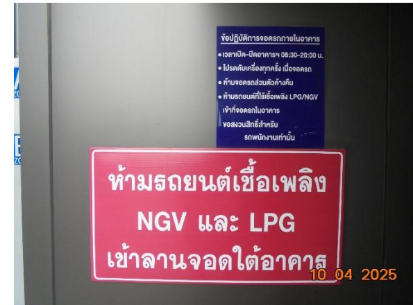
รูปที่ 2-7 ติดตั้งป้ายข้อปฏิบัติการจอดรถภายในพื้นที่โครงการ