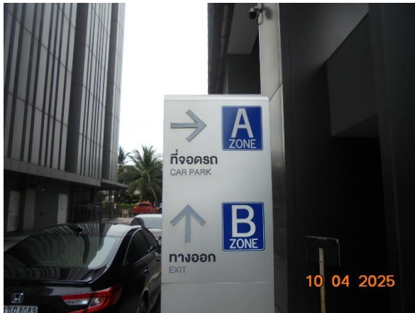
รูปที่ 2-38 ติดตั้งป้ายและเครื่องหมายแสดงทางเข้า-ออกอย่างชัดเจน