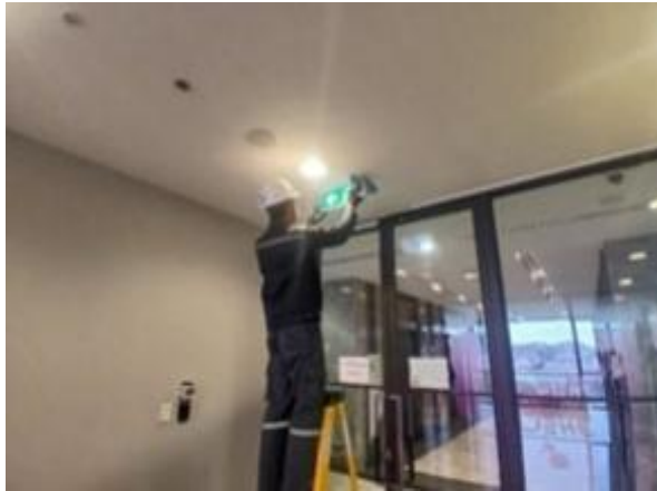
รูปที่ 2-43 จัดให้มีเจ้าหน้าที่ตรวจตราดูแลอุปกรณ์เครื่องหมายและสัญญาณต่าง ๆ