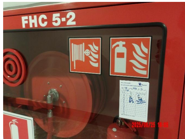
รูปที่ 2-45 ตรวจสอบประสิทธิภาพของอุปกรณ์สำหรับระบบดับเพลิง เป็นประจำทุกเดือน