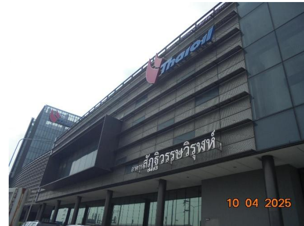
รูปที่ 2-39 อาคารสำนักงาน และการติดตั้งป้ายชื่อโครงการ