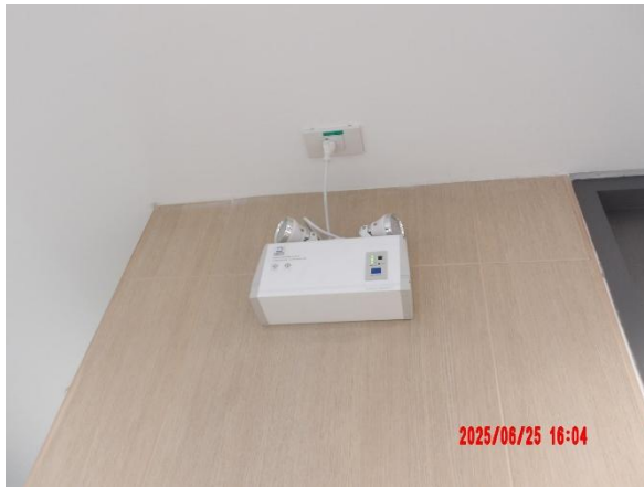
รูปที่ 2-34 ติดตั้งเครื่องสำรองไฟฟ้าใช้กรณีฉุกเฉิน