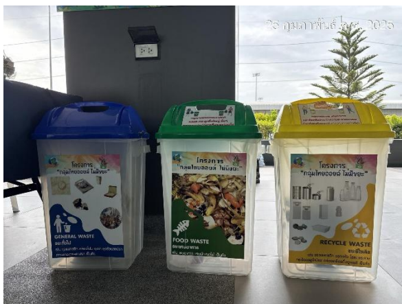
รูปที่ 2-23 ติดป้ายรณรงค์และประชาสัมพันธ์การคัดแยกมูลฝอยก่อนทิ้งลงถัง