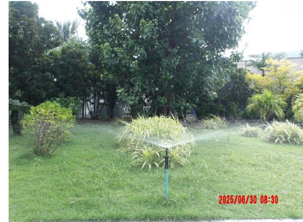
รูปที่ 2-14 การหมุนเวียนน้ำทิ้งที่ผ่านการบำบัดแล้ว โดยนำกลับมารดน้ำต้นไม้ ภายในโครงการ