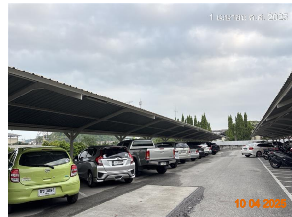
รูปที่ 2-41 จัดเตรียมพื้นที่จอดรถสำรอง