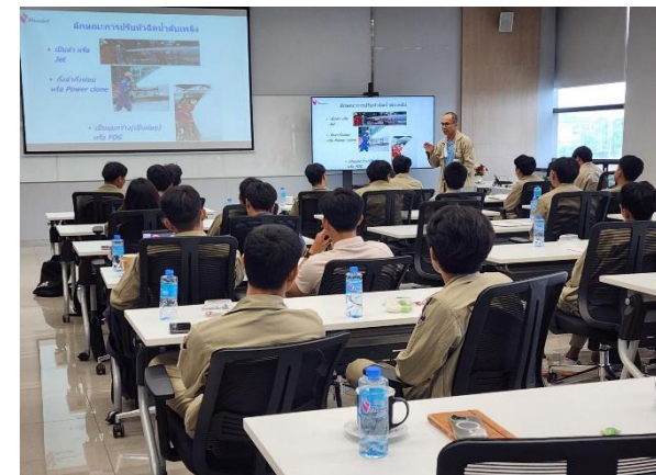
รูปที่ 2-46 ฝึกอบรมเจ้าหน้าที่ที่เกี่ยวข้องกับการป้องกันอัคคีภัยของโครงการ