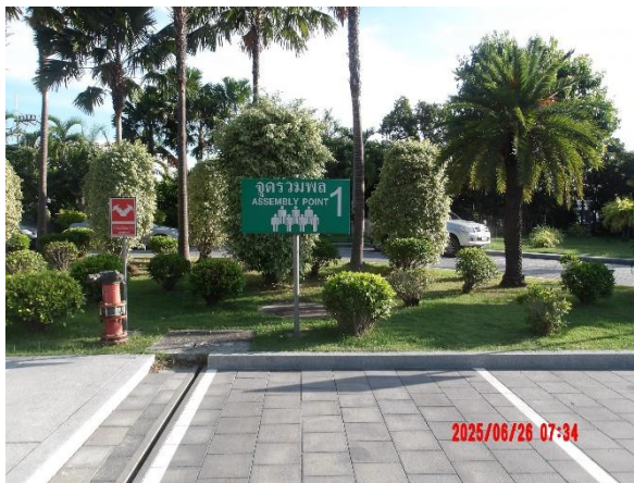
รูปที่ 2-19 จุดรวมพล