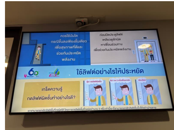
รูปที่ 2-30 การประชาสัมพันธ์และให้คำแนะนำวิธีการประหยัดไฟฟ้า แก่พนักงานภายในโครงการ