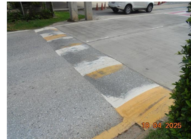
รูปที่ 2-5 สันหนุชะลอความเร็วรถภายในโครงการ