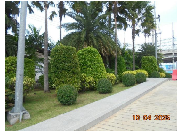
รูปที่ 2-1 ปลุกหญ้าหรือพืชคลุมดินบริเวณพื้นที่ลาดชันภายในพื้นที่โครงการ เพื่อป้องกันการพังทลายของดิน