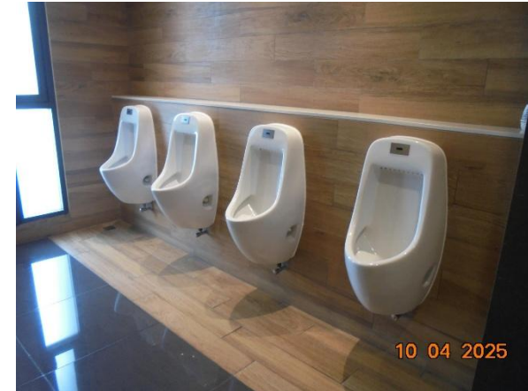
รูปที่ 2-11 เลือกใช้อุปกรณ์ประหยัดน้ำ เช่น โกลุขกัณฑ์ ก๊อกน้ำ เป็นต้น