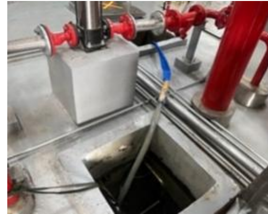
รูปที่ 2-52 ล้างทำความสะอาดถังสำรองน้ำใช้ทุกแห่ง