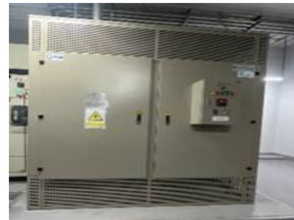
รูปที่ 2-28 ติดตั้งหม้อแปลงไฟฟ้าโดยมีระยะห่างจากแนวเขตที่ดิน ไม่น้อยกว่า 1 เมตร