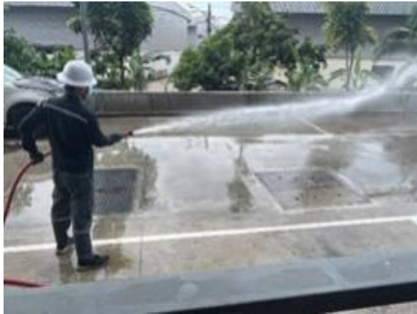
รูปที่ 2-6 ดูแลรักษาความสะอาดบริเวณถนนส่วนกลาง โดยฉีดล้างถนนเป็นครั้งคราว