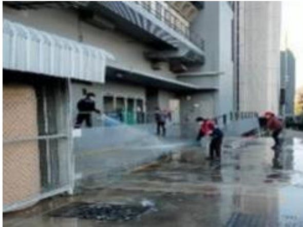
รูปที่ 2-25 ทำความสะอาดห้องพัสดุฝอยรวมทุกครั้ง หลังเก็บขนมูลฝอย