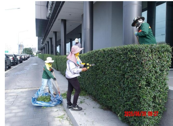
รูปที่ 2-3 ดูแลและบำรุงรักษาพื้นที่สีเขียวภายในพื้นที่โครงการ ให้อยู่ในสภาพที่สมบูรณ์ตลอดช่วงเปิดดำเนินการ