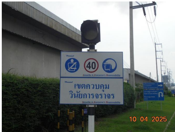
รูปที่ 2-4 ป้ายควบคุมความเร็ว