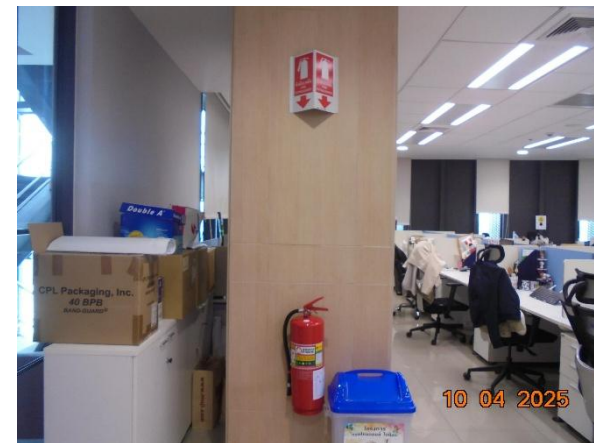
รูปที่ 2-44 (ต่อ) จัดให้มีระบบป้องกันอัคคีภัย