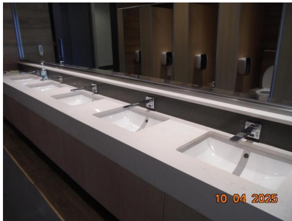
รูปที่ 2-11 (ต่อ) เลือกใช้อุปกรณ์ประหยัดน้ำ เช่น โกลุขกัณฑ์ ก๊อกน้ำ เป็นต้น