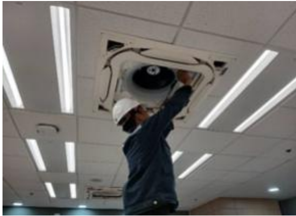
รูปที่ 2-51 ตรวจสอบการรั่วของท่อลม