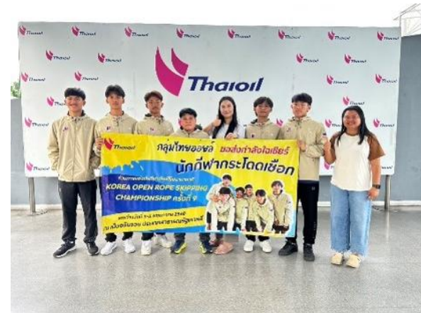
รูปที่ 2-42 จัดทำโครงการชุมชนสัมพันธ์ต่าง ๆ