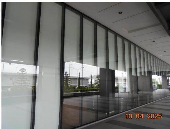
รูปที่ 2-32 การติดตั้งมู่ลี่กันสาดป้องกันแสงแดด