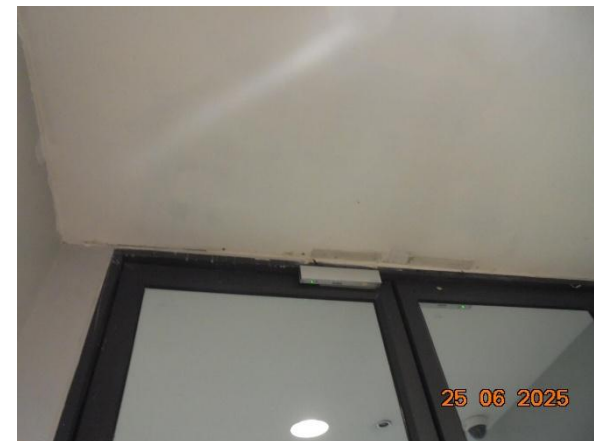
รูปที่ 2-31 การเลือกใช้เครื่องใช้ไฟฟ้าและอุปกรณ์ต่าง ๆ เพื่อประหยัดพลังงาน