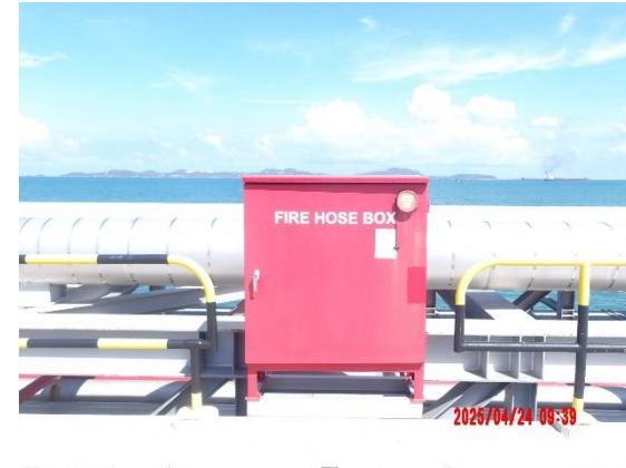
รูปที่ 2-14 การติดตั้งเครื่องฉีดน้ำและโฟมดับเพลิง บริเวณท่าเทียบเรือ