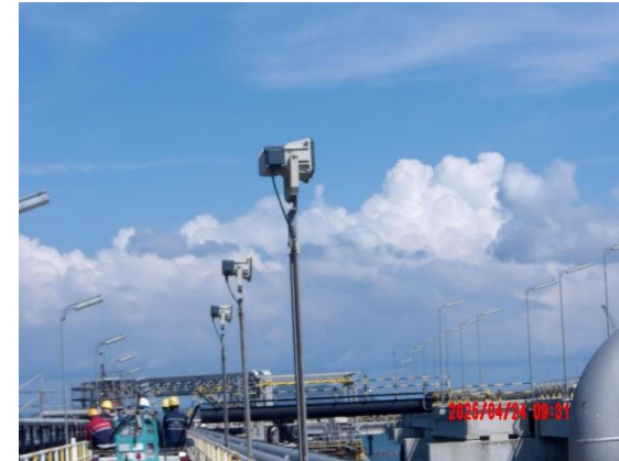
รูปที่ 2-6 ติดตั้งระบบไฟฟ้าแสงสว่างและไฟจราจรบนสะพานท่าเรือ