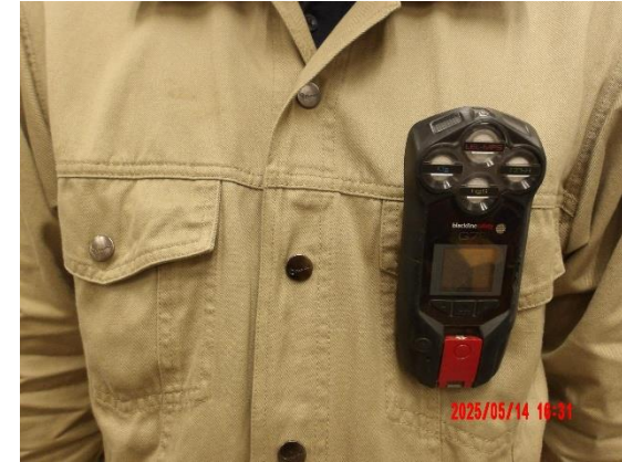
รูปที่ 2-11 การติดเครื่องเฝ้าระวังสารประกอบไฮโดรคาร์บอนส่วนบุคคล เวลาเข้าปฏิบัติงานหน้าท่าเทียบเรือ