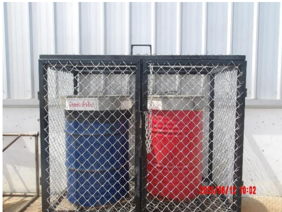
รูปที่ 2-7 ถังขยะแยกประเภทภายในพื้นที่โครงการ