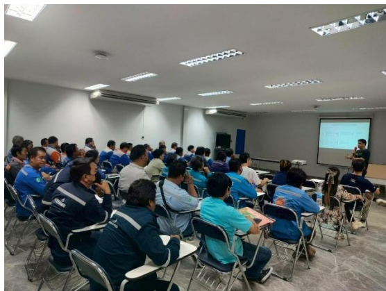
รูปที่ 2-3 การจัดอบรมเกี่ยวกับความปลอดภัยในการทำงาน บริเวณที่มีเสียงดังให้แก่พนักงาน