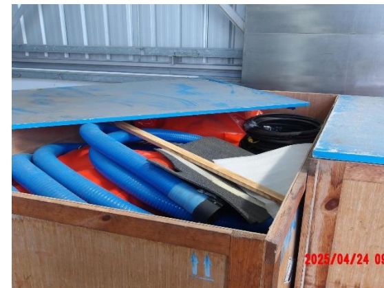
รูปที่ 2-4 อุปกรณ์ที่ใช้ในการป้องกัน และขจัดน้ำมันรั่วไหล