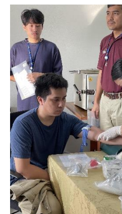
รูปที่ 2-20 การตรวจสอบสุขภาพพนักงาน