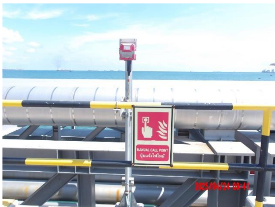
รูปที่ 2-17 ติดตั้งระบบป้องกันภัยและสัญญาณเตือนภัยตามจุดหรือพื้นที่ที่คาดว่าจะมีความเสี่ยง