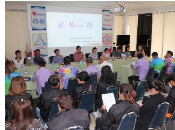
รูปที่ 2-8 การประชาสัมพันธ์ข้อมูลข่าวสารของโครงการ