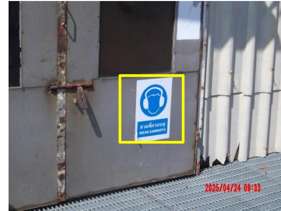
รูปที่ 2-2 ป้ายแสดงสำหรับพื้นที่ที่เป็นอันตรายต่อการได้ยิน