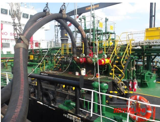
รูปที่ 2-19 ถาดรองรับน้ำมันที่อาจรั่วจากการต่อเชื่อมท่อสูบน้ำ