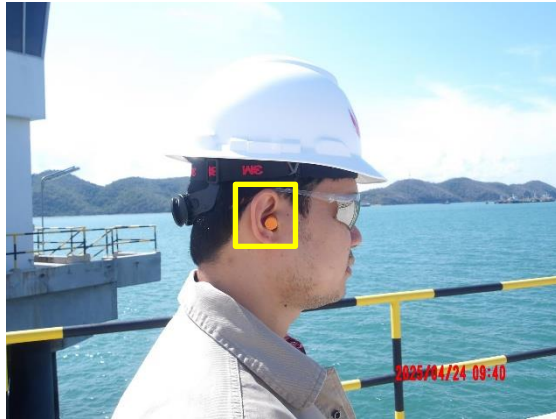
รูปที่ 2-1 จัดเตรียมปลั๊กอุดหู (Ear Plugs) สำหรับพนักงาน