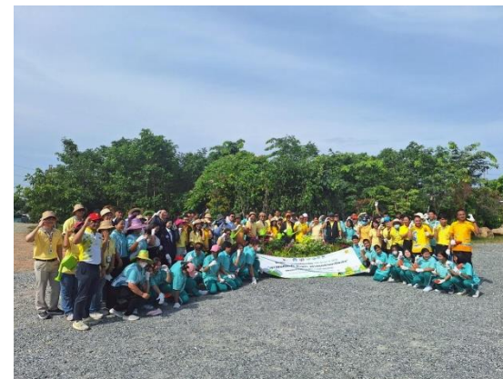
รูปที่ 2-9 กิจกรรมส่งเสริม/สนับสนุนกิจกรรมสาธารณประโยชน์ของชุมชน