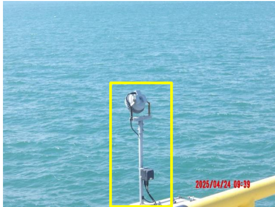
รูปที่ 2-5 ติดตั้งสัญญาณในการเดินเรือให้ชัดเจน และเหมาะสมตามมาตรการการเดินเรือสากล