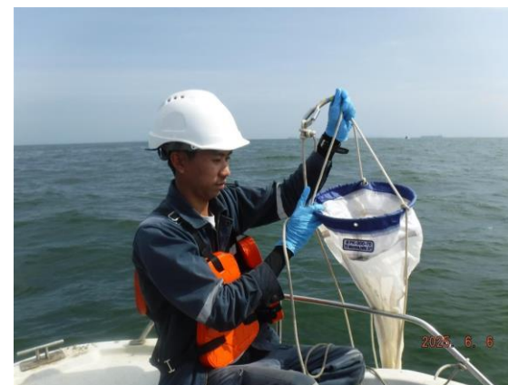
รูปที่ 2-23 การตรวจสอบภาพนิเวศในแนวปะการัง ระบบนิเวศชายฝั่งและทรัพยากรสัตว์น้ำ