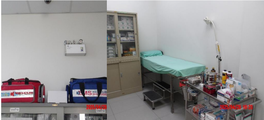
รูปที่ 2-10 อุปกรณ์ปฐมพยาบาลเบื้องต้นในพื้นที่โครงการ