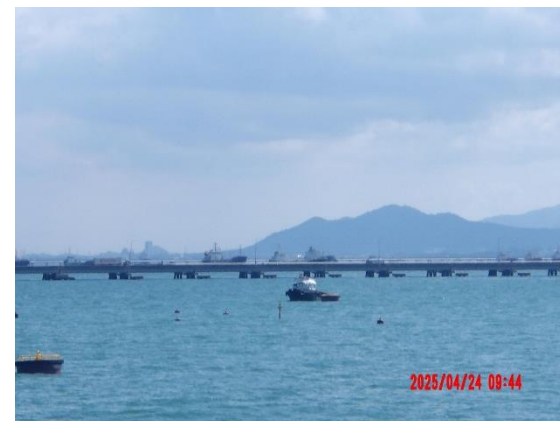
รูปที่ 2-18 เรือประจำท่า