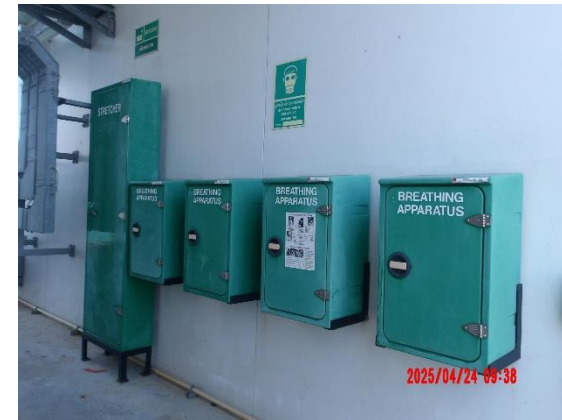
รูปที่ 2-13 อุปกรณ์ป้องกันอันตรายส่วนบุคคลแก่พนักงาน เมื่อต้องมีการสัมผัสกับผลิตภัณฑ์น้ำมันสำเร็จรูปและปิโตรเคมี