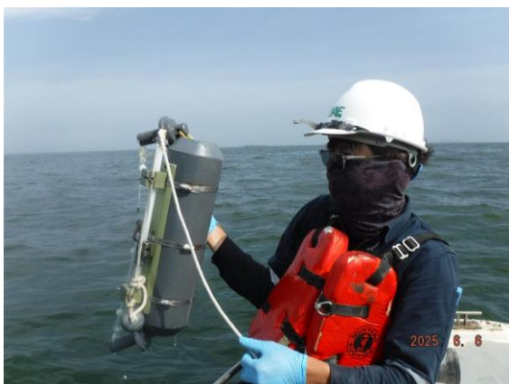
รูปที่ 2-22 การตรวจวัดค่า Total Petroleum Hydrocarbon (TPH)