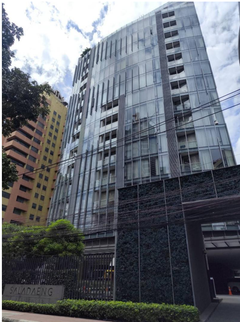
รูปที่ 1-2 สภาพปัจจุบันของโครงการ

ปัจจุบันอยู่ในช่วงเปิดดำเนินการ และได้รับใบรับรองการก่อสร้างอาคาร (อ.6) เรียบร้อยแล้ว ดังแสดงในภาคผนวก