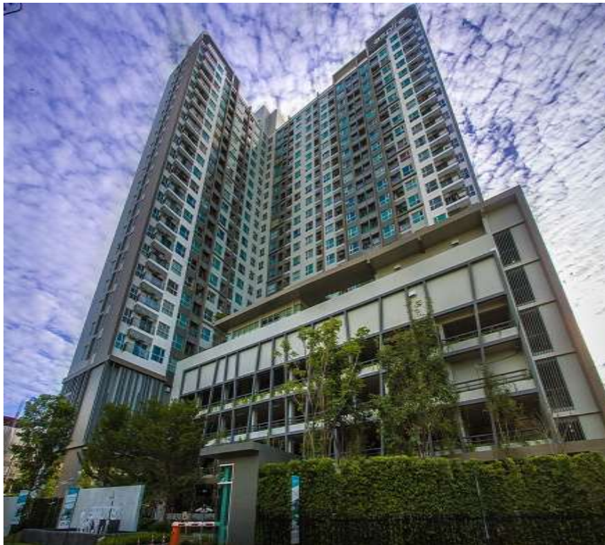
รูปแสดงอาคารชุดแอสปายสาทร-ตากสิน(ทิมเบอร์โซน)

ปัจจุบันโครงการแอสปายสาทร-ตากสิน(ทิมเบอร์โซน) อยู่ในช่วงเปิดดำเนินการ และ ได้รับใบรับรองการก่อสร้างอาคาร (อ.๖) ดังแสดงเอกสารในภาคผนวก