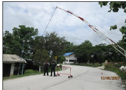
รูปที่ 40 เจ้าหน้าที่ดูแลการจราจรบริเวณทางเข้า - ออกโครงการ