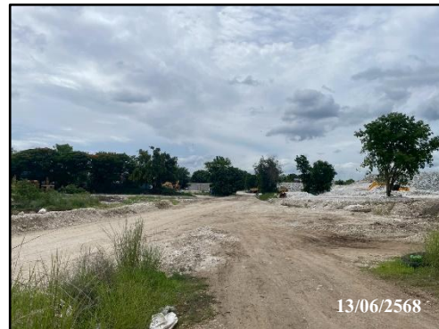
รูปที่ 2 พื้นที่ไม่ทำเหมืองตามแนวเขตประทานบัตรทิศตะวันออก ระยะ 50 เมตร