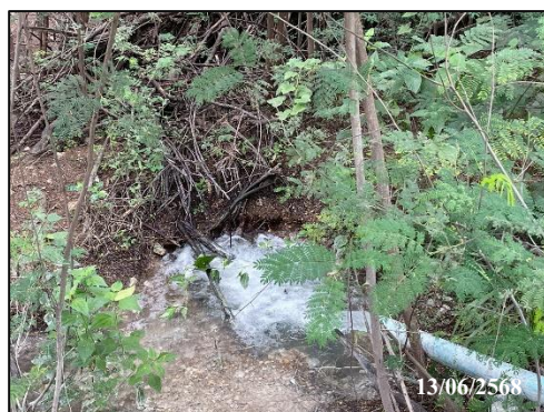
รูปที่ 9 ร่องระบายน้ำ