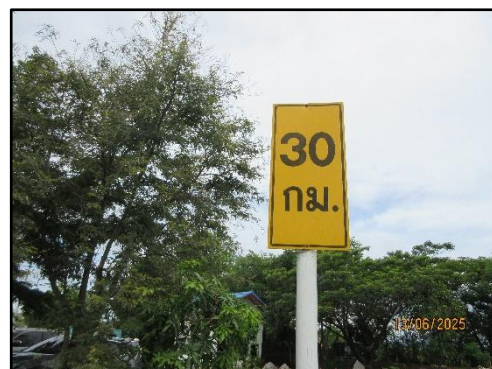
รูปที่ 19 ป้ายแจ้งเตือนความเร็วของรถขนส่งแร่ ระบุความเร็วไม่เกิน 30 กิโลเมตรต่อชั่วโมง