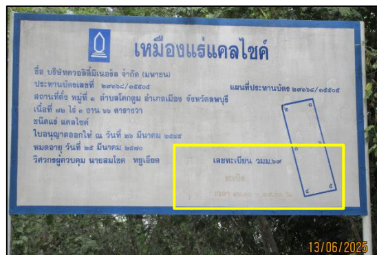
รูปที่ 15 ป้ายเตือนการใช้วัตถุระเบิด พร้อมทั้งระบุเวลาทำการในการระเบิดบริเวณเส้นทาง