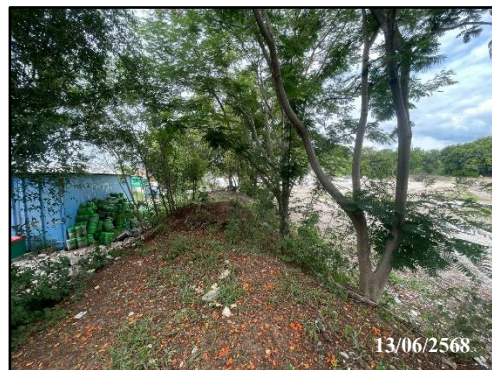
รูปที่ 11 ไม้ยืนต้นหรือพันธุ์ไม้ท้องถิ่นรอบพื้นที่โครงการ