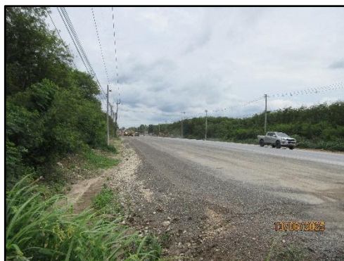
รูปที่ 38 ถนนใช้ร่วมกับชุมชน