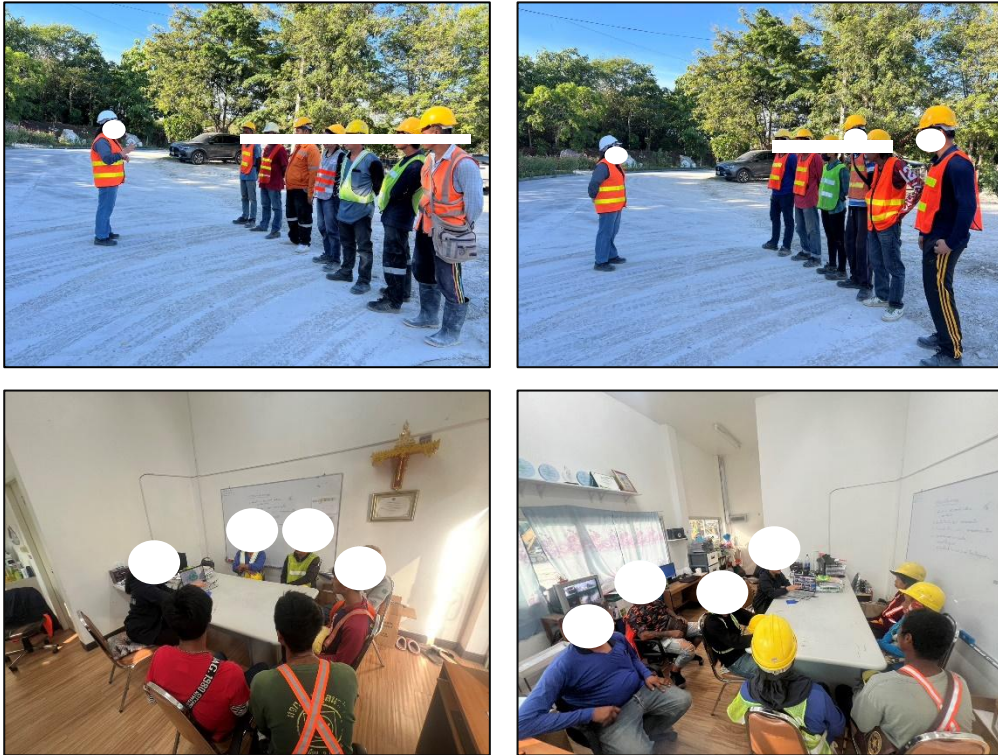
รูปที่ 20 การอบรมพนักงาน