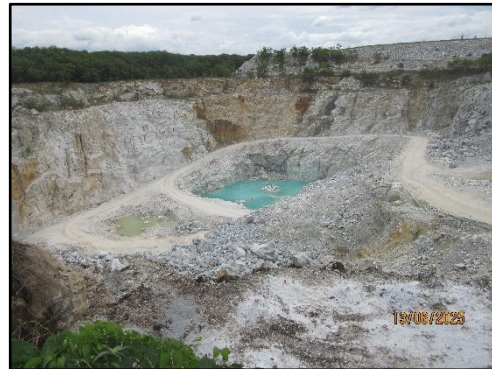
รูปที่ 30 การทำเหมืองแร่เป็นขั้นบันได