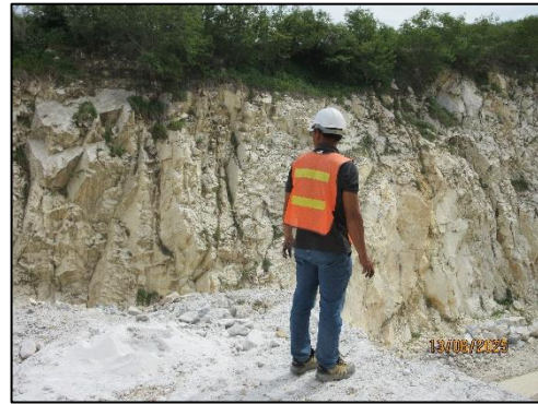
รูปที่ 24 พนักงานทุกคนสวมใส่อุปกรณ์ป้องกันอันตรายส่วนบุคคล