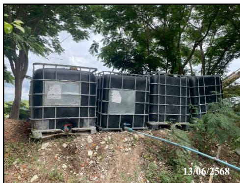
รูปที่ 28 ถังน้ำใช้ภายในพื้นที่โครงการ