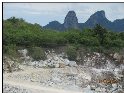
รูปที่ 3 พื้นที่ไม่ทำเหมืองตามแนวเขตประทานบัตรทิศใต้ ระยะ 50 เมตร