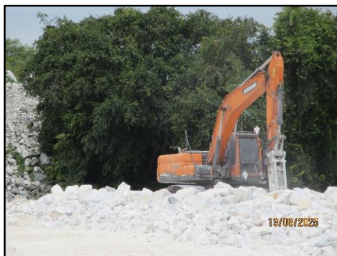
รูปที่ 7 เครื่องจักรและอุปกรณ์ในการทำเหมือง