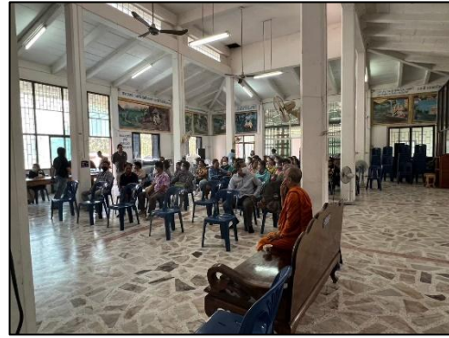
รูปที่ 23 การเผยแพร่ข้อมูล โครงการแก่งหินชนวน