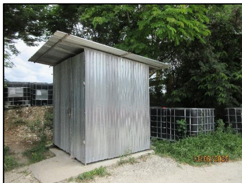
รูปที่ 29 ห้องน้ำสำหรับพนักงาน