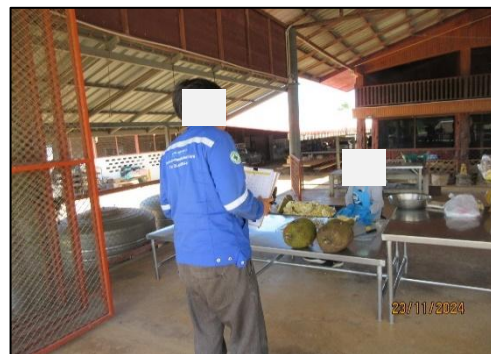
รูปที่ 39(ต่อ) การสำรวจสภาพสังคม เศรษฐกิจ และสิ่งแวดล้อม รอบพื้นที่โครงการ