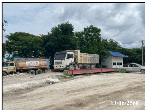
รูปที่ 37 จุดชั่งน้ำหนักรถบรรทุกแร่