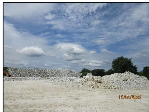
รูปที่ 31 พื้นที่กองเก็บเศษดิน