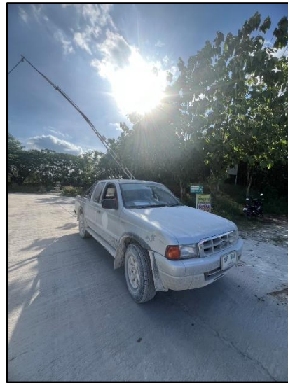
รูปที่ 35 สัญญาณเตือนก่อนมีการระเบิดเหมือง