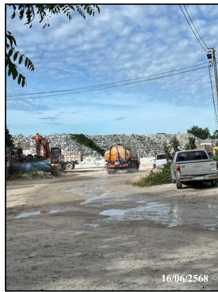
รูปที่ 32 การฉีดพรมน้ำในพื้นที่โครงการ