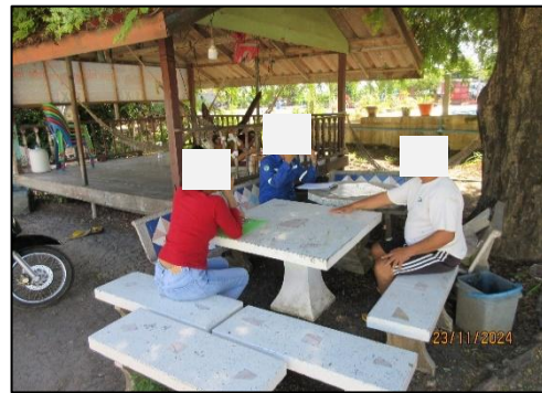
รูปที่ 39(ต่อ) การสำรวจสภาพสังคม เศรษฐกิจ และสิ่งแวดล้อม รอบพื้นที่โครงการ