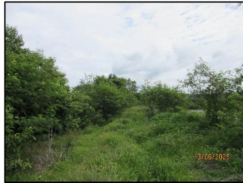
รูปที่ 10 พืชคลุมดิน