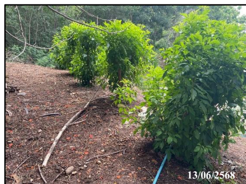
รูปที่ 12 การปลูกซ่อมแซมต้นไม้ที่ตายไป