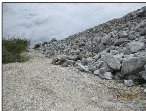
รูปที่ 8 คันทำนบดิน