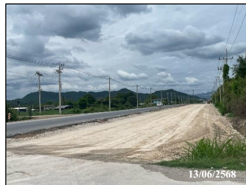
รูปที่ 18 สัญญาณจราจร บริเวณริมเส้นทางขนส่งแร่ด้านหน้าโครงการ