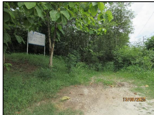
รูปที่ 14 ป้ายแสดงขอบเขตพื้นที่โครงการ