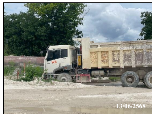
รูปที่ 33 จุดล้างล้อของรถบรรทุก