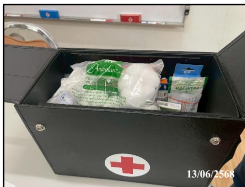
รูปที่ 26 อุปกรณ์ปฐมพยาบาล