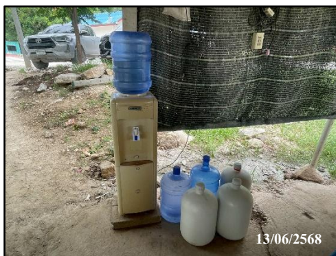
รูปที่ 27 ถังน้ำดื่มภายในพื้นที่โครงการ