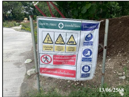
รูปที่ 17 ป้ายสัญญาณเตือน