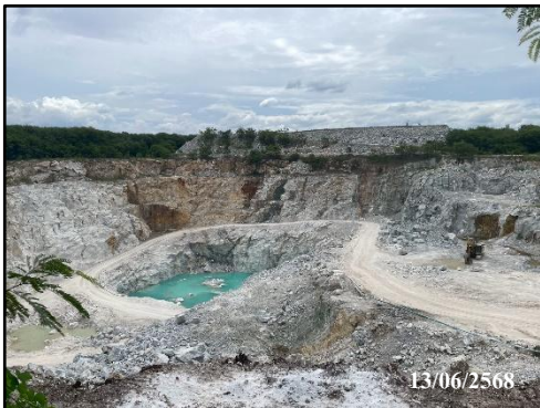
รูปที่ 5 พื้นที่ไม่ทำเหมืองตามแนวเขตประทานบัตร ระยะ 10 เมตร