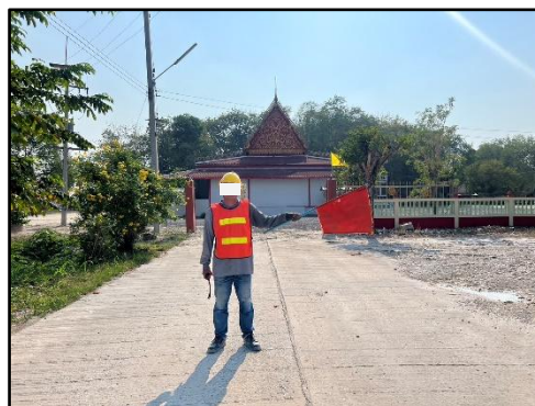
รูปที่ 36 เจ้าหน้าที่ปิดกั้นเส้นทางเข้าวัดถ้าแต่จนกว่าจะทำการระเบิดเสร็จ