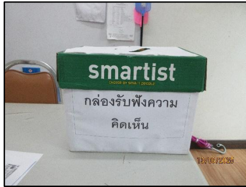
รูปที่ 1 กล่องรับฟังความคิดเห็น บริเวณพื้นที่โครงการ