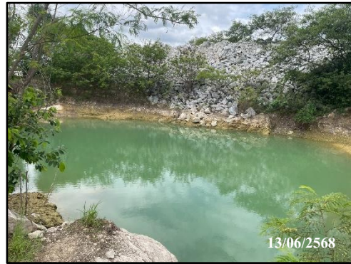
รูปที่ 13 บ่อคักตะกอน