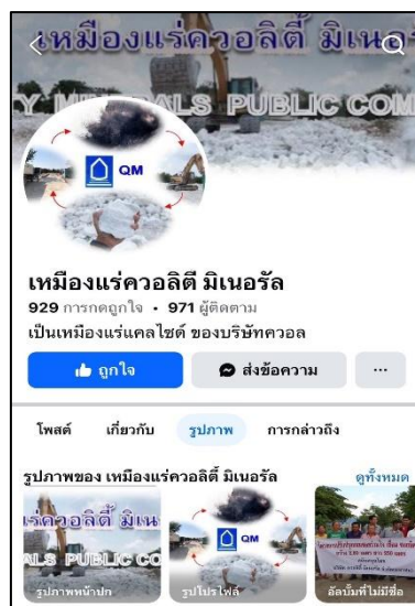
รูปที่ 22 การประชาสัมพันธ์ของโครงการ