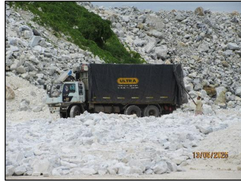
รูปที่ 34 การใช้ผ้าใบคลุมรถบรรทุก