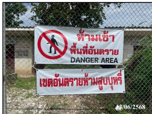
รูปที่ 16 ป้ายแจ้งเตือนห้ามบุคคลภายนอกเข้า