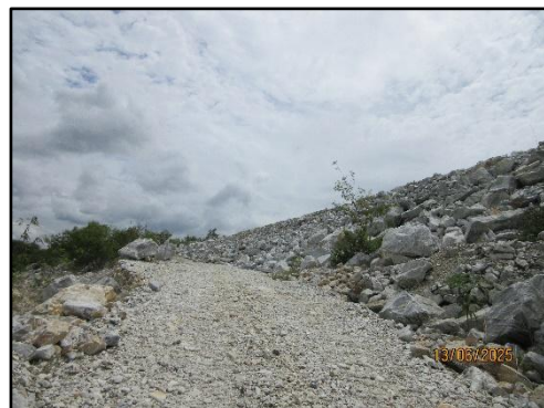
รูปที่ 4 พื้นที่ไม่ทำเหมืองตามแนวเขตประทานบัตรทิศเหนือ ระยะ 20 เมตร