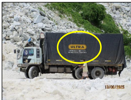
รูปที่ 21 ป้ายแสดงข้อมูลเบอร์โทรศัพท์ ข้างรถบรรทุกแร่