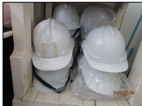
รูปที่ 25 สต็อกอุปกรณ์ป้องกันอันตรายส่วนบุคคล