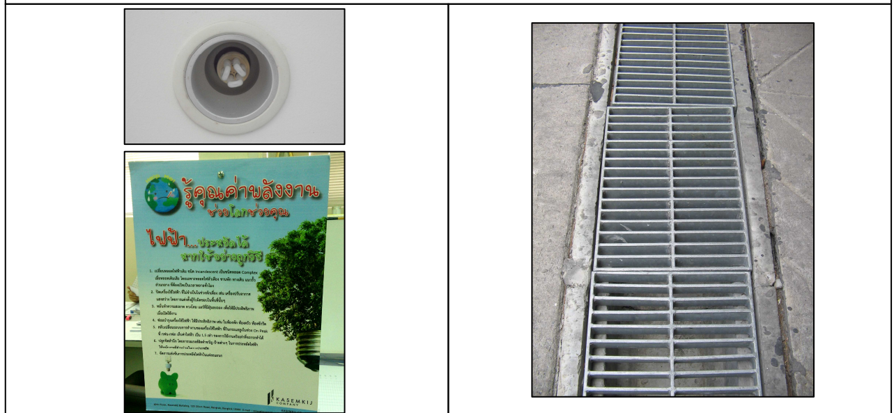
ภาพที่ 2-3 หลอดไฟประหยัดพลังงาน