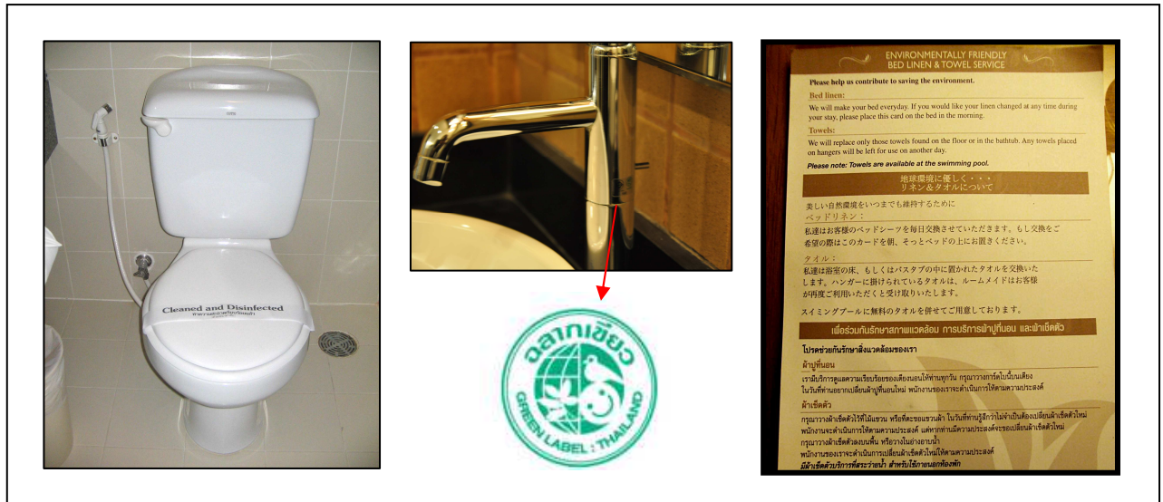
ภาพที่ 2-2 อุปกรณ์และสัญญาณประหยัดน้ำ และป้ายประหยัดพลังงาน