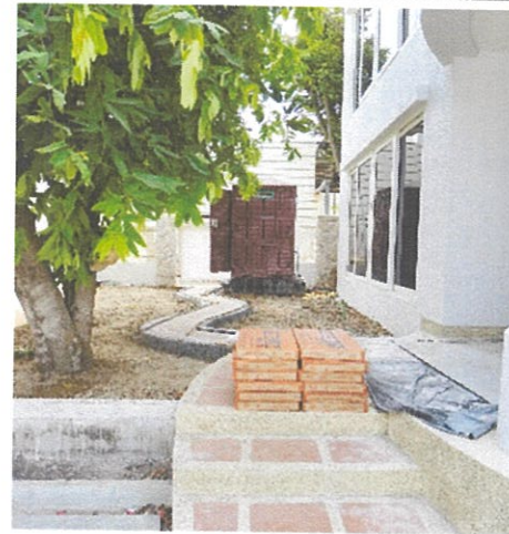
รูปที่ 2.2-2 ตรวจสอบกองวัสดุเป็นที่เป็นทาง