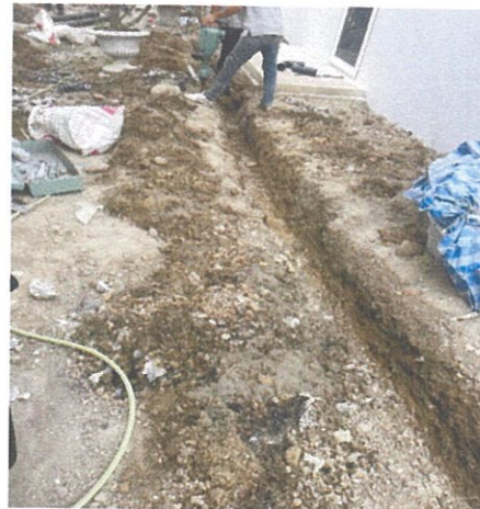
รูปที่ 2.2-3 รางระบายน้ำ