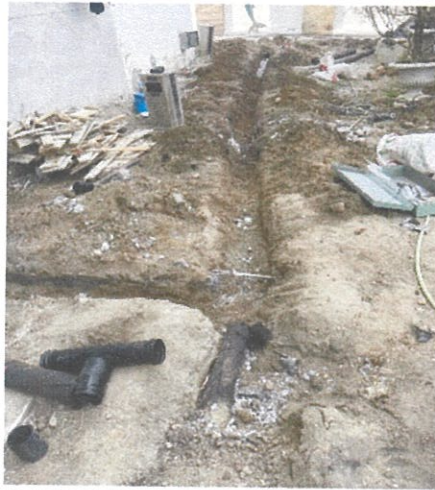
รูปที่ 2.2-1 กองดิน