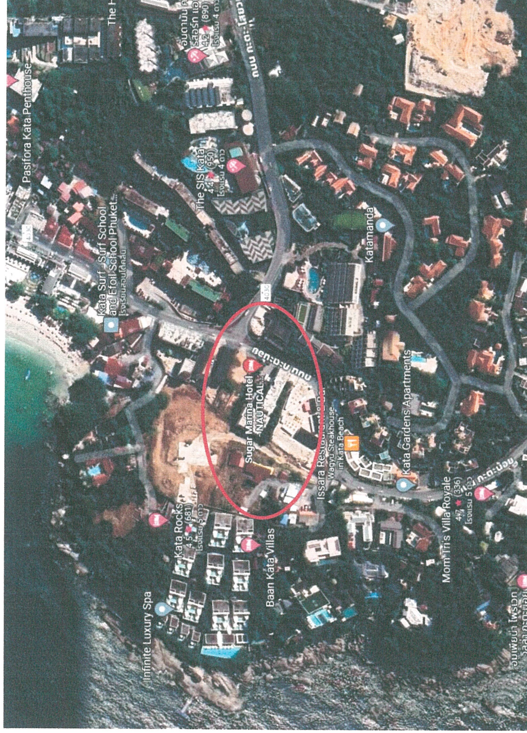
รูปภาพที่ 1.1 แผนที่ตั้งโครงการ โรงแรม ชูการ์ มาร์ีน่า รีสอร์ท นอดี้คัล (Top view)