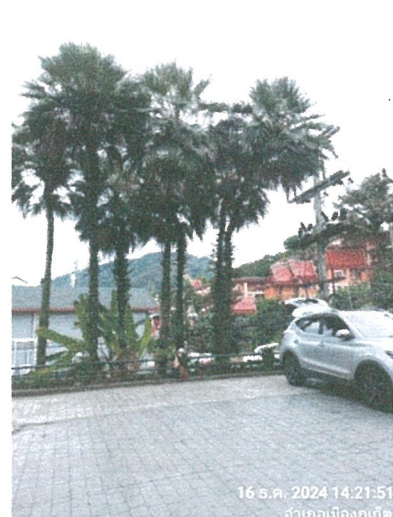
รูปภาพที่ 1.4 การใช้พื้นที่ของโครงการ