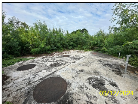
ระบบบำบัดน้ำเสีย