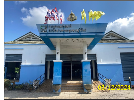
อาคารศูนย์ชุมชน