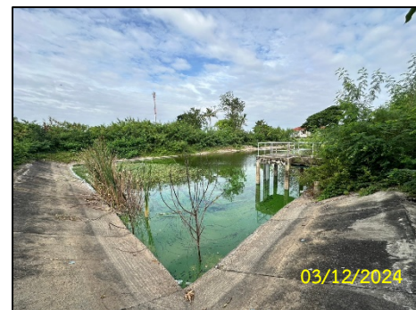
บ่อหนองน้ำ