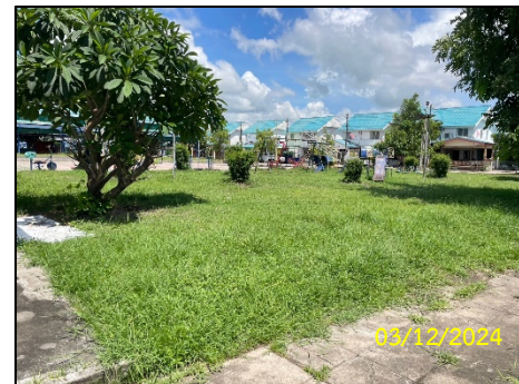
พื้นที่สวนสาธารณะ