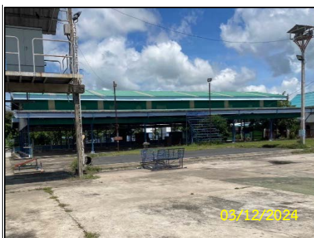
ลานค้าชุมชน