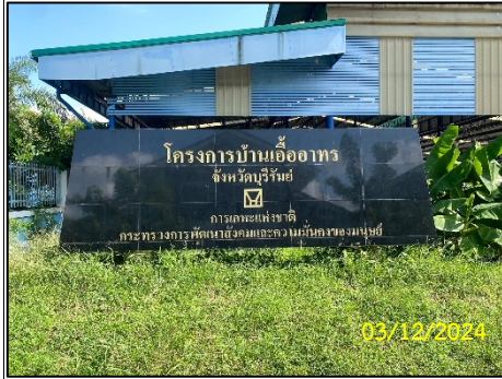
ป้ายชื่อโครงการ