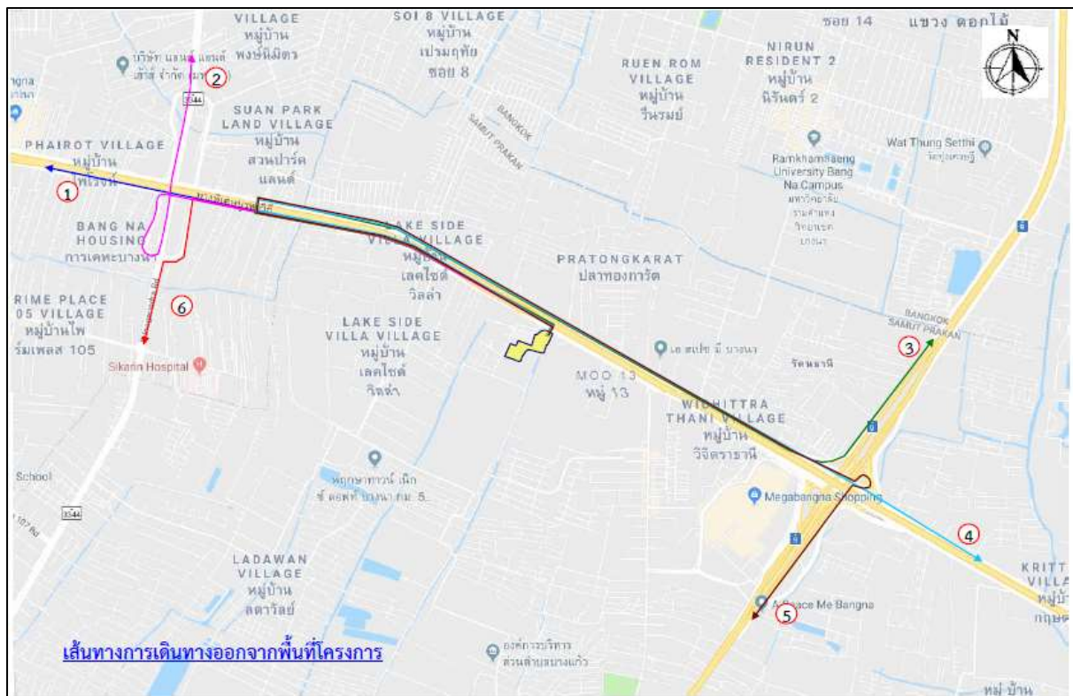
รูปที่ 2.1-1 ที่ตั้งโครงการโดยสังเขป และเส้นทางเข้า-ออกพื้นที่โครงการ