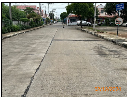
ถนนภายในโครงการ