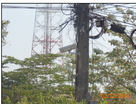
กล้องวงจรปิด