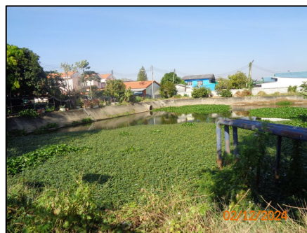
บ่อหนองน้ำฝน