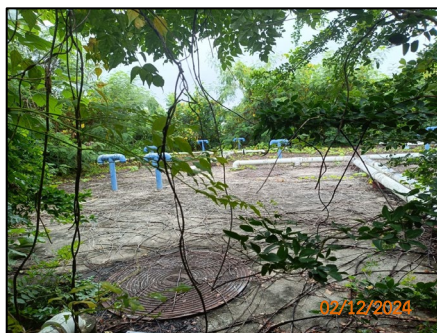
ระบบบำบัดน้ำเสีย