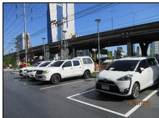
รูปที่ 1.2 สภาพปัจจุบันของโครงการ