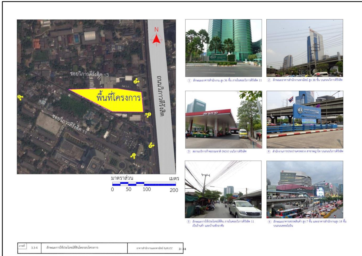
รูปที่ 1.1 แผนที่สังเขปแสดงที่ตั้งโครงการอาคารสำนักงาน และพาณิชยกรรม ByBUZZ