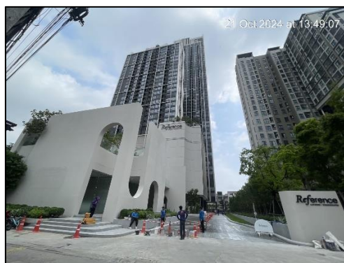
ภาพที่ 1.6-1 สถานภาพการก่อสร้างโครงการในปัจจุบัน