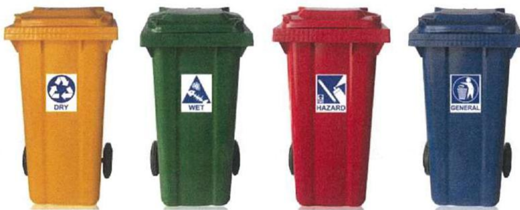
มูลฝอยรีไซเคิล

โครงการได้จัดให้มีห้องพักมูลฝอยประจำชั้นพักอาศัยทุกชั้น ตั้งอยู่บริเวณ โถงลิฟต์ดับเพลิง เป็น ห้องที่มีประตูปิดมิดชิด ภายในห้องจะบรรจุถังรองรับมูลฝอยแยกประเภทเป็นถังรองรับมูลฝอยแห้งทั่วไป (สีน้ำเงิน) ถังรองรับมูลฝอยเปียก (สีเขียว) ถังรองรับมูลฝอยรีไซเคิล (สีเหลือง) และถังรองรับมูลฝอยอันตราย (สีแดง) ขนาด 150 ลิตร จำนวนอย่างละ 1 ถัง เพื่อให้ผู้พักอาศัยในแต่ละชั้นนำมูลฝอยมาทิ้ง โดยจะมีพนักงานทำความสะอาด สะอาดประจำอาคารเข้ามาเก็บขนไปรวบรวมไว้ที่ห้องพักมูลฝอยรวมของอาคารทุกวัน