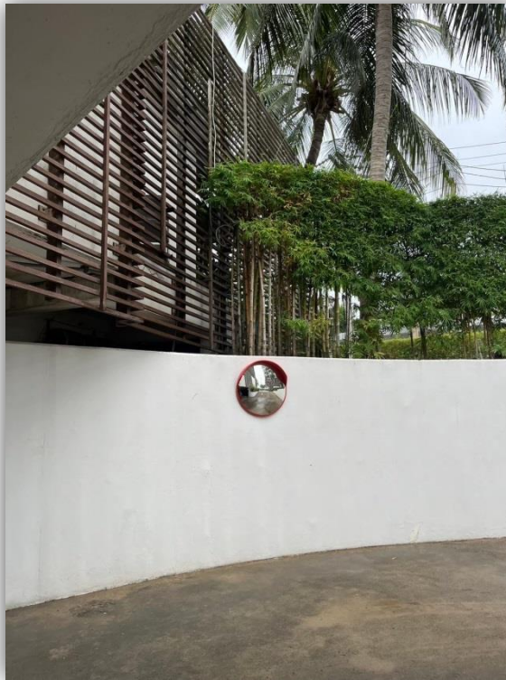
ภาพที่ 55 กระจกโค้งจราจร