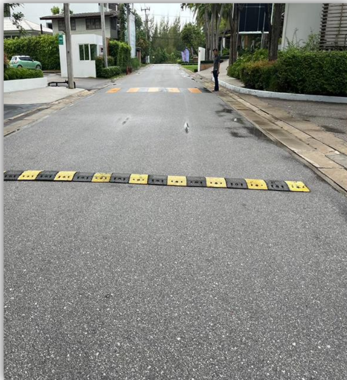
ภาพที่ 28 แสดงสัญญาณชะลอความเร็ว