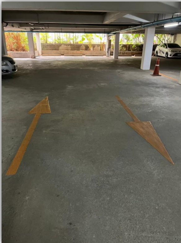
ภาพที่ 37 แสดงทิศทางการเดินรถ