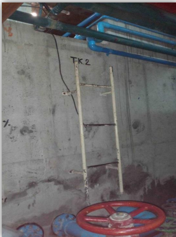
ภาพที่ 38 แสดงถังเก็บน้ำสำรองของโครงการ