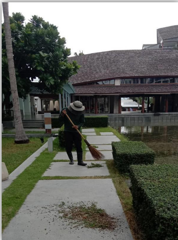
ภาพที่ 57 แสดงพนักงานทำความสะอาดประจำโครงการ