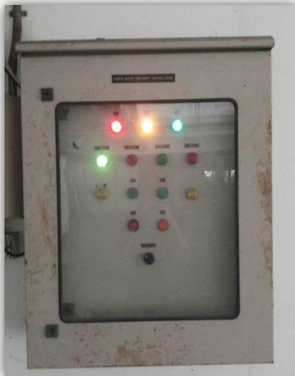
ภาพที่ 30 แสดงตู้คอนโทรลควบคุมการทำงานของระบบน้ำเสีย