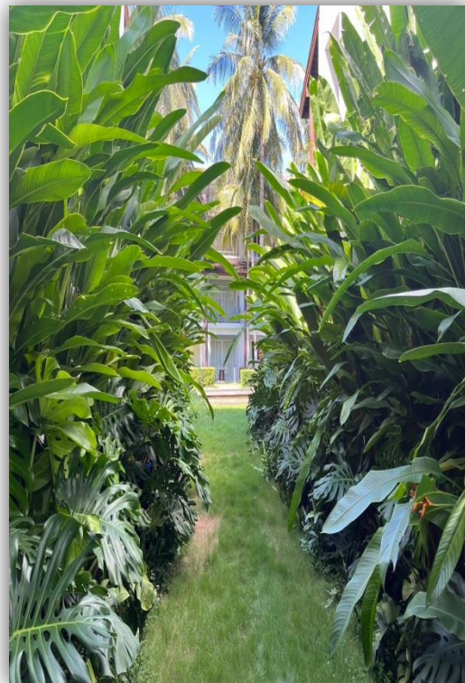
ภาพที่ 8 และ 9 แสดงพื้นที่สีเขียวภายในโครงการ