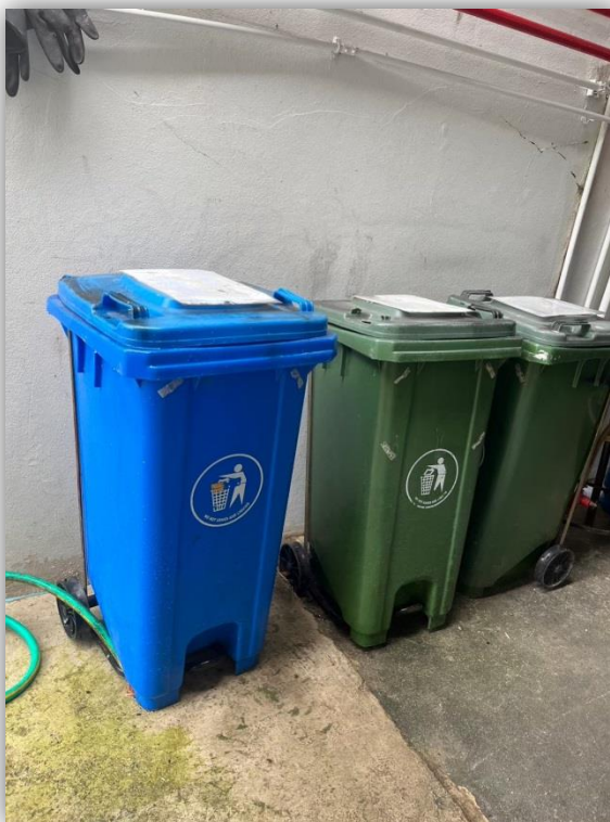
ภาพที่ 13 แสดงถังขยะแต่ละประเภท