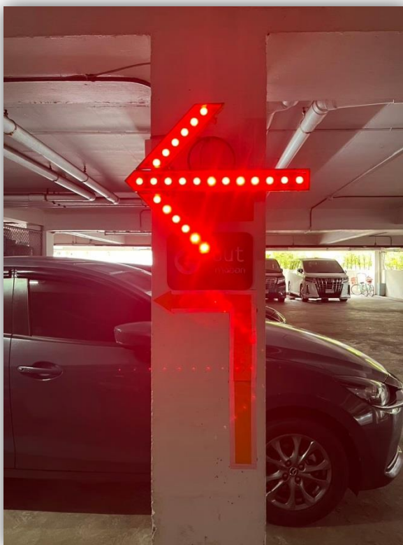
ภาพที่ 54 แสดงป้ายบอกทิศทางออกโครงการ