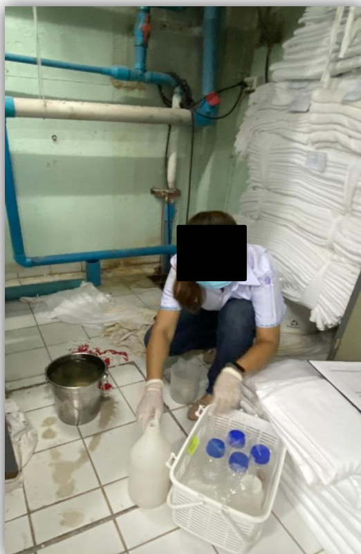
ภาพที่ 33 แสดงภาพเก็บตัวอย่างน้ำทิ้ง