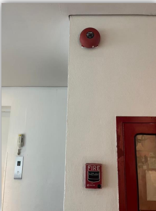
ภาพที่ 15 ระบบสัญญาณแจ้งเหตุเพลิงไหม้