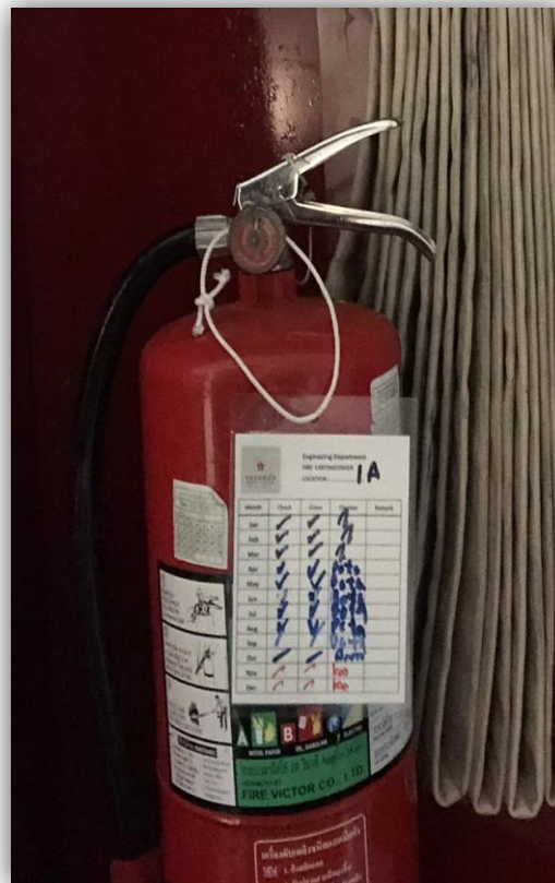
ภาพที่ 69 และ 70 แสดงการตรวจเช็คถังดับเพลิง