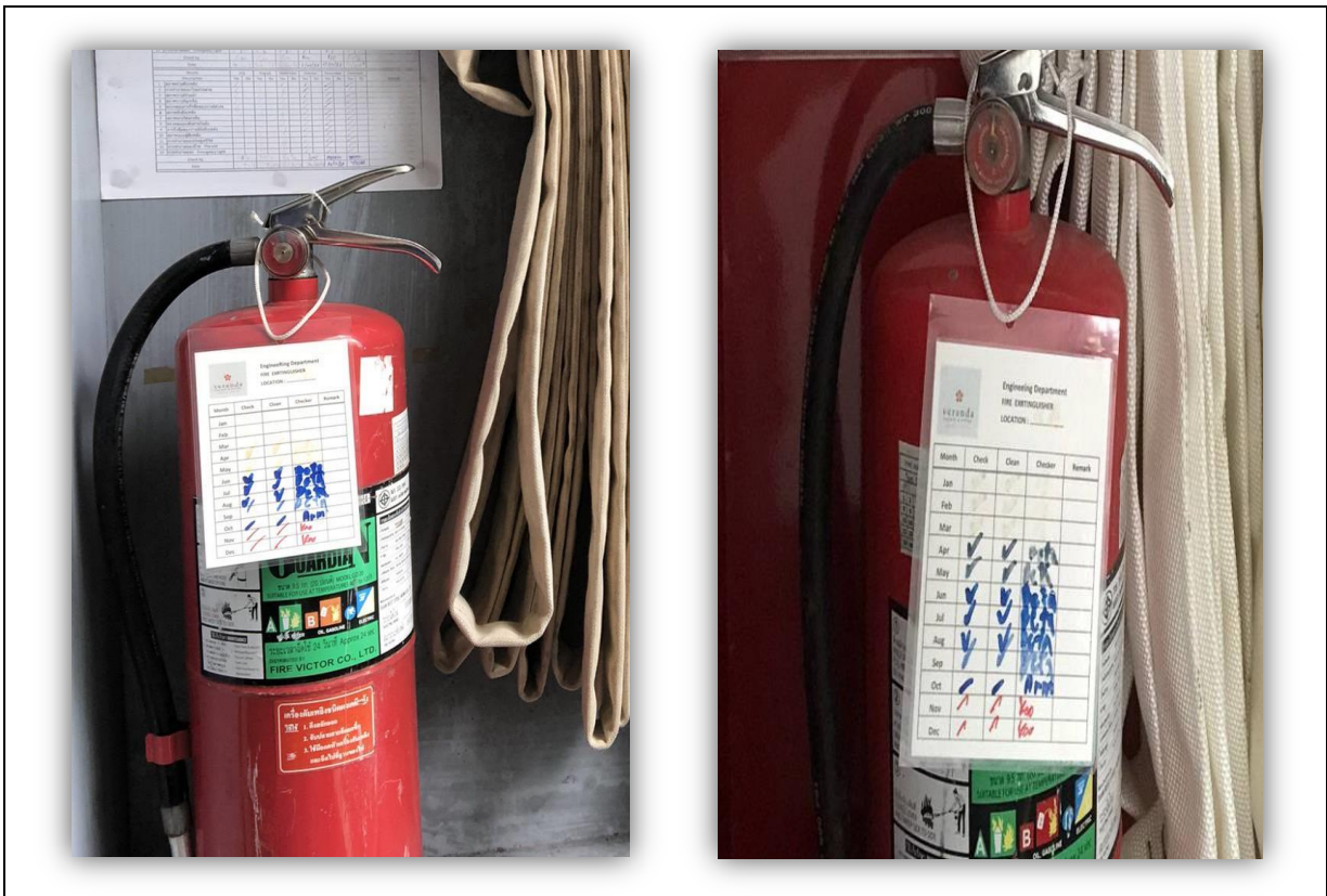
ภาพที่ 71 และ 72 แสดงการตรวจเช็คถังดับเพลิง