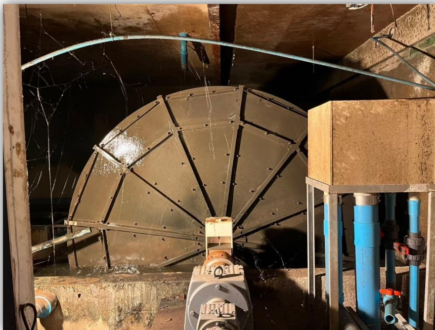
ภาพที่ 29 แสดงระบบบำบัดน้ำเสีย