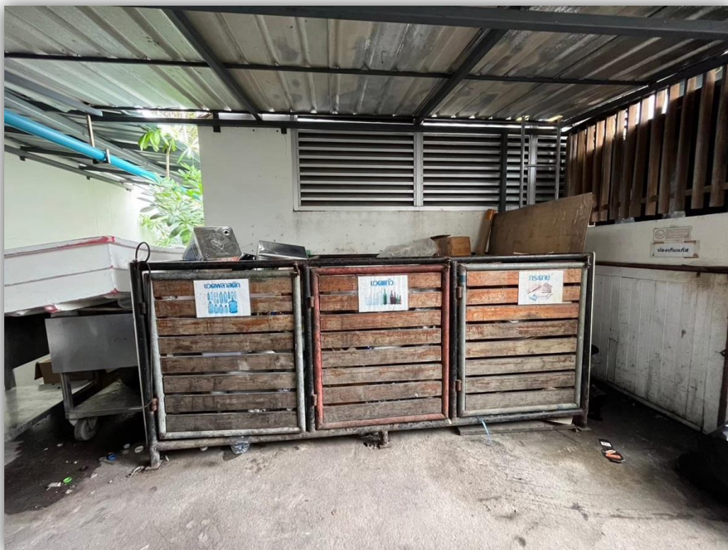
ภาพที่ 12 แสดงถังขยะแต่ละประเภท