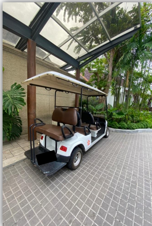
ภาพที่ 51 และ 52 แสดงรถบริการของโครงการ