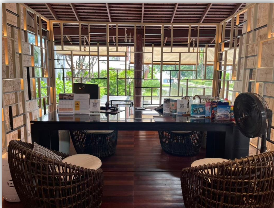
ภาพที่ 4 แสดงจุดบริการต้อนรับ