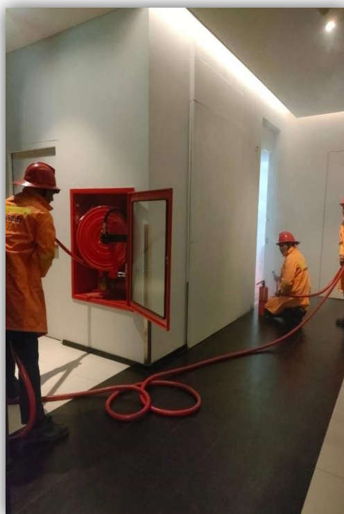
ภาพที่ 64 แสดงการอบรมฝึกซ้อมดับเพลิง และฝึกซ้อมอพยพหนีไฟ