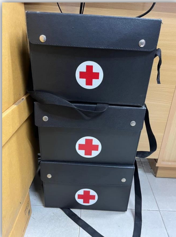
ภาพที่ 26 แสดงกล่องปฐมพยาบาลเบื้องต้น