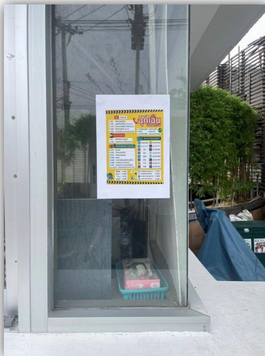
ภาพที่ 24 แสดงห้องพนักงานรักษาความปลอดภัยภายในโครงการ