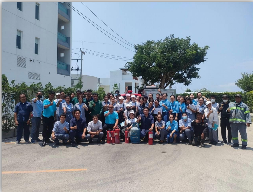
ภาพที่ 68 แสดงการอบรมฝึกซ้อมดับเพลิง และฝึกซ้อมอพยพหนีไฟ