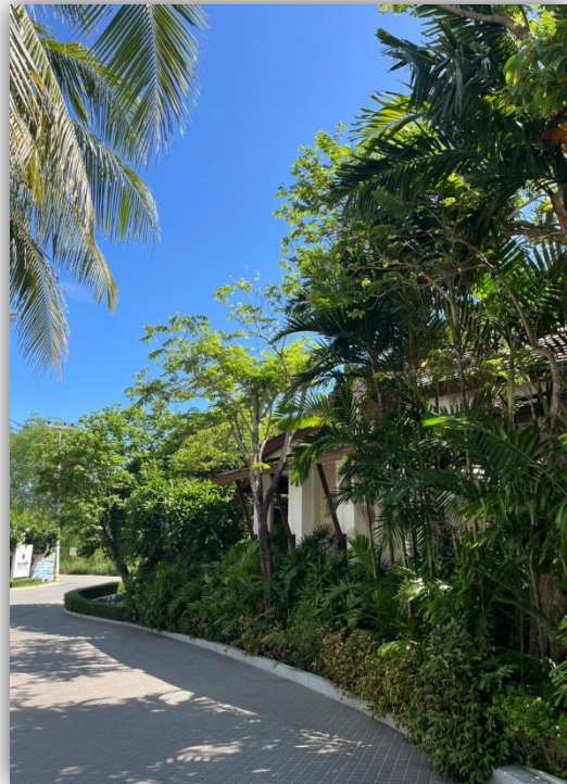
ภาพที่ 6 และ 7 แสดงพื้นที่สีเขียวภายในโครงการ