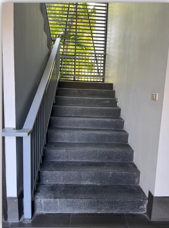
ภาพที่ 20 แสดงบันไดหนีไฟ