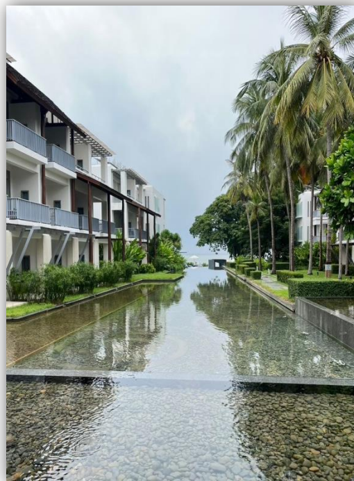
ภาพที่ 2 และ 3 แสดงภูมิสถาปัตยกรรมภายในโครงการ