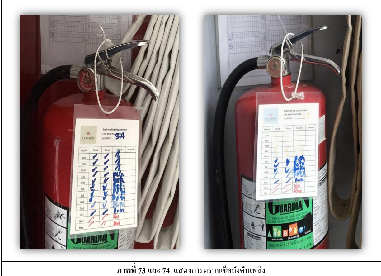
ภาพที่ 73 และ 74 แสดงการตรวจเช็คถังดับเพลิง