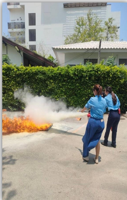
ภาพที่ 65 และ 66 แสดงการอบรมฝึกซ้อมดับเพลิง และฝึกซ้อมอพยพหนีไฟ