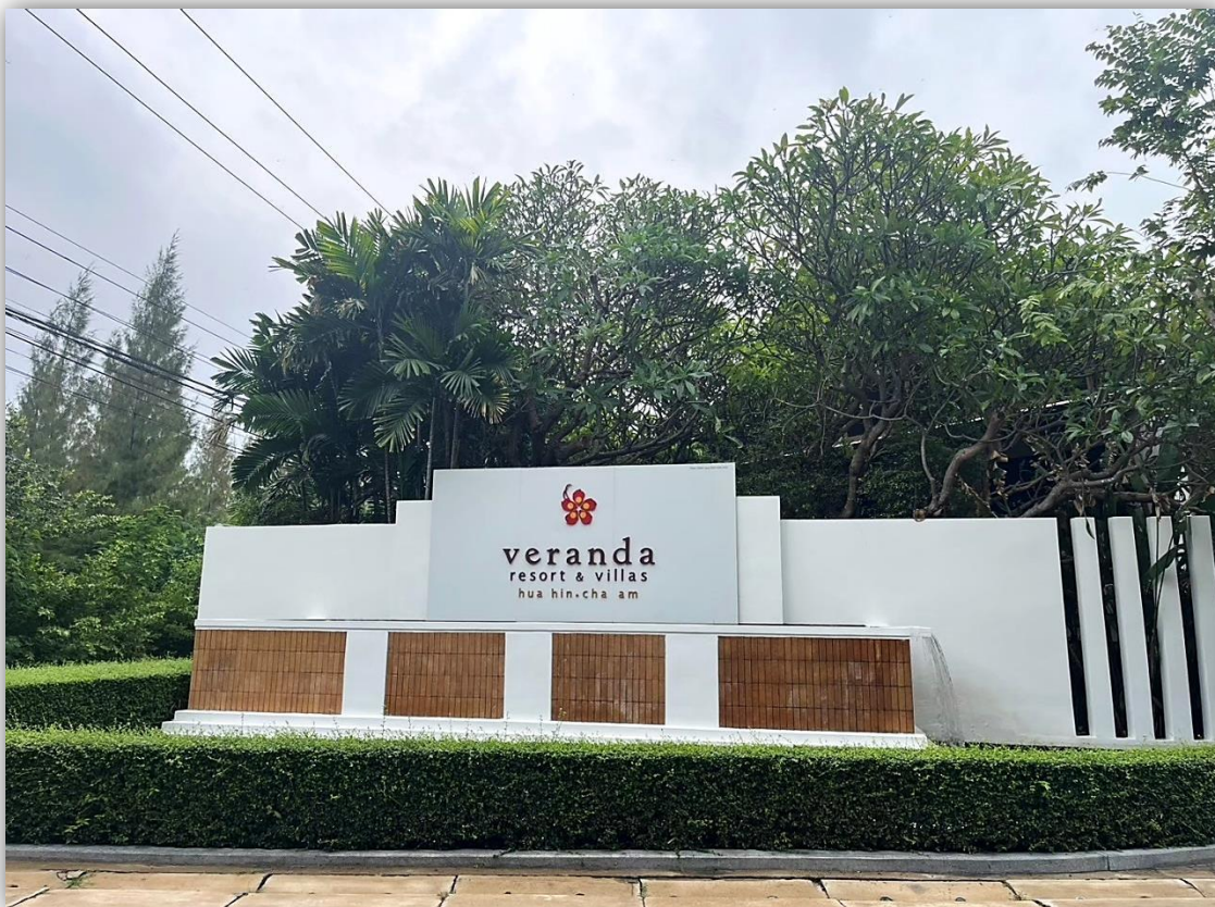
ภาพที่ 1 แสดงป้ายชื่อโครงการ