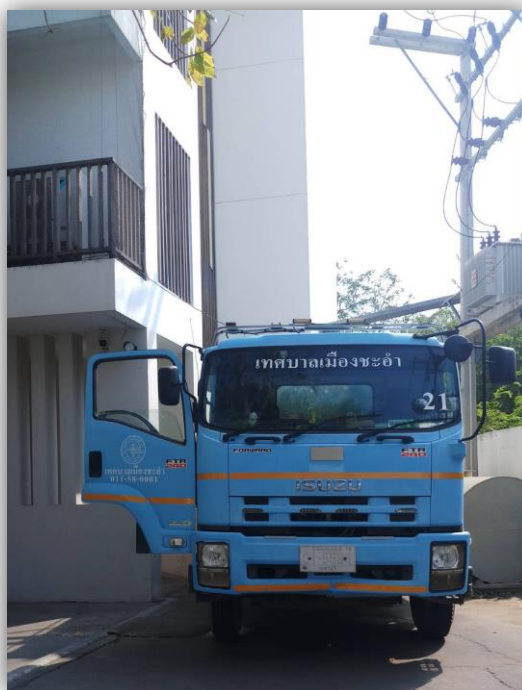
ภาพที่ 14 แสดงรถขนเก็บขยะเทศบาลชะอำ