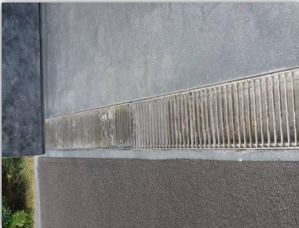
ภาพที่ 10 แสดงตะแกรงดักเศษขยะ เศษดิน ใบไม้ หน้าโครงการ