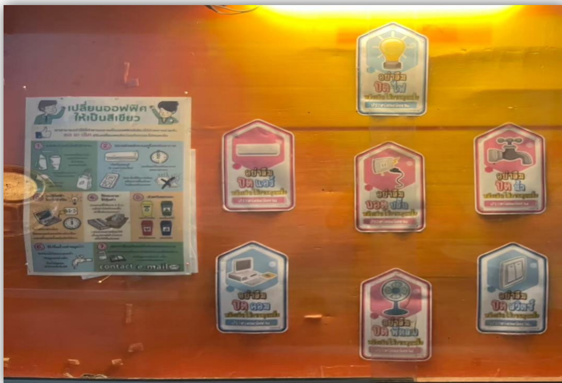
ภาพที่ 34 แสดงป้ายประชาสัมพันธ์ ประหยัดน้ำ ประหยัดไฟภายในโครงการ