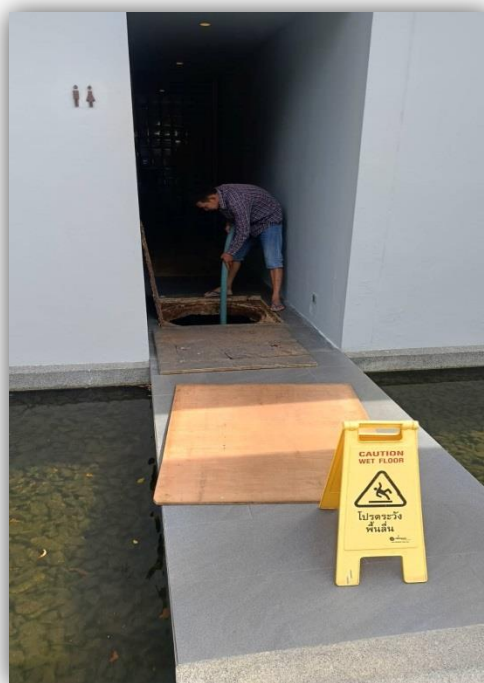
ภาพที่ 61 และ 62 แสดงบริการสูบน้ำก่อน