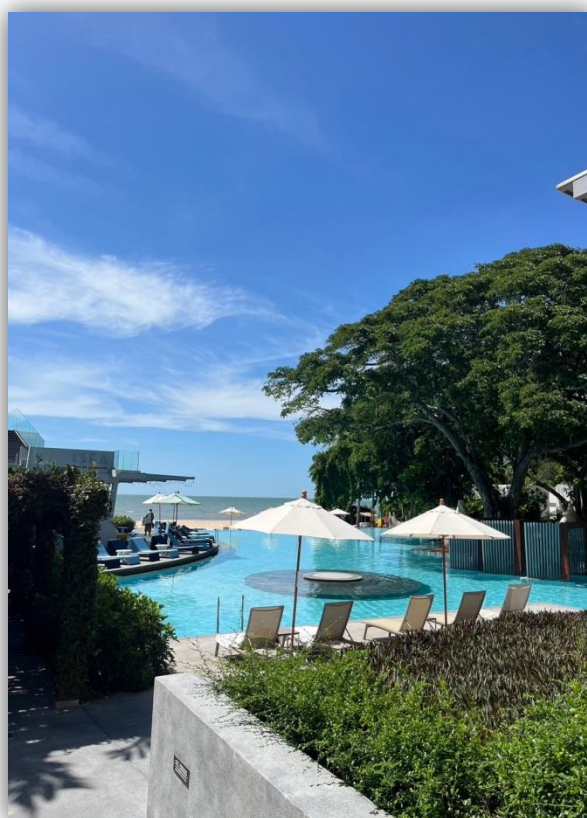
ภาพที่ 5 แสดงทัศนียภาพติดทะเล