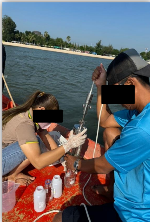
ภาพที่ 31 และ 32 แสดงภาพเก็บตัวอย่างน้ำทะเล