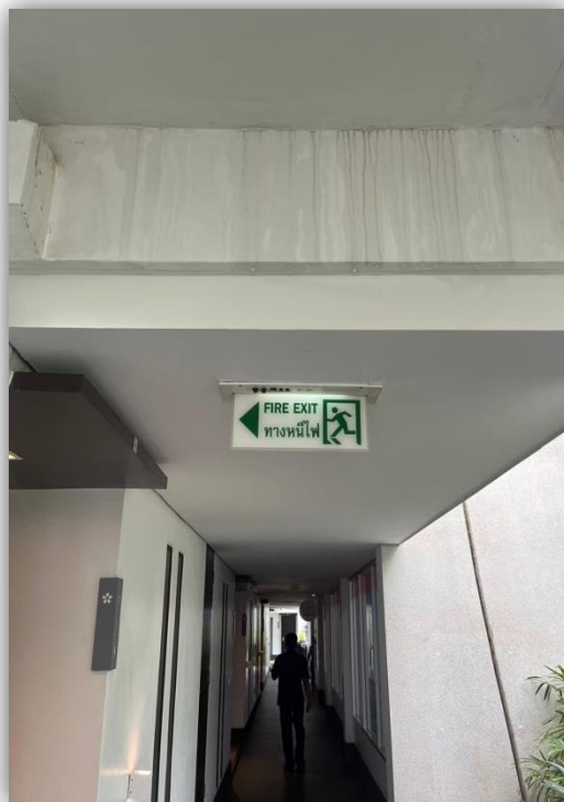
ภาพที่ 18 และ 19 แสดงป้ายบอกทางหนีไฟ