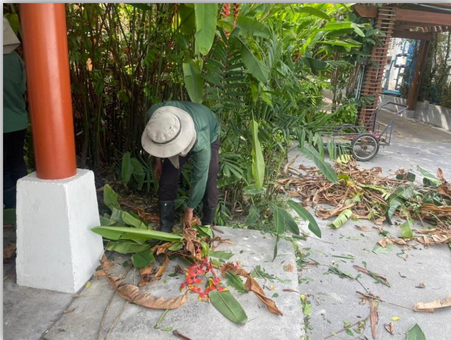
ภาพที่ 56 แสดงพนักงานทำความสะอาดประจำโครงการ