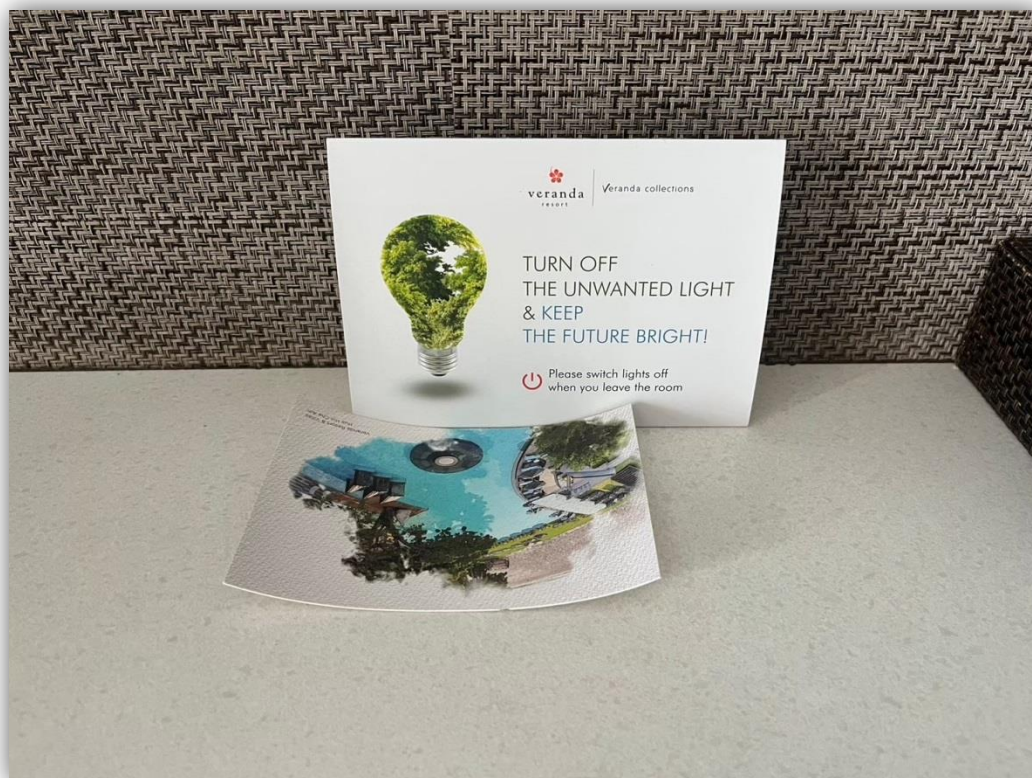
ภาพที่ 35 แสดงป้ายรณรงค์ ประหยัดไฟภายในห้องพัก