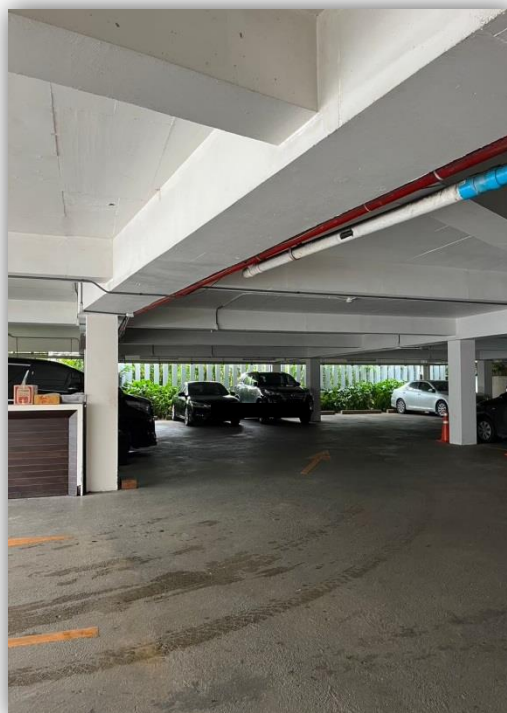
ภาพที่ 48 และ 49 แสดงลานจอดรถภายในโครงการ