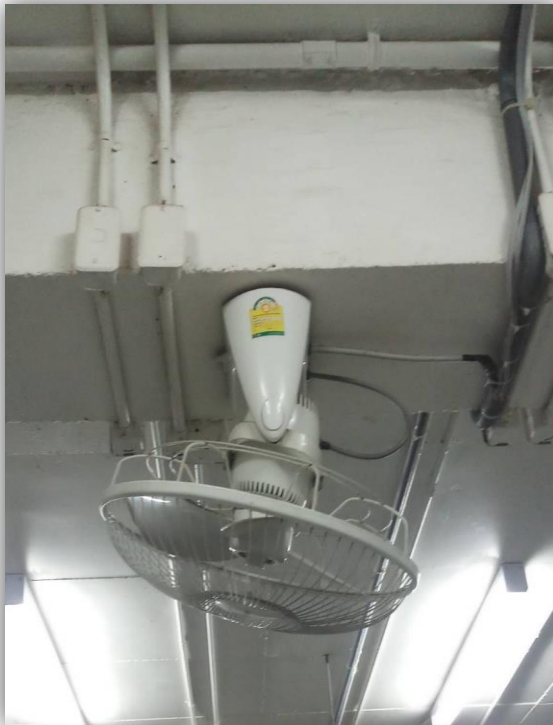
ภาพที่ 36 แสดงเครื่องใช้ไฟฟ้า ฉลากประหยัดไฟเบอร์ 5