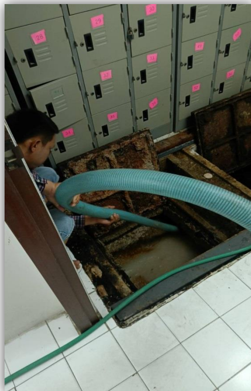
ภาพที่ 59 และ 60 แสดงบริการสูบน้ำก่อน