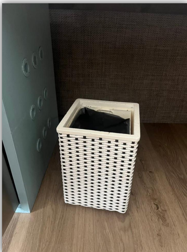
ภาพที่ 42 แสดงถังขยะในห้องพัก