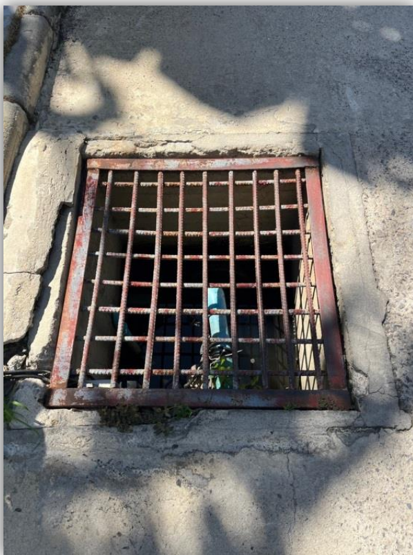
ภาพที่ 45 แสดงบ่อหน้าฝนของโครงการ