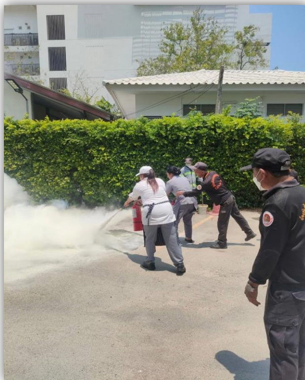
ภาพที่ 67 แสดงการอบรมฝึกซ้อมดับเพลิง และฝึกซ้อมอพยพหนีไฟ