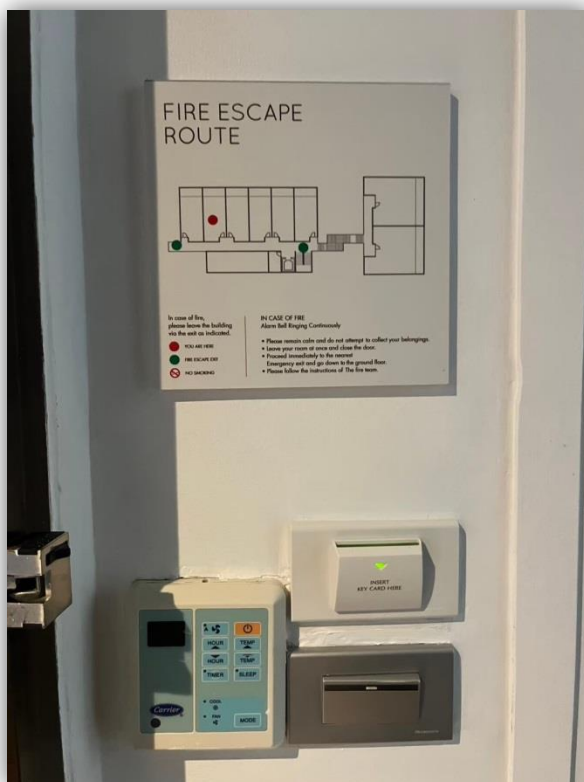
ภาพที่ 23 แสดงผังทางเดินหนีไฟภายในห้องพัก