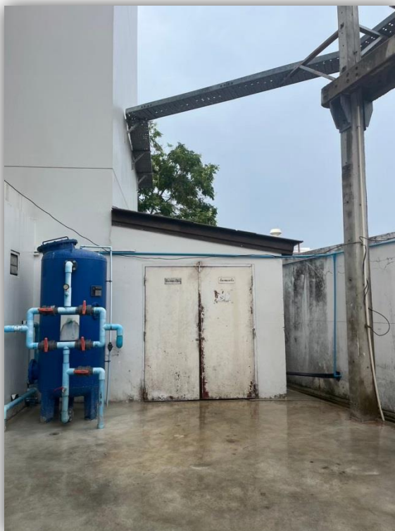
ภาพที่ 11 แสดงห้องพักขยะแห้งและเปียก