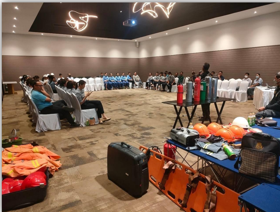
ภาพที่ 63 แสดงการอบรมฝึกซ้อมดับเพลิง และฝึกซ้อมอพยพหนีไฟ