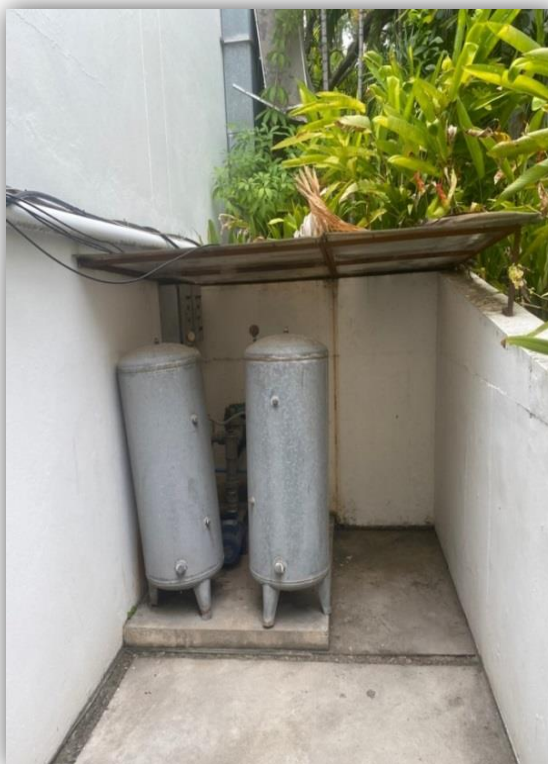
ภาพที่ 44 แสดงระบบสูบน้ำภายในโครงการ