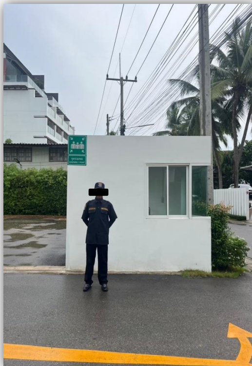
ภาพที่ 50 แสดงเจ้าหน้าที่รักษาความปลอดภัย