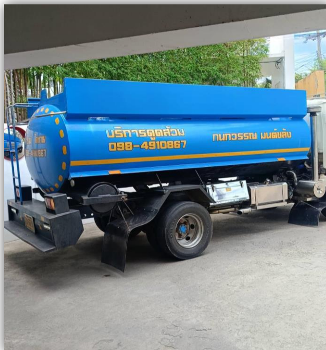
ภาพที่ 58 แสดงรถเอกชน บริการสูบน้ำ