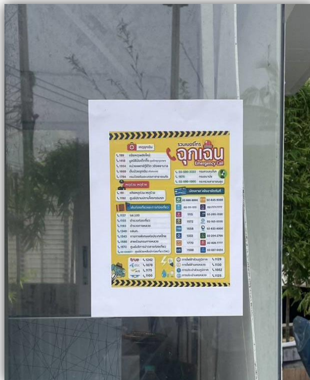
ภาพที่ 25 แสดงเบอร์โทรศัพท์ติดต่อฉุกเฉินเหตุร้ายในเขต ชะอำ