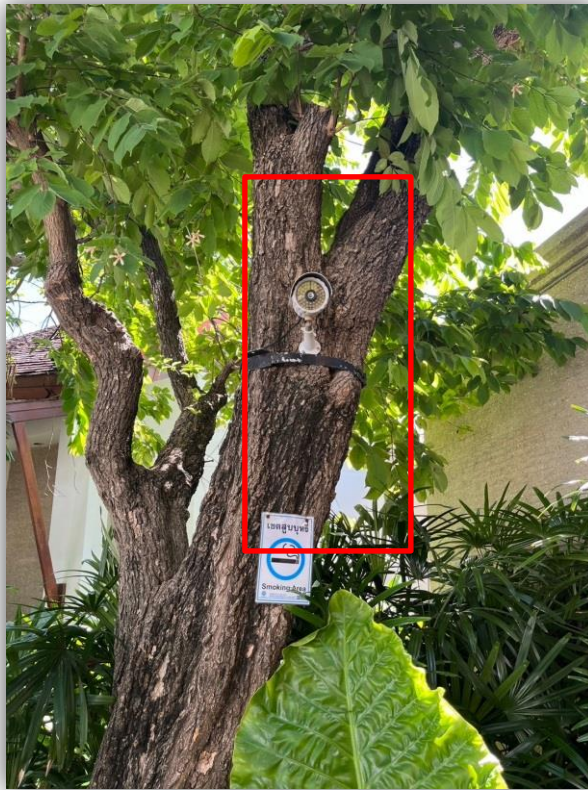
ภาพที่ 27 แสดงกล้องวงจรปิด