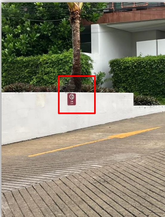
ภาพที่ 53 แสดงป้ายบอกทิศทางเข้าโครงการ