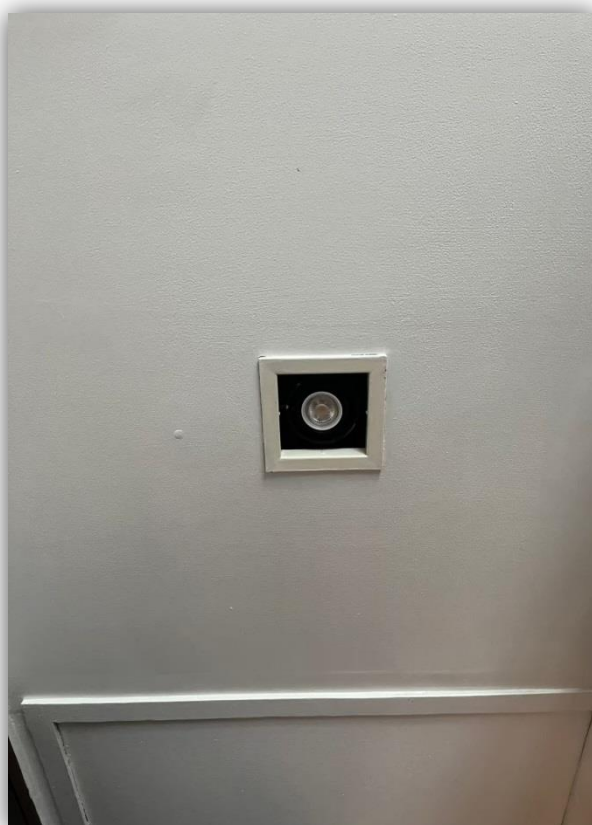
ภาพที่ 47 แสดงหลอดไฟ LED ประหยัดพลังงาน