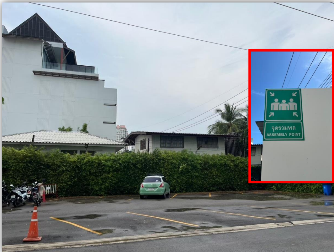
ภาพที่ 17 แสดงพื้นที่จุดรวมพล