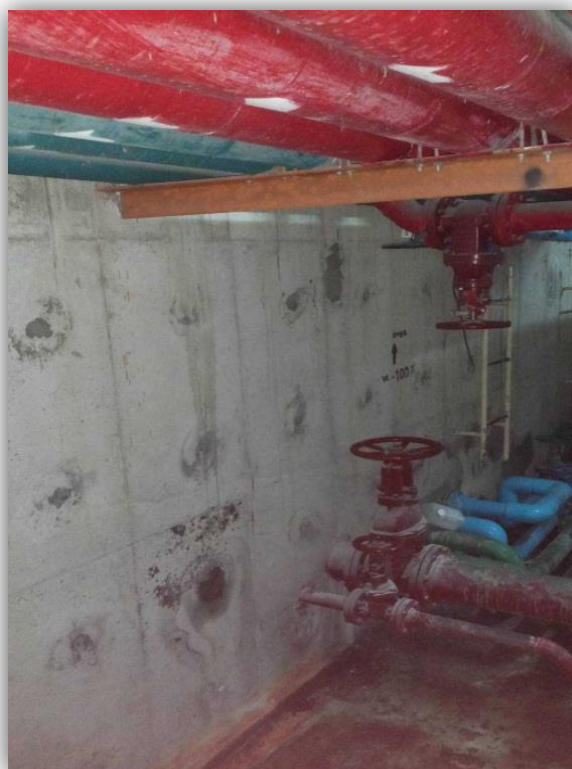
ภาพที่ 39 แสดงระบบจ่ายน้ำและระบบเส้นท่อประปา