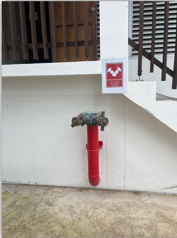
ภาพที่ 21 แสดงหัวรับน้ำดับเพลิง