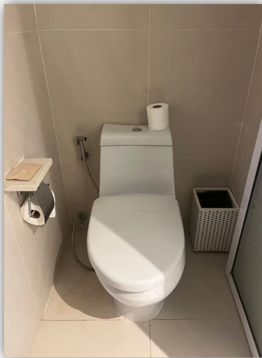
ภาพที่ 40 และ 41 แสดงสุขภัณฑ์ภายในห้องพัก