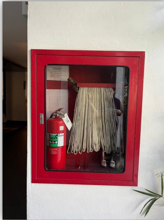
ภาพที่ 16 แสดงถังดับเพลิง