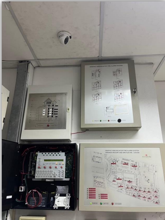
ภาพที่ 22 แสดงผังควบคุมสัญญาณเตือนเพลิงไหม้