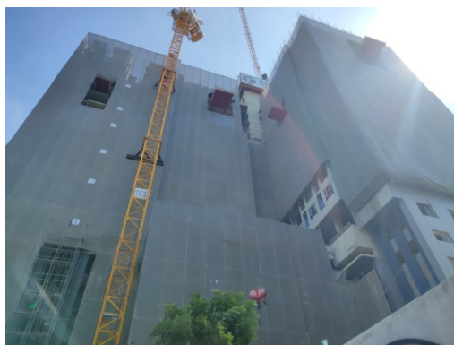
ภาพที่ 3 การก่อสร้างโครงการในปัจจุบัน ช่วงก่อสร้างเดือน กรกฎาคม ถึง ธันวาคม 2567