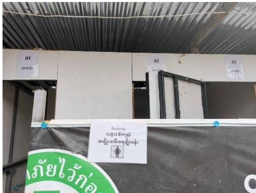
รูปที่ 9 สุขภัณฑ์