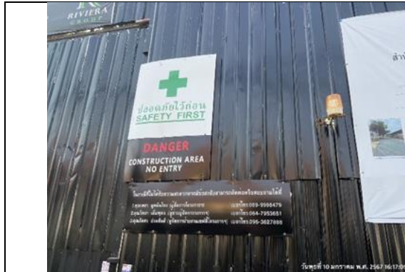
รูปที่ 13 สัญญาณไฟจราจร

ของบริษัท ริเวียร่า มาลิบู พร็อพเพอร์ตี้ ดีเวลลอปเม้นท์ จำกัด