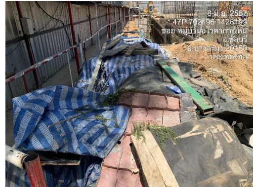
รูปที่ 8 วัสดุคลุมดิน