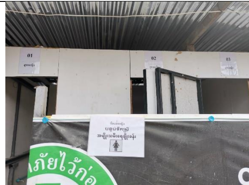
รูปที่ 16 ห้องน้ำ