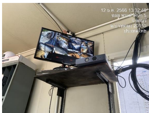
รูปที่ 4 กล้องวงจรปิด