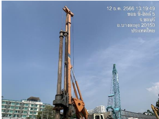
รูปที่ 7 เข็มเจาะแบบ Non Vibration