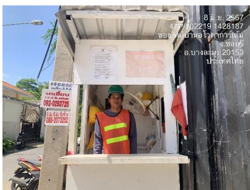
รูปที่ 5 เจ้าหน้าที่รักษาความปลอดภัย