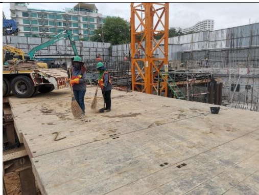
รูปที่ 11 พนักงานทำความสะอาด