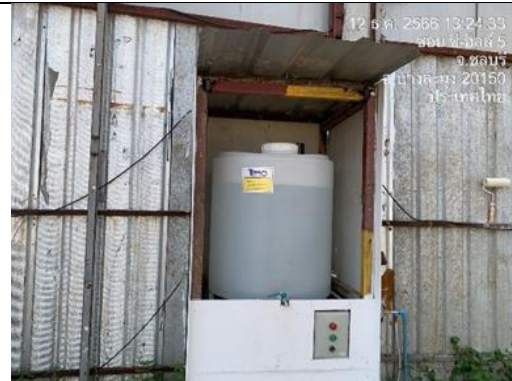
รูปที่ 14 ตู้น้ำดื่ม