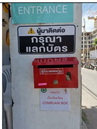
รูปที่ 3 กล่องรับฟังความคิดเห็น