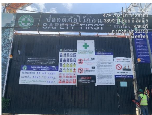
รูปที่ 1 ป้ายโครงการและรายละเอียดโครงการ

รูปภาพแสดงการปฏิบัติตามมาตรการฯ ของโครงการอาคารชุด เดอะ ริวีเยรา มาลิบู (THE RIVIERA MALIBU)