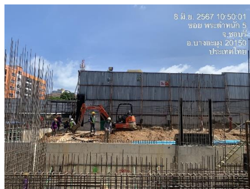
รูปที่ 2 รั้วโครงการ