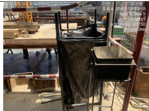
รูปที่ 12 ถังดำนองรับขยะมูลฝอย