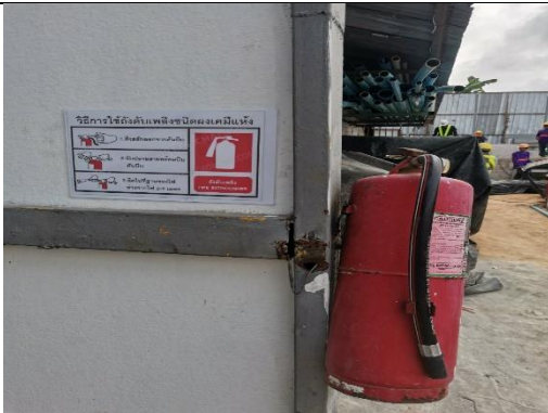
รูปที่ 15 ถังดับเพลิง