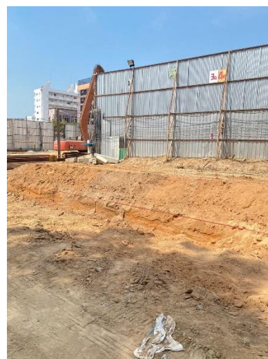
รูปที่ 6 ไฟส่องสว่างภายในโครงการ

รวบรวมการปฏิบัติงาน โดยเจ้าหน้าที่ของโครงการ และทีมงานบริษัท ทีเอ็นพี เอ็นไวรอนเม้นท์ จำกัด