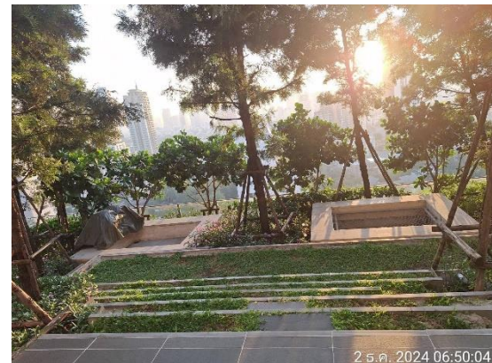
รูปที่ 1.2-2 สภาพปัจจุบัน