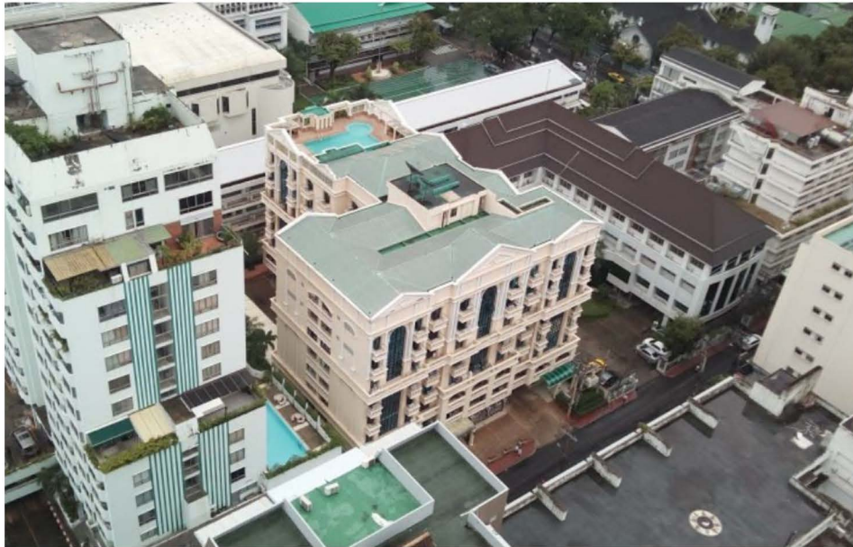
ภาพที่ 1-2 สถานภาพของโครงการในปัจจุบัน

ปัจจุบันโครงการ สีส้ม เทอเรส (อาคารชุดพักอาศัยสีลม ซิตี คอนโดมิเนียม) ก่อสร้างและเปิดดำเนินการโดยมีผู้เข้าพักอาศัยภายในโครงการเป็นที่เรียบร้อยแล้ว