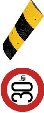
ตัวอย่างป้ายจำกัดความเร็ว และคันสะดุด