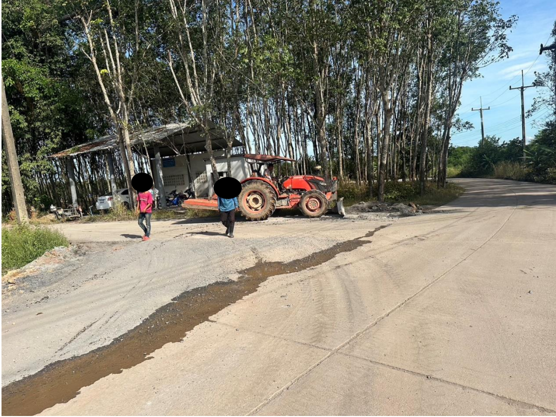
ซ่อมแซมถนน ต่างๆ