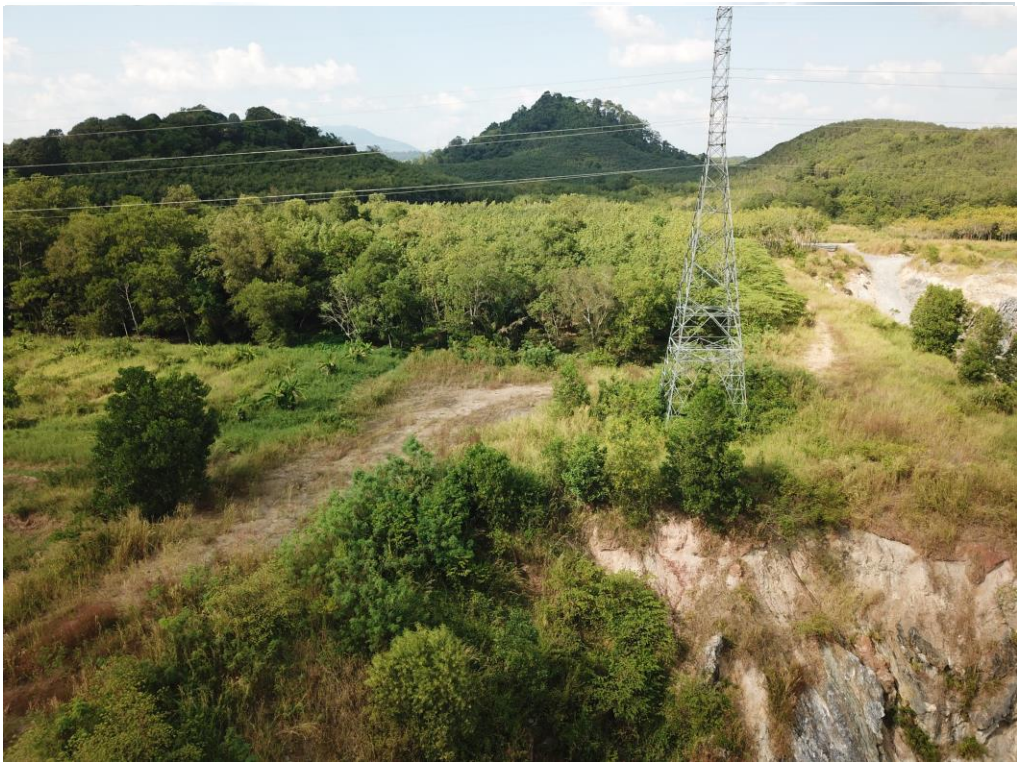
❶ สภาพพื้นที่โครงการเมื่อมองไปทางด้านทิศตะวันออกเฉียงใต้