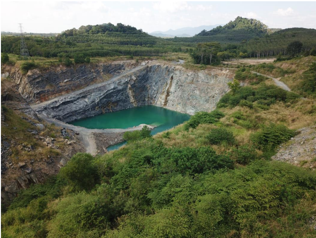
❷ สภาพพื้นที่โครงการเมื่อมองไปทางด้านทิศตะวันตก

รูปที่ 1-2 (ต่อ) แสดงขอบเขตพื้นที่โครงการและสภาพพื้นที่ปัจจุบัน