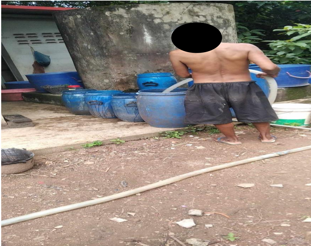
น้ำให้ชาวบ้าน ใช้ในครัวเรือน ภัยแล้ง ปี 2567