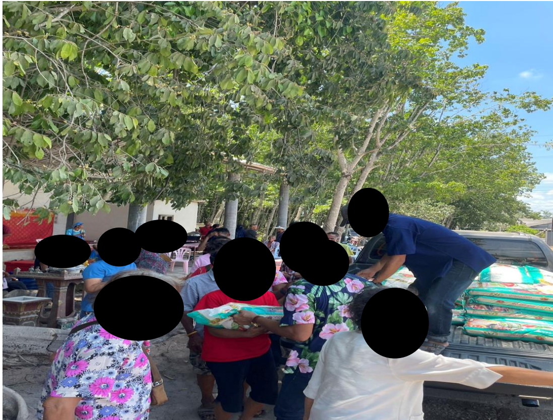
ทำบุญแจกข้าว ประจำปี 2567