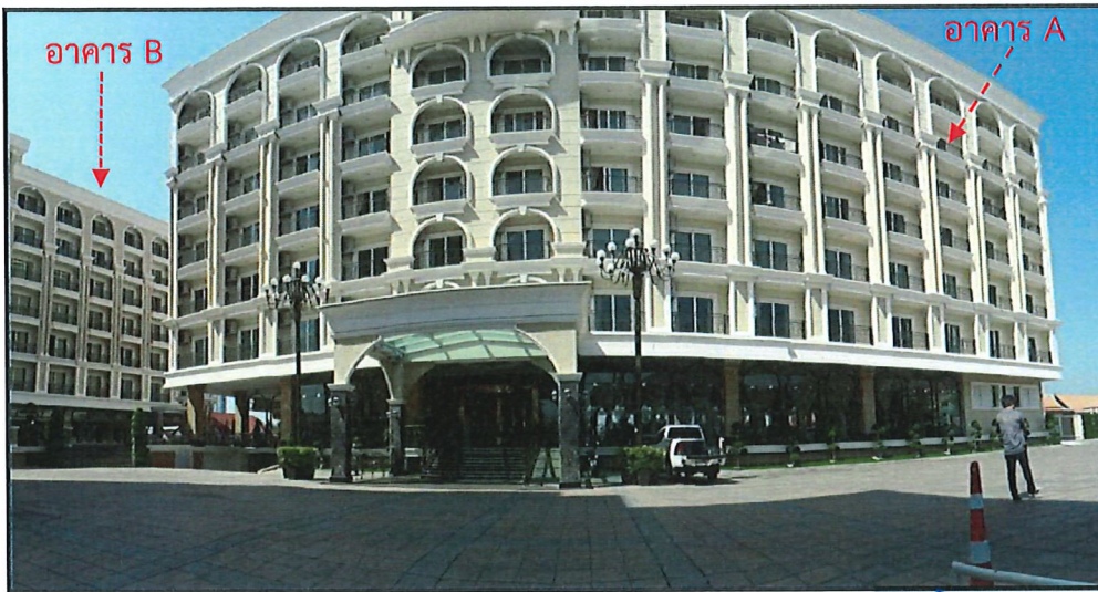
อาคาร A อาคารโรงแรม สูง 7 ชั้น มีชั้นใต้ดิน 1 ชั้น