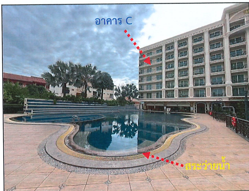
สระว่ายน้ำ จำนวน 1 สระ

แสดงสภาพพื้นที่โครงการปัจจุบัน โครงการ LK Celestite ภาพถ่ายเมื่อเดือนธันวาคม 2567