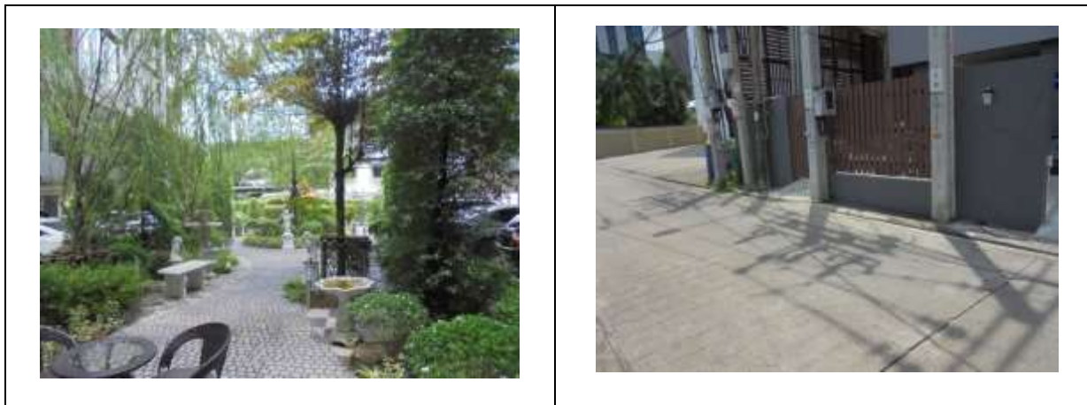
รูปที่ 1.7-1 สถานภาพปัจจุบันของโครงการ

สถานภาพของโครงการในปัจจุบัน ขณะทำการสำรวจเมื่อเดือนกรกฎาคม 2567 พบว่า โครงการอยู่ในช่วงระยะดำเนินการ แสดงสถานภาพโครงการในปัจจุบันได้ดังรูปที่ 1.7-1