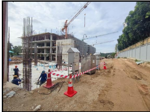
รูปที่ 1.20-1 สถานภาพการก่อสร้างโครงการปัจจุบัน เดือนกรกฎาคม – เดือนธันวาคม 2567

เดือนกรกฎาคม – ธันวาคม 2567 โครงการมีการดำเนินกิจกรรมระยะก่อสร้าง มีความคืบหน้าของโครงการโดยรวมแสดงดังรูปที่ 1.20-1