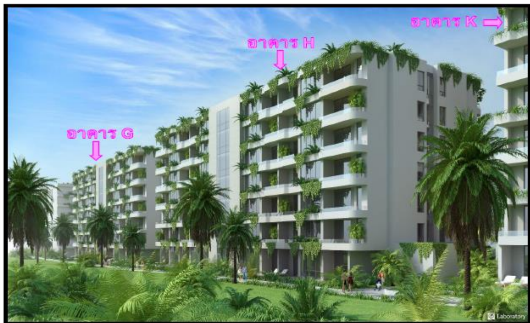
รูปที่ 1.8-1 ภาพจำลองโครงการ (ที่มา : บริษัท เดอะ ภูเก็ต แฟมมิลี่ การ์เด้น จำกัด)