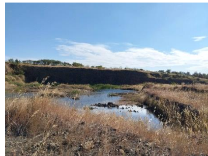
พื้นที่หน้าเมืองปัจจุบัน