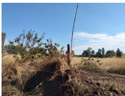
แนวเวนพื้นที่ทำเหมือง