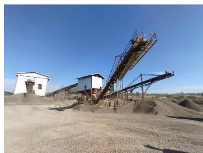
พื้นที่โรงโม่หินของโครงการ