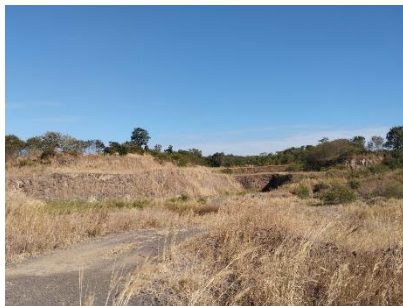
พื้นที่หน้าเมืองปัจจุบัน