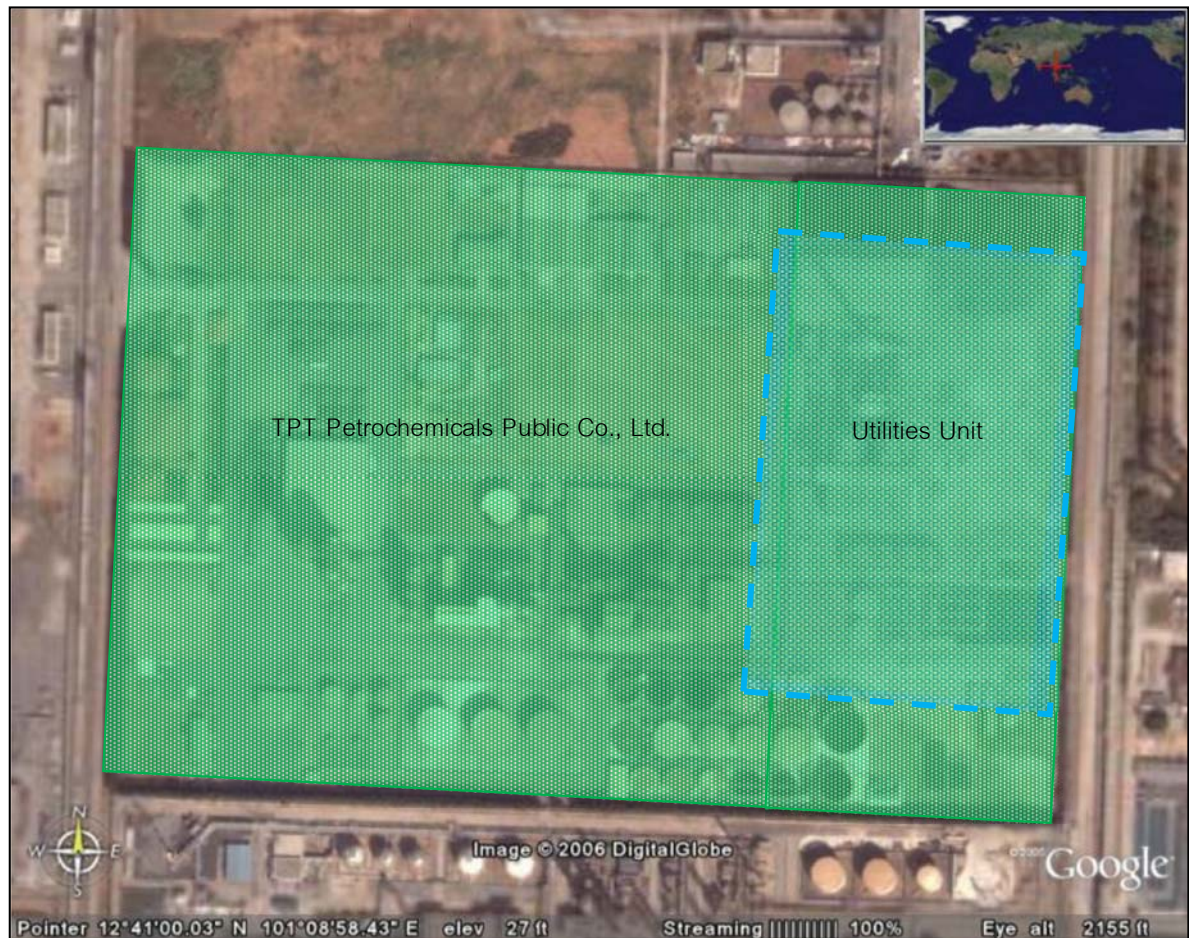
ภาพที่ 1-2 แผนผังแสดงพื้นที่โครงการ