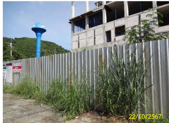
ภาพที่ 5 รื้อที่บริเวณพื้นที่ก่อสร้าง