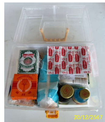
ภาพที่ 13 อุปกรณ์ปฐมพยาบาลและเวชภัณฑ์พื้นฐาน