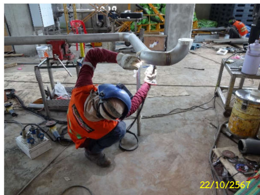
ภาพที่ 17 คนงานสวมใส่อุปกรณ์ป้องกันอันตราย ส่วนบุคคล (PPE)