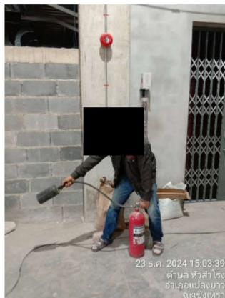
ภาพที่ 16 การอบรมการใช้งานถังดับเพลิง ให้กับคนงาน