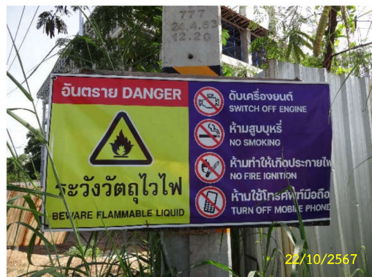
ภาพที่ 19 ป้ายเตือนห้ามสูบบุหรี่