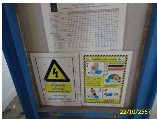
ภาพที่ 18 ป้ายเตือนอันตรายบริเวณพื้นที่เสี่ยง