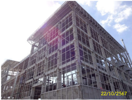
ภาพที่ 1 สภาพพื้นที่โครงการในปัจจุบัน