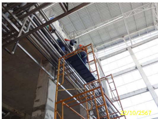
ภาพที่ 22 คนงานที่ทำงานบนที่สูงสวมใส่อุปกรณ์ป้องกันอันตรายส่วนบุคคล (PPE)