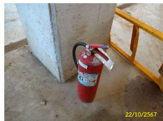
ภาพที่ 15 อุปกรณ์ป้องกันอัคคีภัย