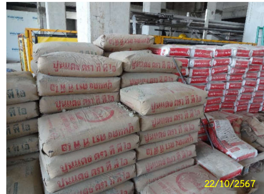
ภาพที่ 3 การจัดเก็บวัสดุอุปกรณ์ก่อสร้าง