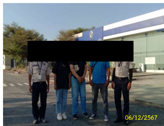
ภาพที่ 7 เจ้าหน้าที่ของบริษัทผู้รับเหมา เข้าพบปะสถานประกอบการที่อยู่ใกล้เคียง