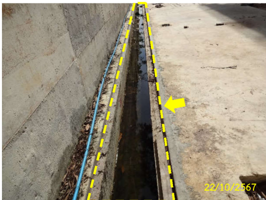
ภาพที่ 10 รางระบายน้ำภายในพื้นที่โครงการ