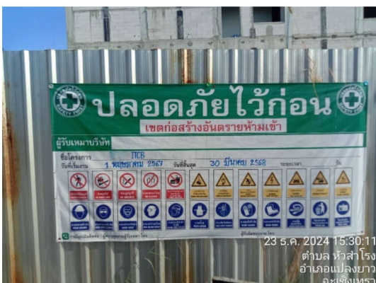
ภาพที่ 6 ป้ายแสดงรายละเอียดโครงการ