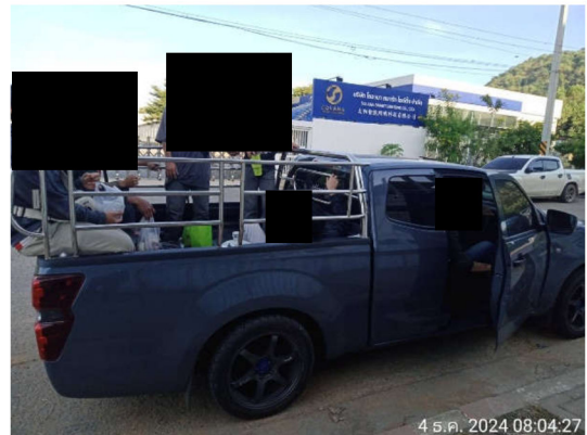
ภาพที่ 11 รถรับส่งคนงาน