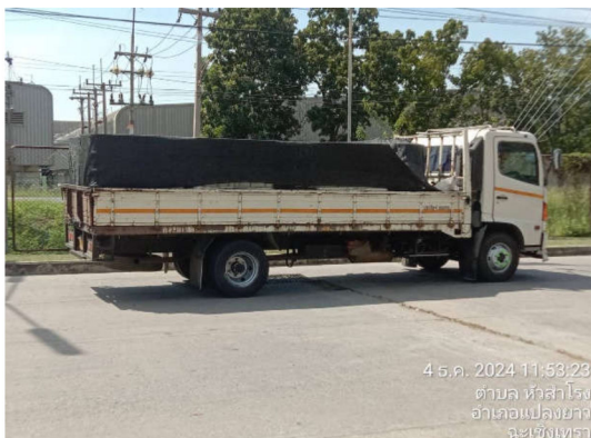
ภาพที่ 4 รถบรรทุกอุปกรณ์และวัสดุก่อสร้าง ที่มีผ้าใบหรือวัสดุปิดคลุม