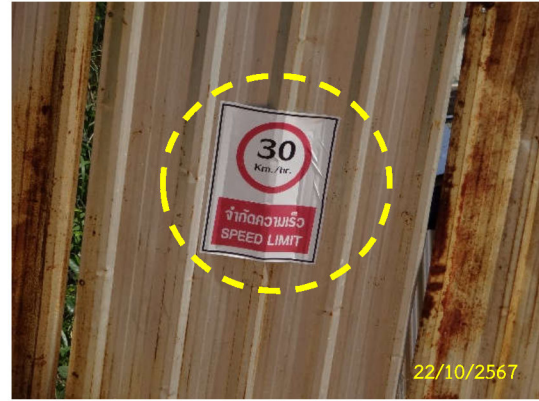
ภาพที่ 2 ป้ายควบคุมความเร็วรถ