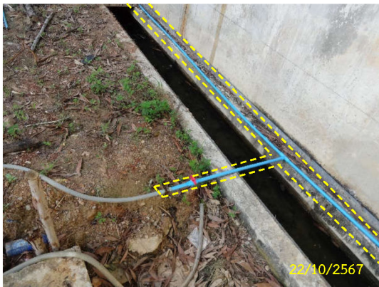
ภาพที่ 8 ท่อประปาภายในพื้นที่โครงการ