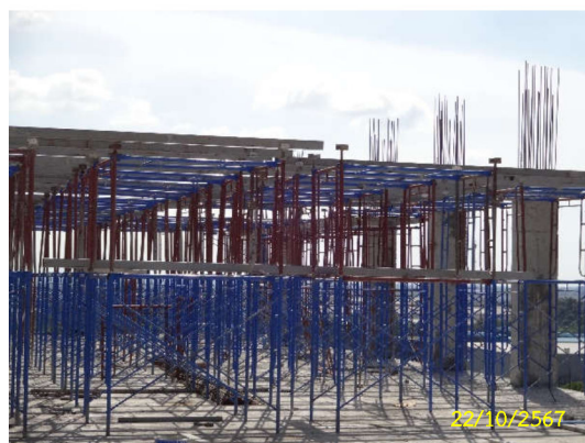
ภาพที่ 21 นั่งร้าน