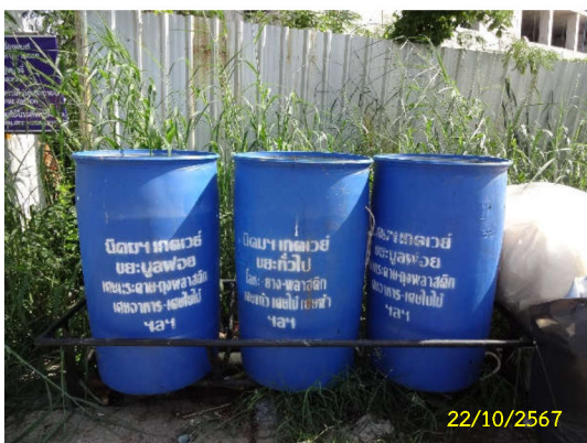
ภาพที่ 12 ถังพักขยะมูลฝอย