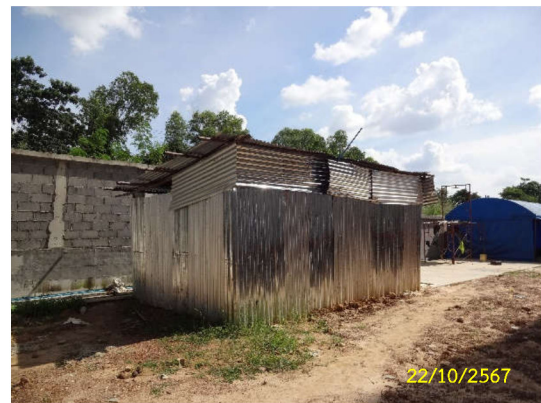
ภาพที่ 9 ห้องสุขาสำหรับคนงาน