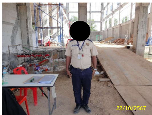
ภาพที่ 20 เจ้าหน้าที่รักษาความปลอดภัย พื้นที่ก่อสร้าง