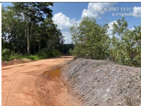
รูป M จัดสร้างทำนบดินโดยรอบ