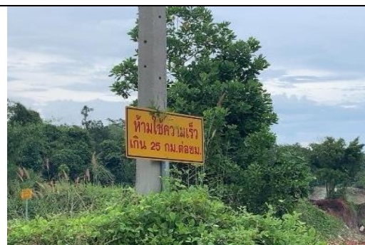
รูป N มีป้ายเตือนระวางรถบรรทุก ป้ายหยุดรถ ป้ายควบคุม ความเร็วรถ เป็นต้น