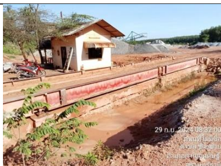
รูป AC การสร้างครุฑบายน้ำ