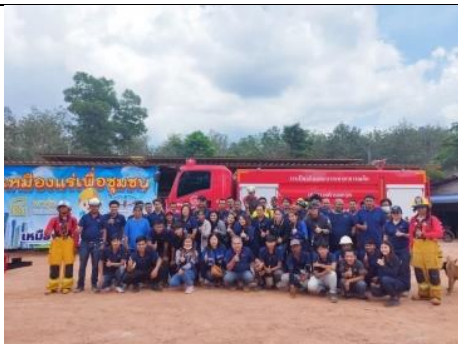
รูป Y การอบรมพนักงานเรื่องความปลอดภัย