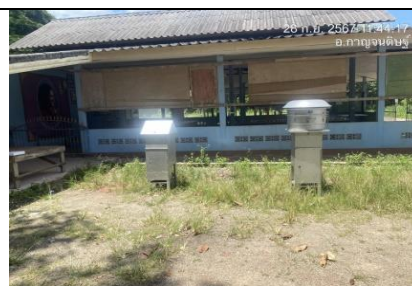
รูป V : ตรวจวัดปริมาณฝุ่นละอองแขวนลอยในบรรยากาศเฉลี่ยในรอบ 24 ชั่วโมงเป็นเวลา 3 วันต่อเนื่อง โดยใช้เครื่อง High Volume Air Sampler จำนวน 2 สถานี