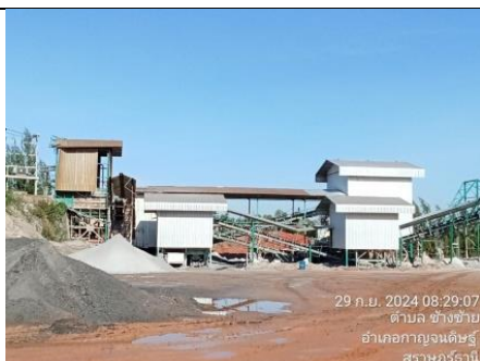
รูป Q สร้างอาคารปิดคลุม Hopper, Primary Crusher และตระแกรงคัดขนาดแร่ พร้อมทั้งติดตั้งระบบสเปรย์น้ำ