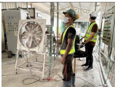
รูป O มีการจัดหาและกำชับให้พนักงานทุกคนสวมใส่ อุปกรณ์ป้องกันอันตรายส่วนบุคคล