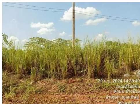
รูป G บริเวณที่เก็บกองเปลือกดิน