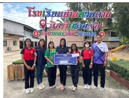
รูป T มีการสนับสนุนกิจกรรมส่งเสริมสุขภาพ และจัดกิจกรรม CSR ภายในชุมชนรอบพื้นที่โครงการอย่างต่อเนื่อง