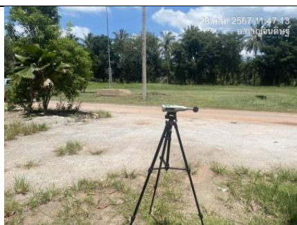
รูป W ตรวจวัดระดับความดังของเสียงเฉลี่ยโดยทั่วไปในรอบ 24 ชั่วโมง เป็นเวลา 3 วันต่อเนื่อง จำนวน 2 สถานี