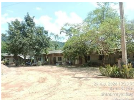
รูป AA การจัดหาที่พักอาศัยแก่พนักงาน