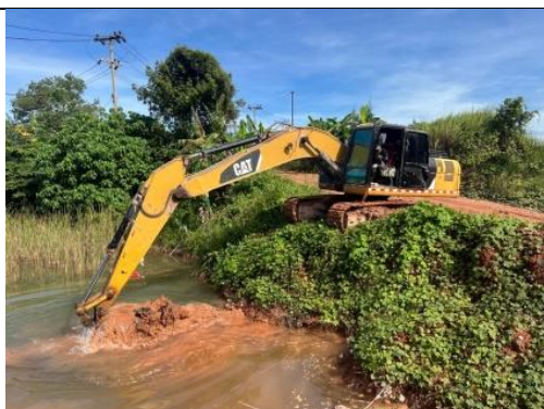
รูป E บ่อดักตะกอน