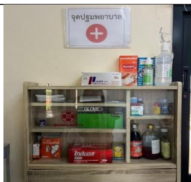
รูป P มีการจัดเตรียมตู้ปฐมพยาบาลไว้ในอาคารสำนักงาน