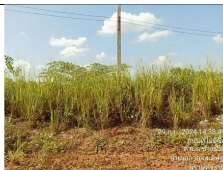
รูป L การปลูกต้นไม้และปล่อยให้วัชพืชปกคลุมบนคัน ทำนบดินรอบเขตประทานบัตร และที่เก็บกองป่เลือกดิน