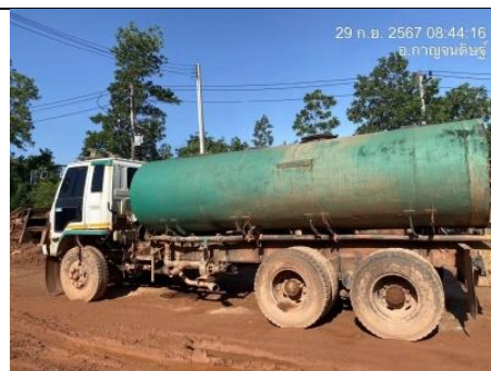
รูป R ใช้รถบรรทุกพ่นน้ำฉีดพรมถนน