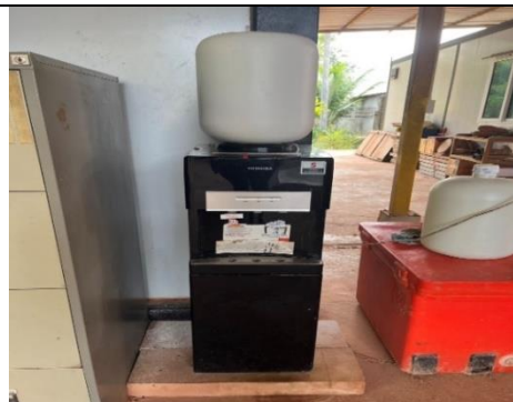
รูป Z การจัดหาน้ำดื่มที่สำนักงานและที่พักอาศัย