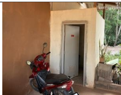
รูป AB การจัดหาส่วนที่สุขลักษณะที่สำนักงานและที่พักอาศัย