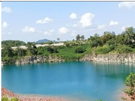
รูป A หน้าเหมืองปัจจุบัน