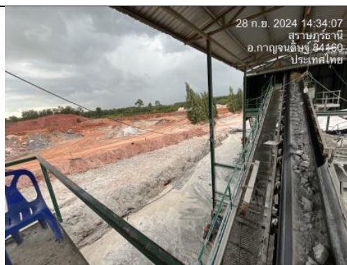
รูป D คูระบายน้ำบริเวณโรงแต่งแร่