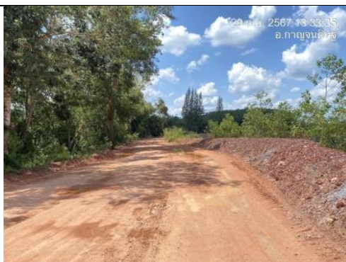
รูป I ถนนภายในโครงการ