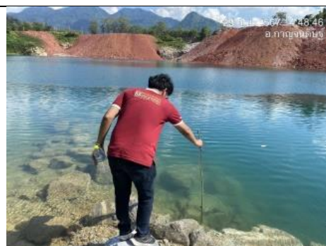
รูป X ได้ตรวจวัดคุณภาพน้ำผิวดินและน้ำใต้ดิน จำนวน 5 สถานี