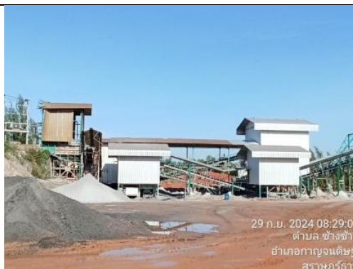
รูป H การปิดคลุมโรงแต่งแร่