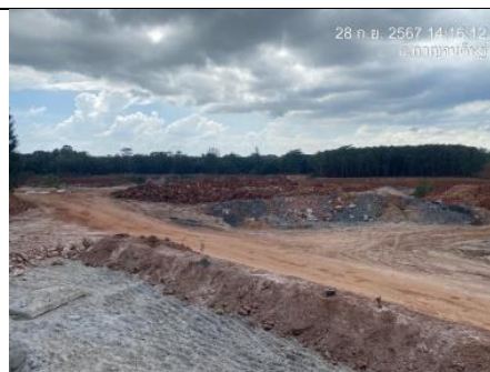
รูป AD การสร้างครุฑบายน้ำ