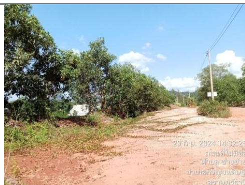
รูป J ถนนภายนอกโครงการ