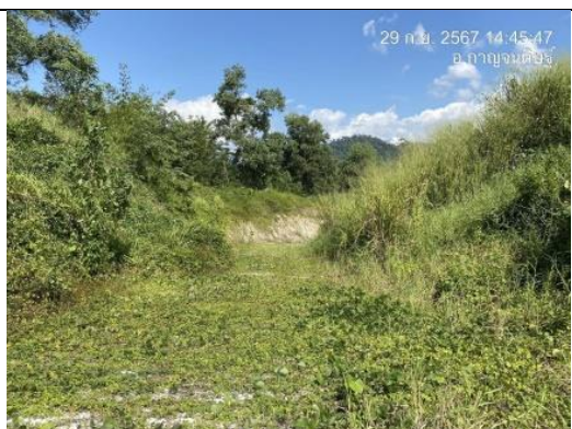
รูป C คูระบายน้ำรอบที่เก็บกองเปลือกดิน