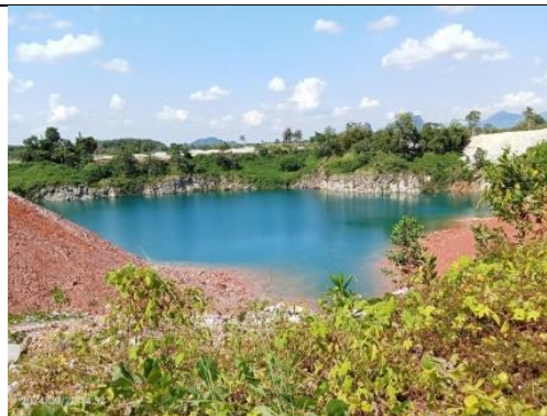
รูป B Sump ในบ่อเหมือง