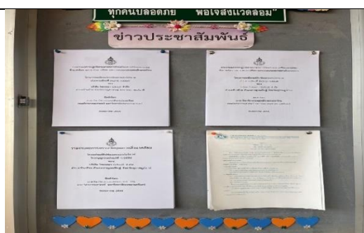
รูป AE การติดป้ายประชาสัมพันธ์ผลการปฏิบัติตามมาตรการสิ่งแวดล้อม