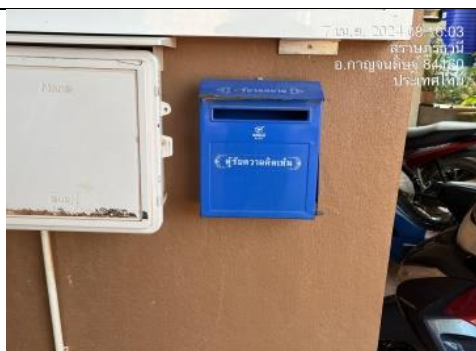
รูป K กล่องรับเรื่องร้องทุกข์