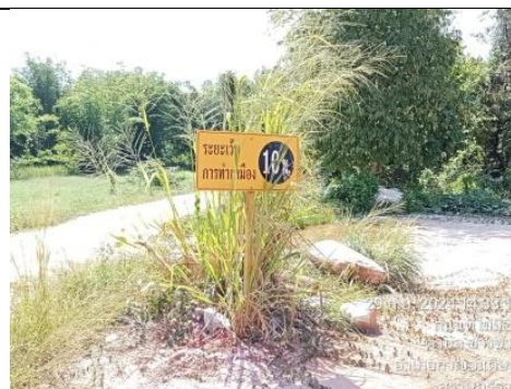
รูป F เว้นแนวเขตไม่ทำเหมืองในระยะ 10 และ 20 ม