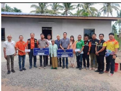
รูป U มีการสนับสนุนกิจกรรมส่งเสริมสุขภาพ และจัดกิจกรรม CSR ภายในชุมชน