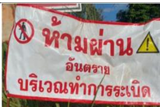
รูป S ติดป้ายเตือนเขตการใช้วัตถุระเบิด