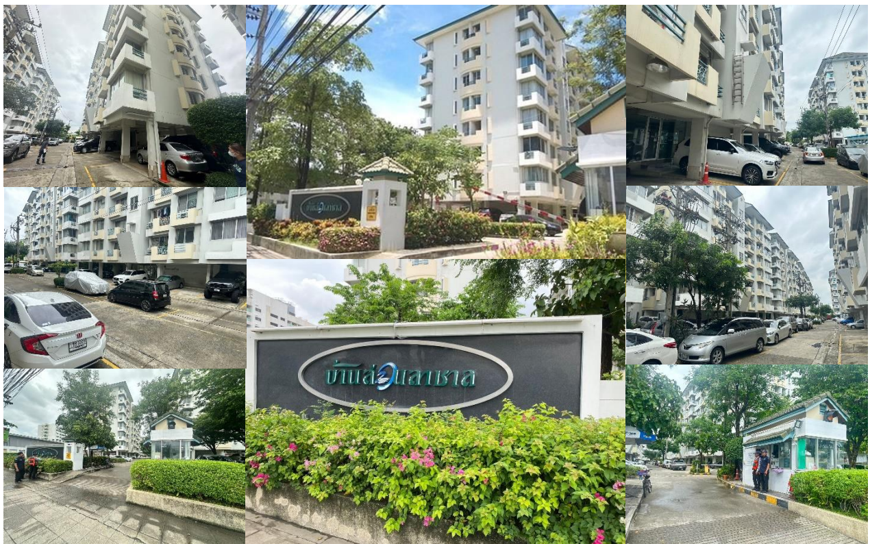
รูปที่ 1-2 สภาพปัจจุบันของโครงการ

ปัจจุบันโครงการได้เปิดดำเนินการแล้ว เป็นโครงการเป็นอาคารชุดพักอาศัยขนาดความสูง 8 ชั้น จำนวน 11 อาคาร มีจำนวนห้องชุดพักอาศัยทั้งสิ้น 319 ห้อง และที่จอดรถยนต์ 184 คัน พร้อมระบบสาธารณูปโภคต่างๆ ครบ ครัน บนเนื้อพื้นที่ประมาณ 5 ไร่ 3 งาน 15 ตารางวา (22.95 เมตร)