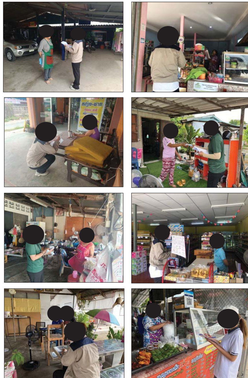
รูปที่ 2.4.4-1 ภาพบรรยากาศการลงพื้นที่สำรวจความคิดเห็นกลุ่มเป้าหมายในพื้นที่ศึกษา

ดำเนินการช่วงเดือนสิงหาคม-ตุลาคม พ.ศ. 2567