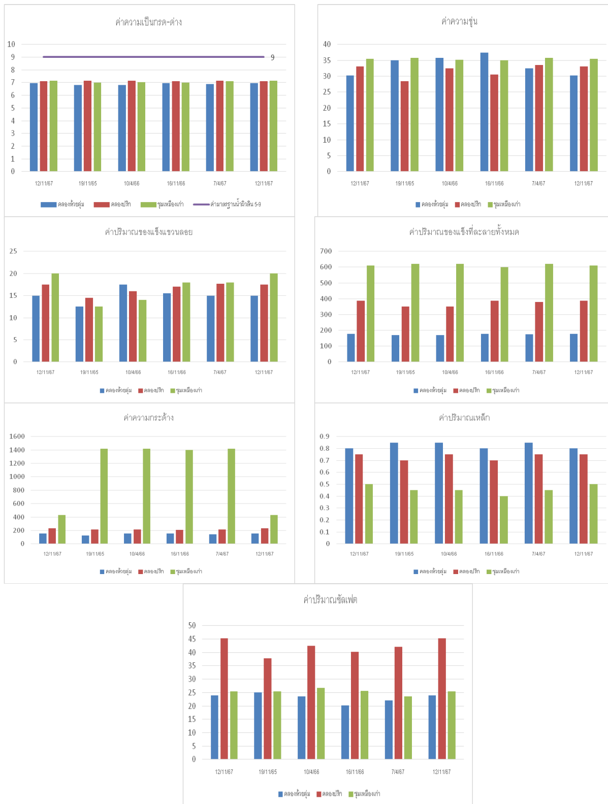
รูปที่ 3-3 กราฟแสดงการตรวจวัดคุณภาพน้ำผิวดินปีพ.ศ. 2565-2567