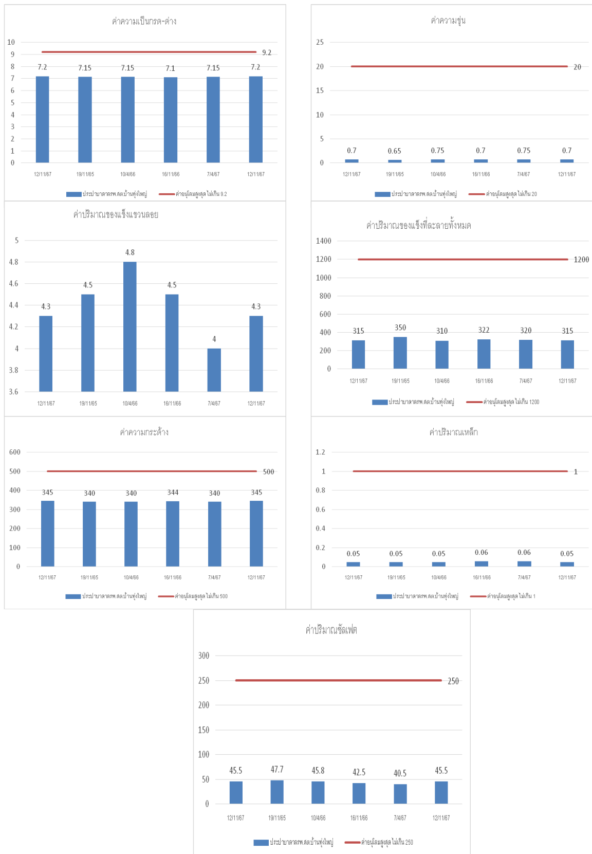
รูปที่ 3-4 กราฟแสดงการตรวจวัดคุณภาพน้ำใต้ดินปีพ.ศ. 2565-2567