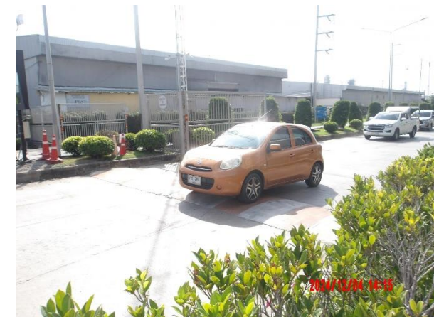
รูปที่ 2-5 สันหนชะลอความเร็วรถภายในโครงการ