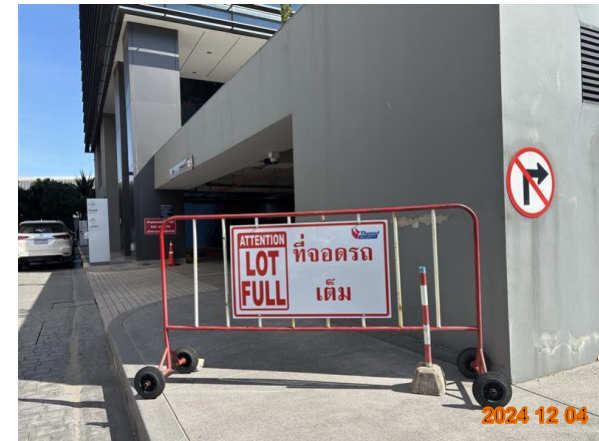
รูปที่ 2-35 ป้ายแนะนำ บริเวณทางเดินรถ