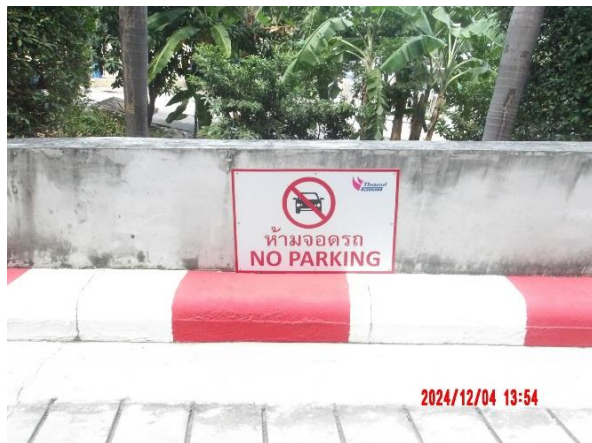
รูปที่ 2-40 ติดตั้งป้ายเตือนห้ามจอดบริเวณทางเข้า-ออกโครงการ