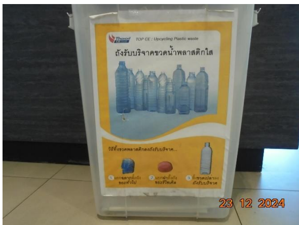
รูปที่ 2-23 ติดป้ายรณรงค์และประชาสัมพันธ์การคัดแยกมูลฝอยก่อนทิ้งลงถัง