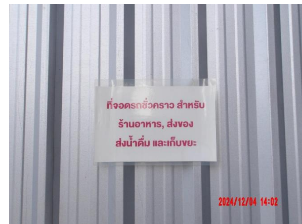
รูปที่ 2-24 ติดตั้งป้ายที่จอดรถเฉพาะรถเก็บขนมูลฝอย