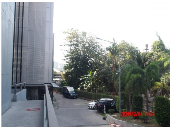
รูปที่ 2-27 ติดตั้งไฟส่องสว่างบริเวณแนวรั้ว