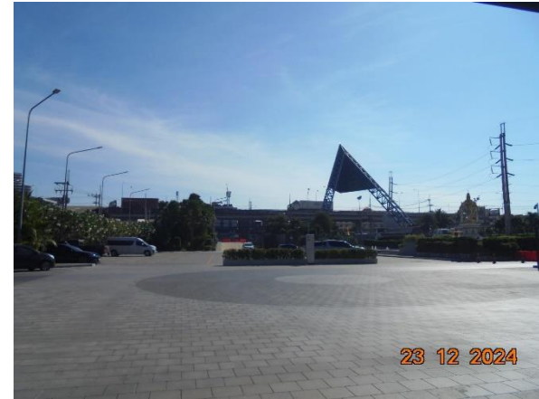
รูปที่ 2-48 จัดให้มีทางเดินรถดับเพลิงขนาดใหญ่