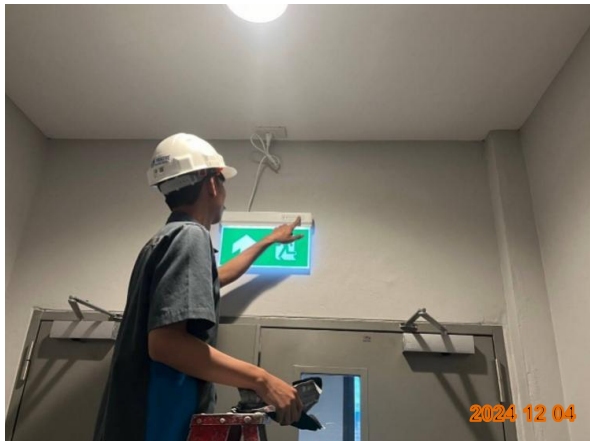
รูปที่ 2-43 จัดให้มีเจ้าหน้าที่ตรวจตราดูแลอุปกรณ์เครื่องหมายและสัญญาณต่าง ๆ