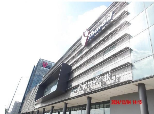
รูปที่ 2-39 อาคารสำนักงาน และการติดตั้งป้ายชื่อโครงการ