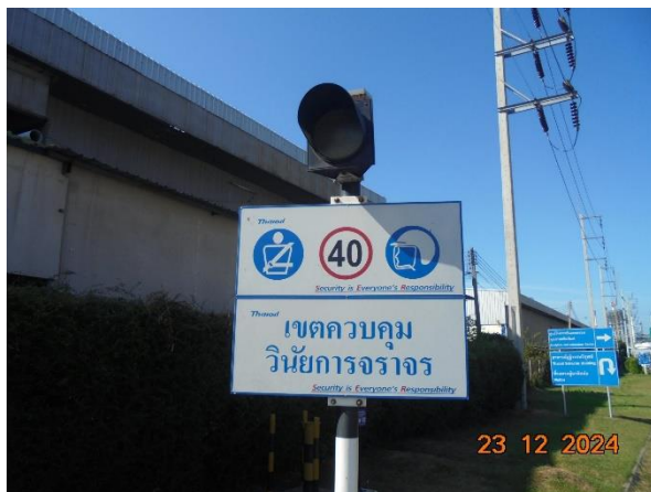
รูปที่ 2-4 ป้ายควบคุมความเร็ว