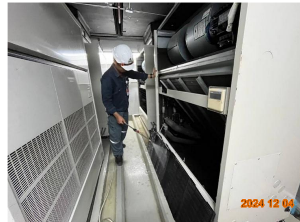
รูปที่ 2-50 ทำความสะอาดแผงกรองอากาศเครื่องส่งลมเย็น