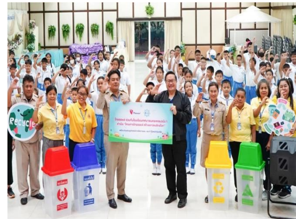
รูปที่ 2-42 จัดทำโครงการชุมชนสัมพันธ์ต่าง ๆ