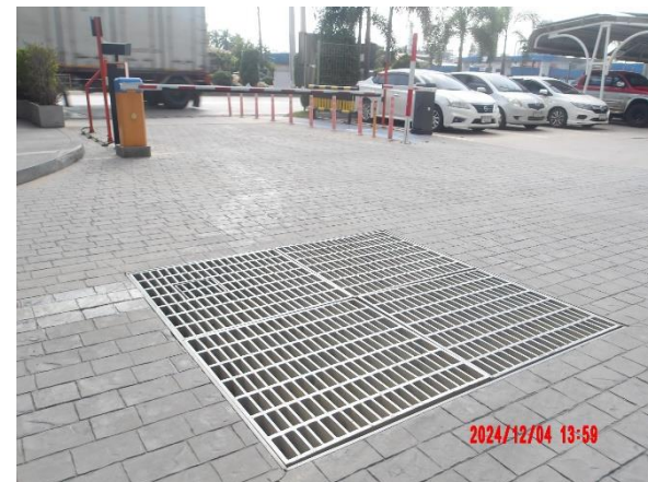
รูปที่ 2-20 บ่อพักน้ำสุดท้ายของโครงการ