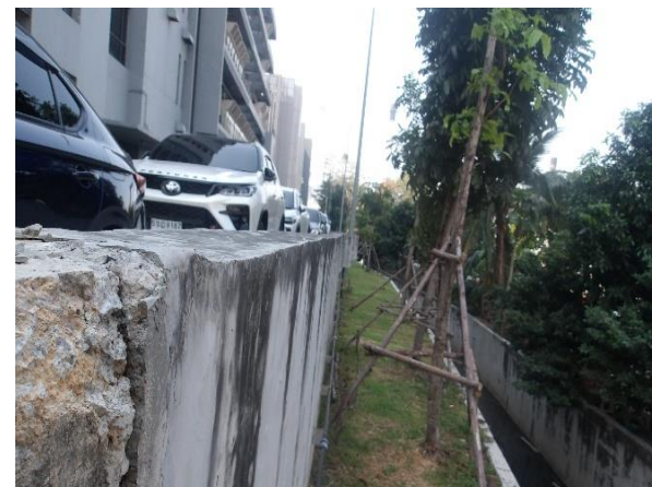
รูปที่ 2-2 จัดทำรั้วทึบบริเวณแนวเขตที่ดิน และรั้วโปร่งบริเวณแนวเขตที่ดินด้านทิศเหนือของโครงการ เพื่อป้องกันการพังทลายของดินและสร้างความเป็นส่วนตัวแก่พื้นที่ข้างเคียง