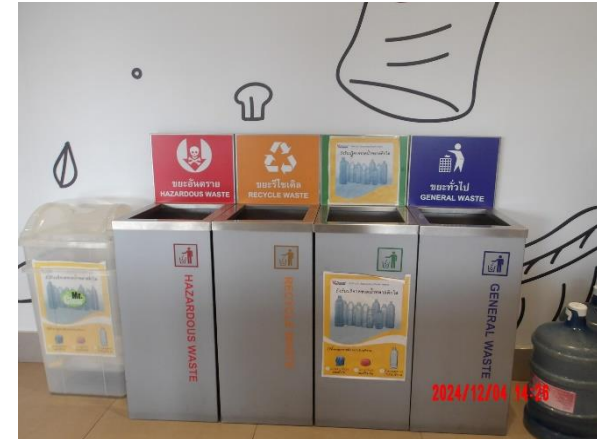
รูปที่ 2-22 ถังรองรับขยะมูลฝอยประจำชั้น