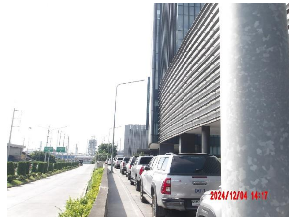
รูปที่ 2-33 เลือกใช้สายไฟฟ้าและสายสื่อสารโทรคมนาคมแบบระบบสายใต้ดิน