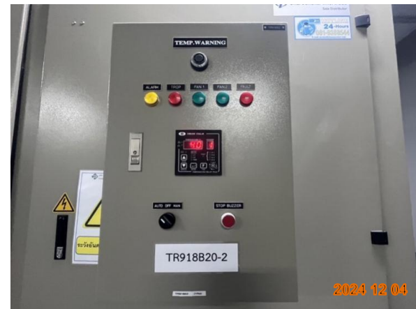
รูปที่ 2-28 ติดตั้งหม้อแปลงไฟฟ้าโดยมีระยะห่างจากแนวเขตที่ดิน ไม่น้อยกว่า 1 เมตร