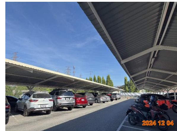
รูปที่ 2-41 จัดเตรียมพื้นที่จอดรถสำหรับ