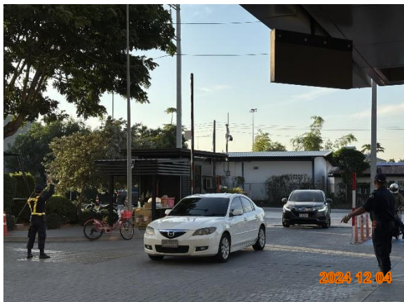
รูปที่ 2-8 เจ้าหน้าที่อำนวยความสะดวกบริเวณทางเข้า-ออกโครงการ โดยเฉพาะในช่วงชั่วโมงเร่งด่วนเช้าเย็น