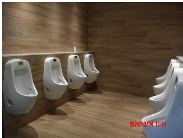
รูปที่ 2-11 (ต่อ) เลือกใช้อุปกรณ์ประหยัดน้ำ เช่น โกลุขภัณฑ์ ก๊อกน้ำ เป็นต้น