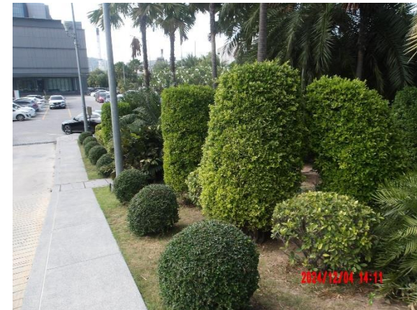
รูปที่ 2-1 ปลุกหญ้าหรือพืชคลุมดินบริเวณพื้นที่ลาดชันภายในพื้นที่โครงการ เพื่อป้องกันการพังทลายของดิน