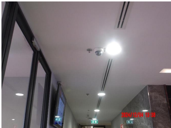
รูปที่ 2-49 จัดให้มีโทรทัศน์วงจรปิด (CCTV)