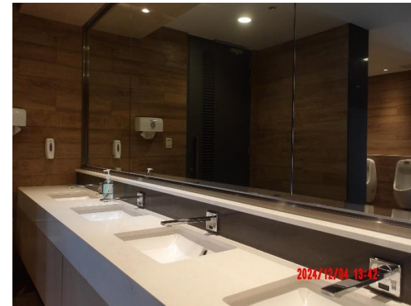
รูปที่ 2-11 เลือกใช้อุปกรณ์ประหยัดน้ำ เช่น โกลุขภัณฑ์ ก๊อกน้ำ เป็นต้น