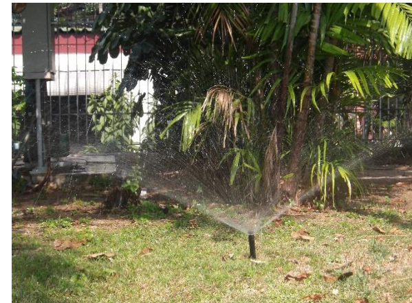
รูปที่ 2-14 การหมุนเวียนน้ำทิ้งที่ผ่านการบำบัดแล้ว โดยนำกลับมารดน้ำต้นไม้ ภายในโครงการ