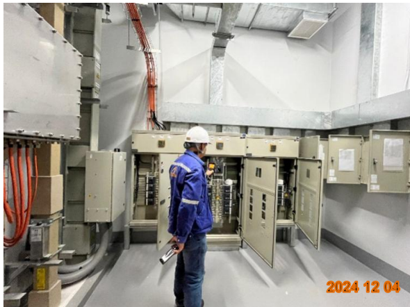
รูปที่ 2-53 ตรวจสอบสภาพอุปกรณ์ไฟฟ้า