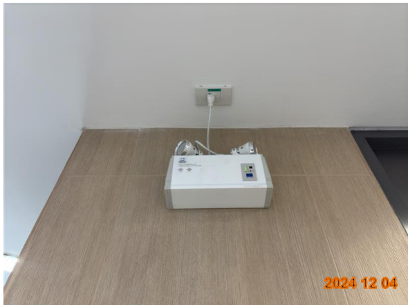
รูปที่ 2-34 ติดตั้งเครื่องสำรองไฟฟ้าใช้กรณีฉุกเฉิน