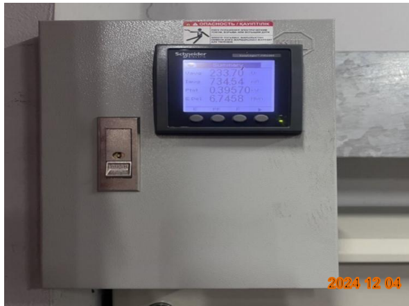
รูปที่ 2-13 ติดตั้งมาตรวัดไฟฟ้าในส่วนของระบบบำบัดน้ำเสีย แยกออกจากส่วนอื่นๆ