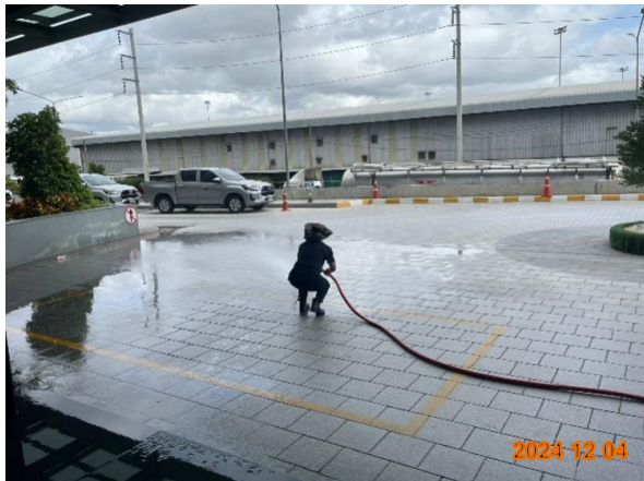
รูปที่ 2-6 ดูแลรักษาความสะอาดบริเวณถนนส่วนกลาง โดยฉีดล้างถนนเป็นครั้งคราว