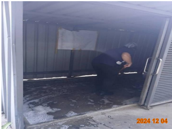
รูปที่ 2-25 ทำความสะอาดห้องพัสดุฝอยรวมทุกครั้ง หลังเก็บขนมูลฝอย