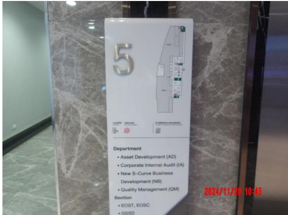
รูปที่ 2-47 ประชาสัมพันธ์การใช้อุปกรณ์ป้องกันอัคคีภัย แผนการป้องกันอัคคีภัยและแผนการอพยพรวมแก่ผู้เข้าพื้นที่และพนักงาน