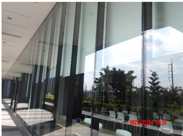
รูปที่ 2-32 การติดตั้งมู่ลี่กันสาดป้องกันแสงแดด