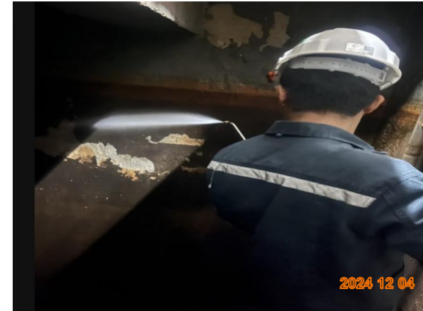
รูปที่ 2-52 ล้างทำความสะอาดถึงส้วรองน้ำใช้ทุกแห่ง