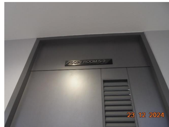
รูปที่ 2-31 (ต่อ) การเลือกใช้เครื่องใช้ไฟฟ้าและอุปกรณ์ต่างๆ เพื่อประหยัดพลังงาน