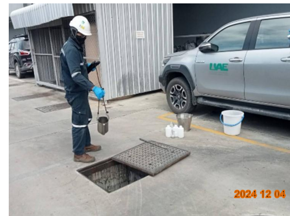
รูปที่ 2-12 เจ้าหน้าที่ดูแลการเดินระบบบำบัดน้ำเสีย