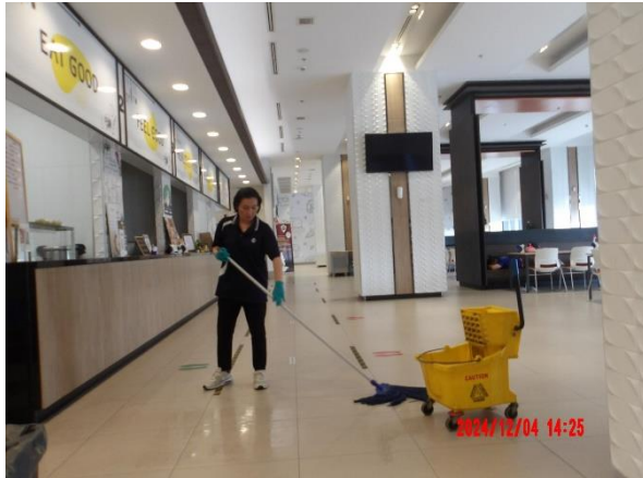
รูปที่ 2-21 จัดให้มีพนักงานทำความสะอาดเก็บรวบรวมมูลฝอยที่เกิดขึ้นแต่ละชั้น ไปยังห้องพักมูลฝอยรวม