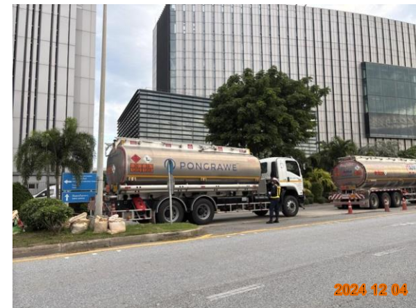
รูปที่ 2-37 จัดให้มีเจ้าหน้าที่อำนวยความสะดวกการจราจร ประจำจุดเสี่ยงอันตราย