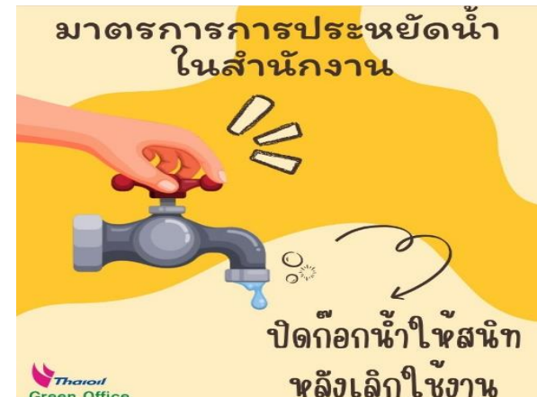
รูปที่ 2-9 ติดป้ายรณรงค์และประชาสัมพันธ์การการใช้น้ำ อย่างประหยัด