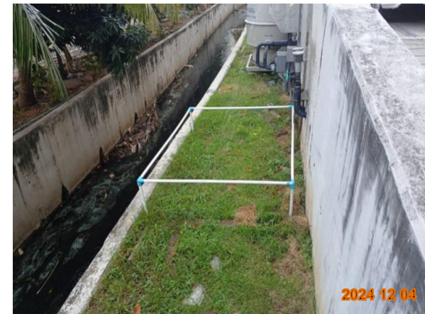
รูปที่ 2-16 จัดให้มีการกันดินในบริเวณพื้นที่บ่อมีเทนให้มีขอบเขตที่ชัดเจน