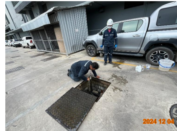
รูปที่ 2-54 ตรวจสอบปริมาณตะกอนที่สะสมบริเวณท่อระบายน้ำในพื้นที่โครงการ