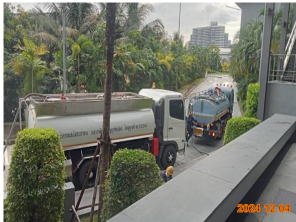
รูปที่ 2-15 ประสานงานกับรถสูบล้างถังของเอกชน เพื่อสูบน้ำมันของระบบบำบัดน้ำเสียไปกำจัดต่อไป