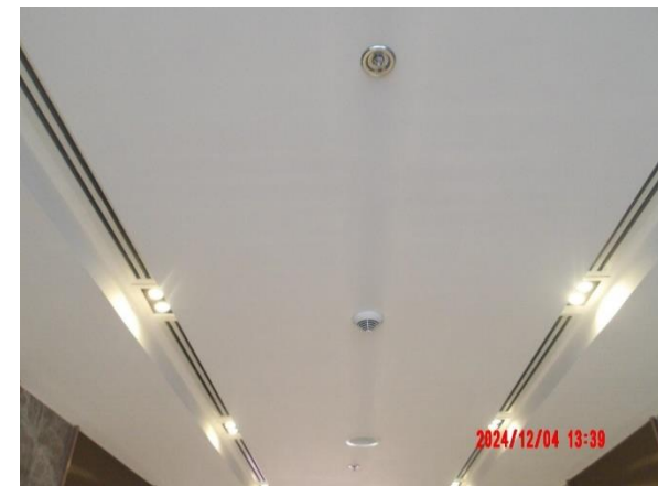
รูปที่ 2-44 (ต่อ) จัดให้มีระบบป้องกันอัคคีภัย