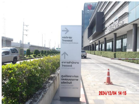
รูปที่ 2-38 ติดตั้งป้ายและเครื่องหมายแสดงทางเข้า-ออกอย่างชัดเจน