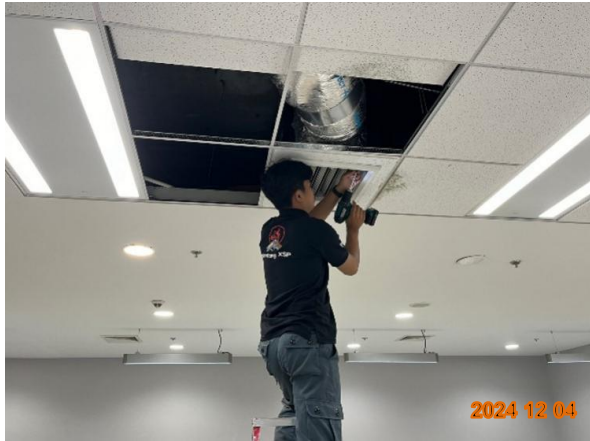
รูปที่ 2-51 ตรวจสอบการรั่วของท่อลม