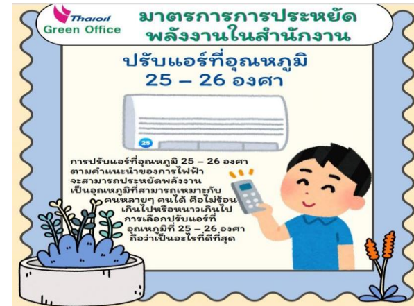
รูปที่ 2-30 การประชาสัมพันธ์และให้คำแนะนำวิธีการประหยัดไฟฟ้า แก่พนักงานภายในโครงการ