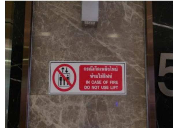
รูปที่ 2-44 (ต่อ) จัดให้มีระบบป้องกันอัคคีภัย