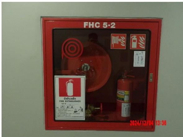
รูปที่ 2-44 (ต่อ) จัดให้มีระบบป้องกันอัคคีภัย