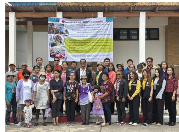
รูปที่ 2-46 ฝึกอบรมเจ้าหน้าที่เกี่ยวกับการป้องกันอัคคีภัยของโครงการ