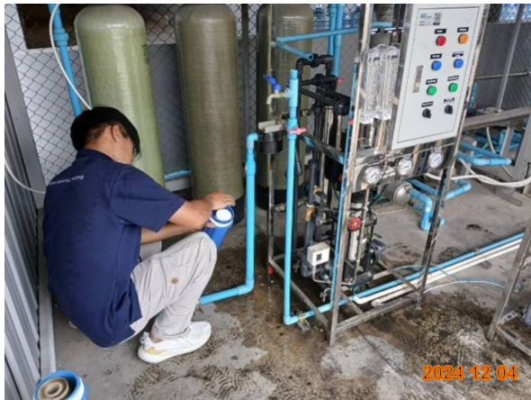
รูปที่ 2-10 เจ้าหน้าที่ดูแลรักษาระบบเส้นท่อประปา การรั่วไหลของน้ำ