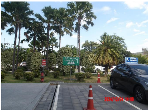
รูปที่ 2-19 จุฬรวมพล