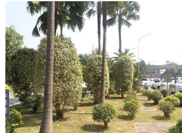
รูปที่ 2-3 ดูแลและบำรุงรักษาพื้นที่สีเขียวภายในพื้นที่โครงการ ให้อยู่ในสภาพที่สมบูรณ์ตลอดช่วงเปิดดำเนินการ