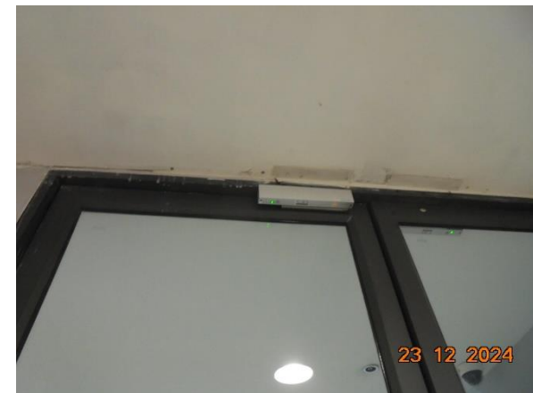
รูปที่ 2-31 การเลือกใช้เครื่องใช้ไฟฟ้าและอุปกรณ์ต่าง ๆ เพื่อประหยัดพลังงาน