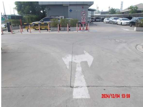
รูปที่ 2-36 เครื่องหมายบนพื้นทางแสดงทิศทางการจราจร