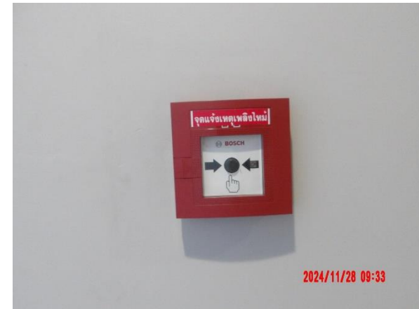
รูปที่ 2-44 จัดให้มีระบบป้องกันอัคคีภัย