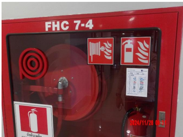
รูปที่ 2-45 ตรวจสอบประสิทธิภาพของอุปกรณ์สำหรับระบบดับเพลิงเป็นประจำทุกเดือน