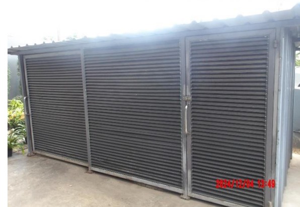
รูปที่ 2-26 ห้องพัสดุฝอย