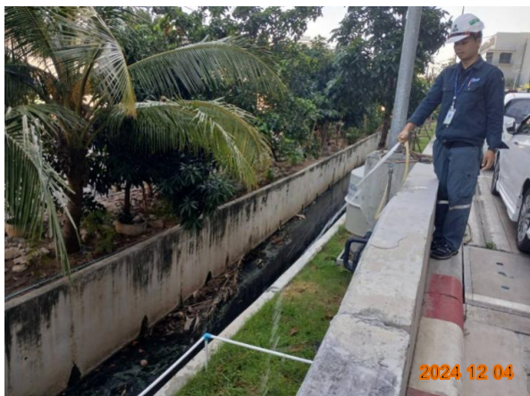
รูปที่ 2-17 การดูแลรักษาพืชคลุมดินบริเวณระบบกำจัดมีเทน