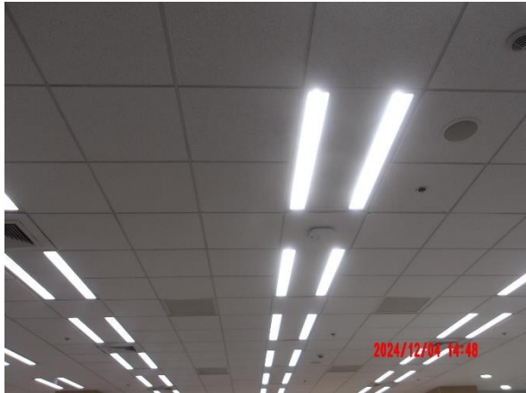
รูปที่ 2-29 เลือกใช้หลอดไฟฟ้าแบบ LED ติดตั้งภายในโครงการ